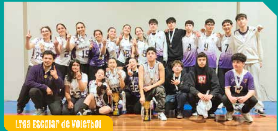
Liga Escolar de Voleibol