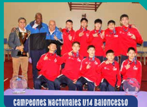
Campeones Nacionales U14 Baloncesto