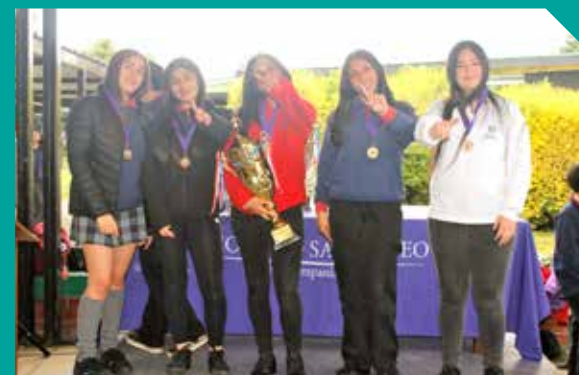
Premio Carlos Díaz