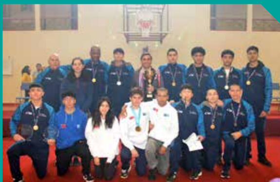
Campeones Nacionales Selección U17 y los Juegos de la Araucanía