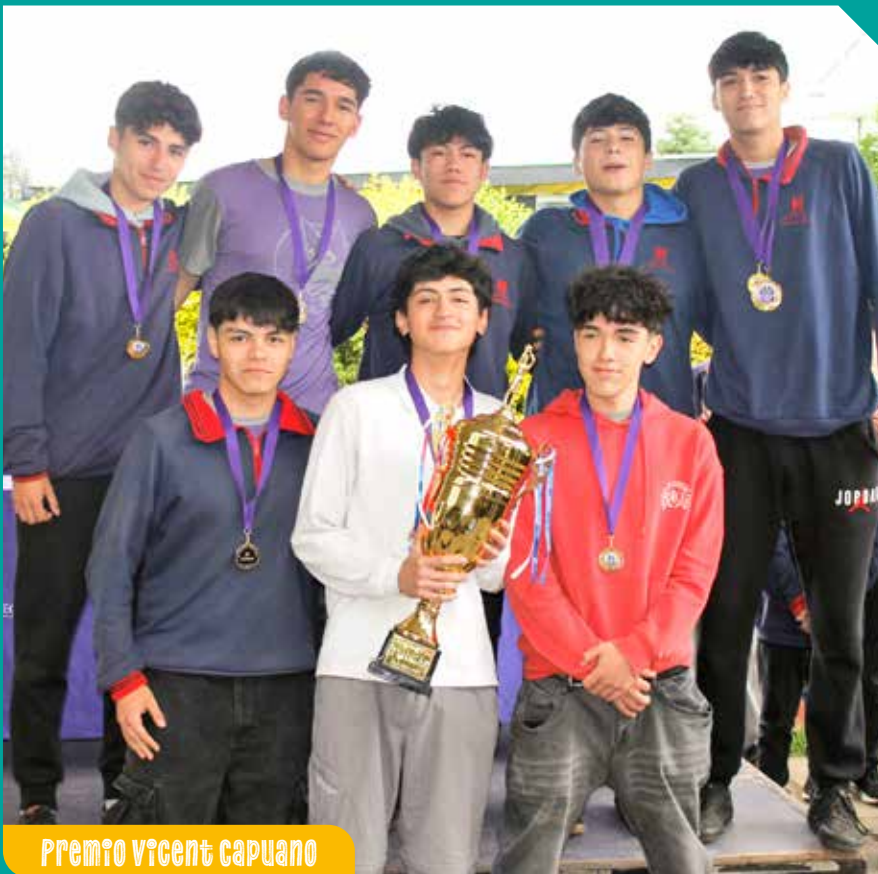
Premio Vicent Capuano