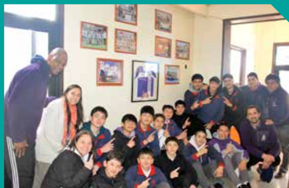
Galería de Logros