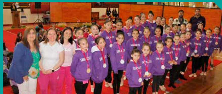
Gala de Gimnasia Rítmica Navidad