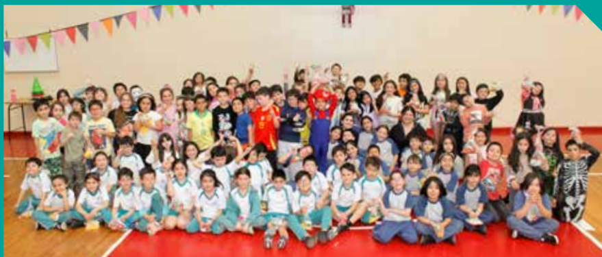
Encuentro de Motricidad