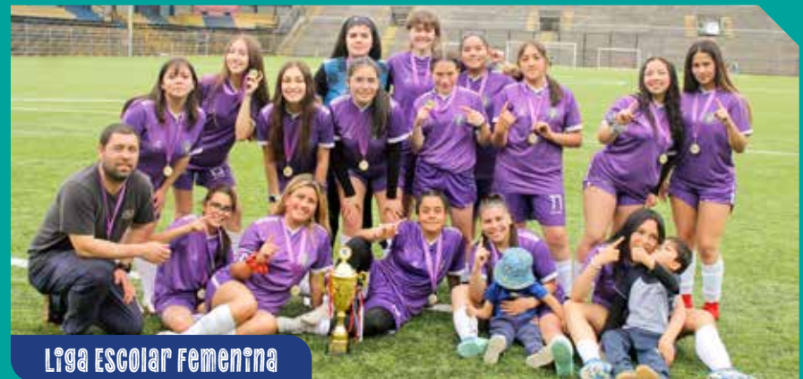
Liga Escolar Femenina