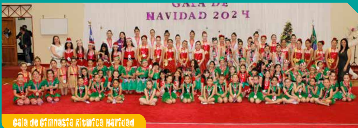
Gala de Gimnasia Rítmica Navidad