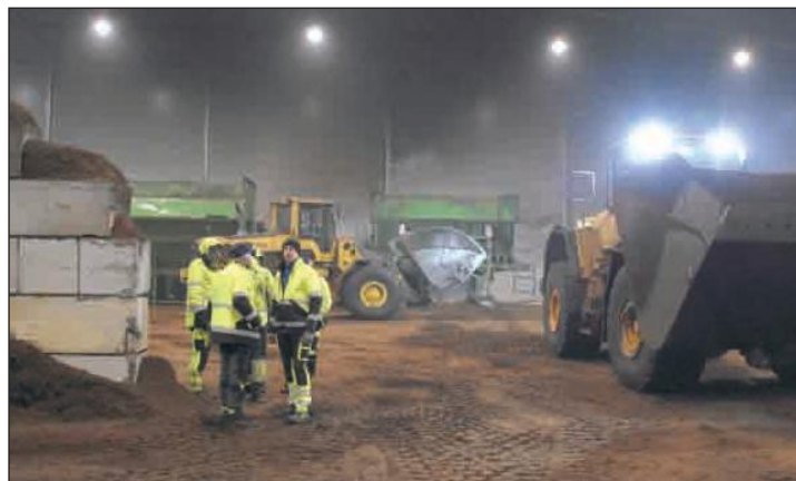
В ангаре по переработке торфа.

Эстония в год добывает на болотах для садоводства и отопления около 1,2 миллиона тонн полезного ископаемого. Как считает Мати Миил, торф в Эстонии и в других странах Балтии по качеству - лучший в мире. Этот природный ресурс, играющий