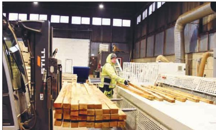
Эстонские пиломатериалы для поддонов.

Далее в ходе переработки сырьё измельчается, под давлением нагревается более чем до ста градусов - это помогает в борьбе с болезнями растений. Древесное волокно может поставляться заказчикам в чистом виде как отдельный продукт, а также в смеси с торфом.