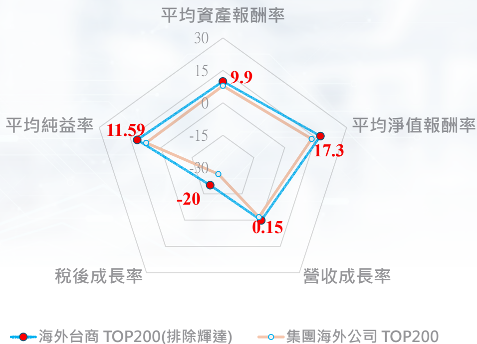
表五：海外台商與集團海外公司經營績效比較