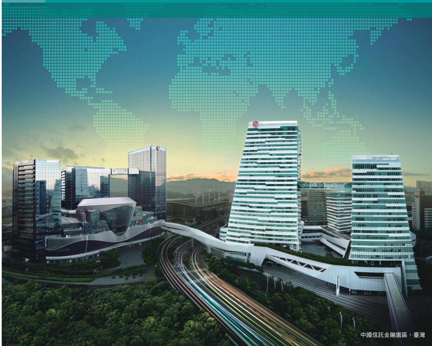
中國信託金融園區，臺灣

臺灣唯一入選全球百大銀行品牌，橫跨14個國家及地區，超過370處分支機構 於大中華、日本、北美、東南亞市場深耕逾20年 提供專業且完整跨境金融服務，是您邁向國際市場的最佳夥伴