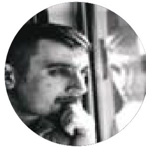
NGA KURVELESHI TEK ATA PËRTEJ OQEANIT