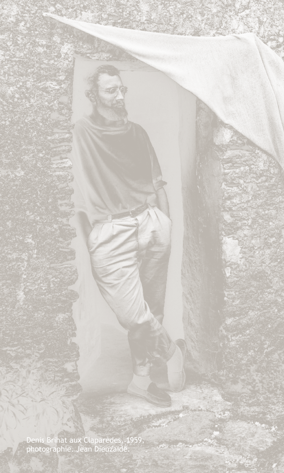
Denis Brihat aux Claparèdes, 1959, photographie.