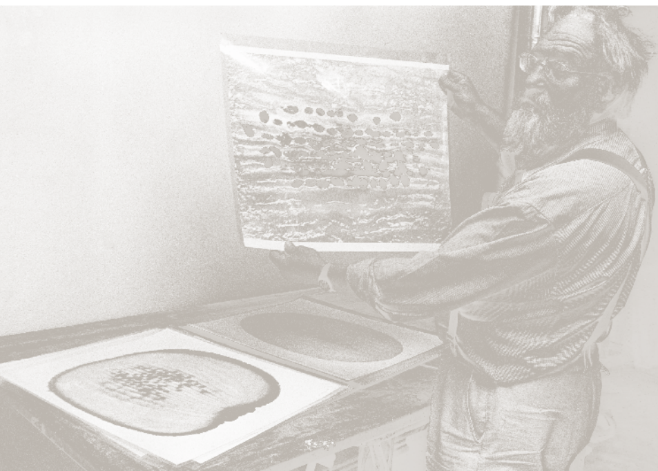
Denis Brihat par Jean Dieuzaide.

Texte pour le catalogue de l'exposition de Château d'Eau - Toulouse - avril 1980).