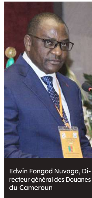
Edwin Fongod Nuvaga, Directeur général des Douanes du Cameroun

Bien qu'ayant enregistré un embellie en glissement annuel, la DGD n'a pas atteint l'objectif de 1 094,6 milliards de Fcfa contenu dans la loi