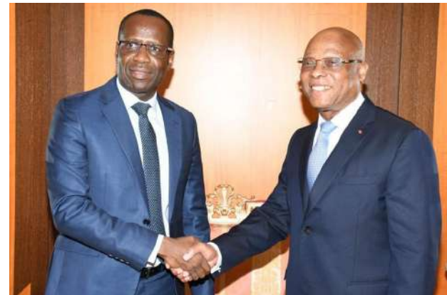
Le gouverneur de la Beac Yvon Sana Bangui (à gauche) et son homologue de la Bceao Jean-Claude Kassi Brou.

Les domaines concernés sont : la transformation digitale et l'inclusion financière, l'innovation, la cybersécurité et