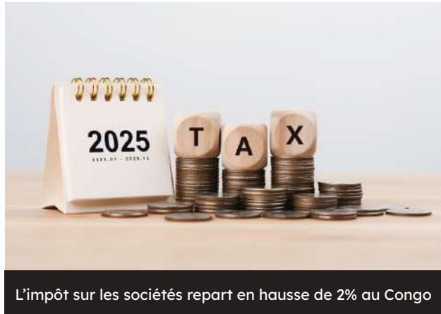
L'impôt sur les sociétés repart en hausse de 2% au Congo

P our l'exercice 2025, le Congo a ramené le taux de perception de l'impôt sur le bénéfice des sociétés (IS) de 28% à 30%. Ce taux, fixé à 38% dans le Code général