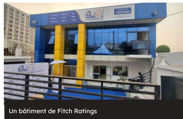
Un bâtiment de Fitch Ratings

Par ailleurs, les arriérés envers les créanciers officiels (Banque mondiale, Banque africaine de développement, etc.) et domestiques ont explosé. Entre janvier et novembre 2024, ces arriérés ont augmenté de 0,9% du PIB pour les créanciers