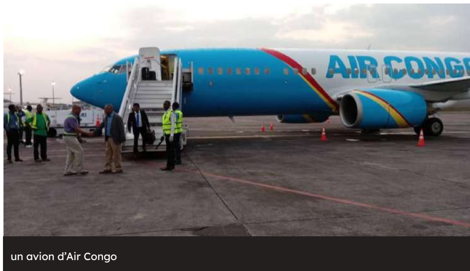
un avion d'Air Congo

Le projet de fusion entre Air Congo et Ecair est entré dans sa phase de négociation. C'est ce qu'annonce le gouvernement congolais lors de la réunion entre les partenaires sociaux et les autorités tenue à Brazzaville le 24 janvier 2025. Cette annonce intervient après le lancement des activités d'Air