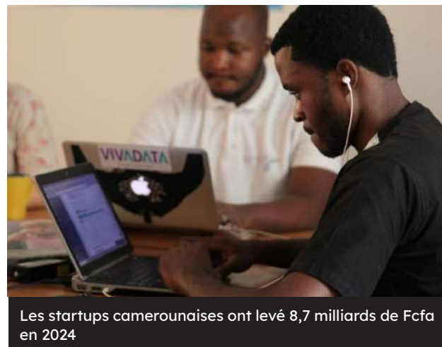
Les startups camerounaises ont levé 8,7 milliards de Fcfa en 2024

La plateforme de données "Partech Africa" a récemment publié son rapport sur la répartition des levées de fonds des start-ups africaines pour le compte de l'année 2024. Selon l'analyse de la plateforme, les investissements dans l'écosystème des start-ups en zone Cemac ont plafonné à 22 millions USD (environ 13,7 milliards de Fcfa), contre 66 millions USD (41,2 milliards de Fcfa) dans l'Uemoa. Ces statistiques indiquent que les start-ups de la région ouest-africaine ont été plus prisées par les investisseurs par rapport à celles d'Afrique centrale, leur permettant de recevoir trois fois plus de capitaux propres et de financements par emprunt. A noter que, la plateforme Partech Africa ne prend en compte que les opérations