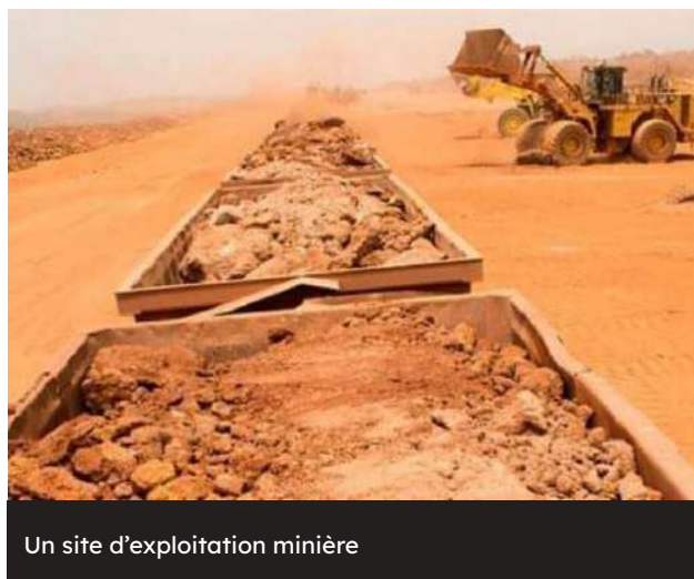
Un site d'exploitation minière

Canyon Resources Limited annonce avoir obtenu un prêt d'environ 124 millions de dollars