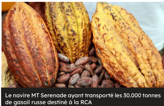
Le navire MT Serenade ayant transporté les 30.000 tonnes de gasoil russe destiné à la RCA

A u Cameroun, le cours du café arabica [variété de café la moins consommée], a bondi de 52% entre décembre 2024 et janvier 2025 selon les don-