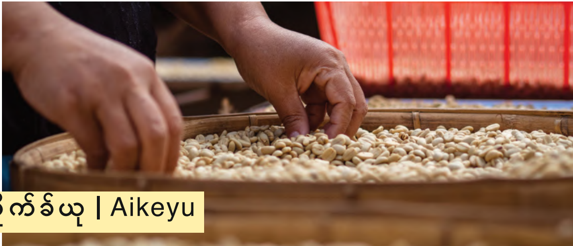
အိုက်ခီယု | Aikeyu

မြန်မာအဆိုမှာ “ခေါင်ထိအကုန်စား” ဆိုတဲ့အတိုင်း သူပြောင်းလဲတဲ့အခါသူ့မိသားစုတွေ၊ တူတွေတူမတွေကို ပါရခဲ့တာဖြစ်တယ်။