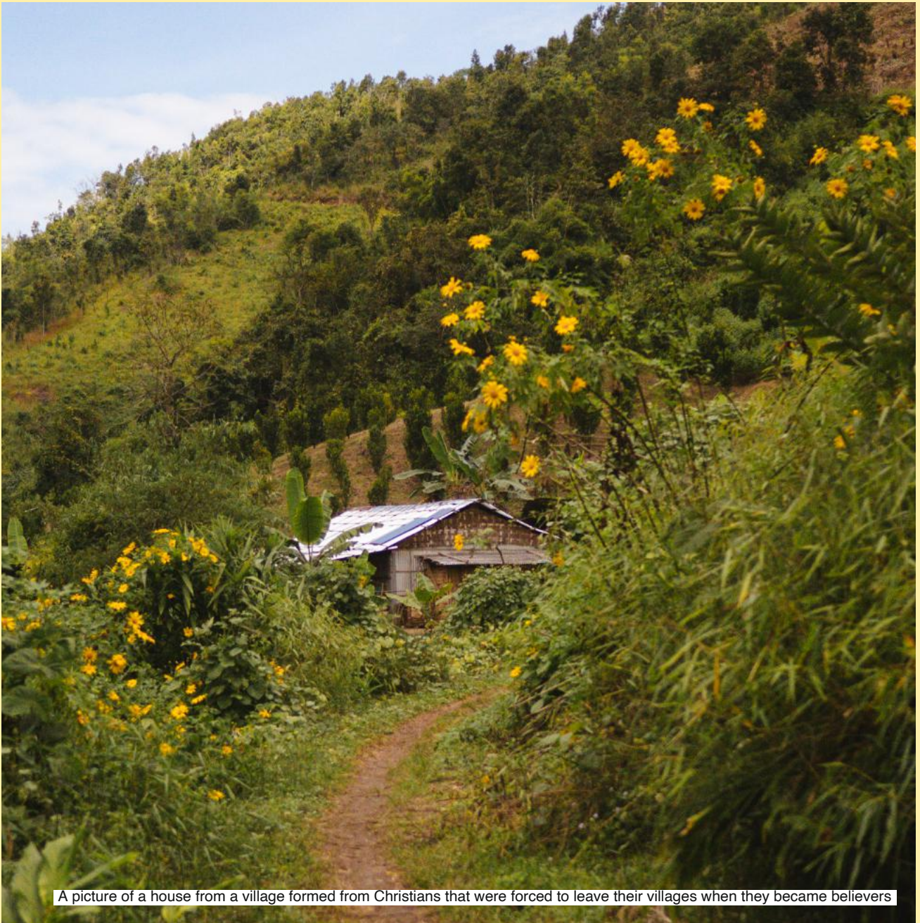
A picture of a house from a village formed from Christians that were forced to leave their villages when they became believers