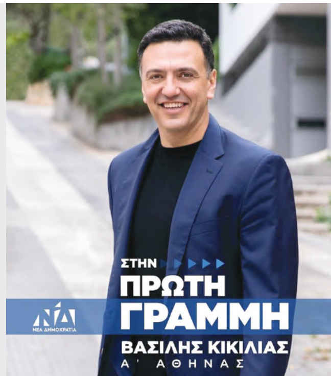
ανθρώπους σε όλη τη χώρα, ημερία και την ανάπτυξη σε ολά τα επίπεδα».

πολιτών από τα βάρη της εισαγόμενης ενεργειακής και πληθωριστικής κρίσης». Ο υπουργός Τουρισμού σημειώνει ότι «η φετινή σεζόν ξεκίνησε από τις αρχές Μαρτίου, γεγονός που καταδεικνύει ότι ο στόχος μας για επιμήκυνση της τουριστικής περιόδου έχει επιτευχθεί και, πλέον, ο στόχος μας -ο οποίος υλοποιείται μέσα από σειρά δράσεων του ΕΟΤ και του υπουργείου- είναι η 12μηνη τουριστική περίοδος, όχι μόνο για τους προορισμούς με ισχυρό brand, αλλά και για εναλλακτικές επιλογές για ταξιδιώτες και τουρίστες». Υπογραμμίζει, επίσης, ότι «ο τουρισμός είναι μια κατεξοχήν έκφραση της λαϊκής οικονομίας, καθώς ενισχύει μικρές και μεσαίες επιχειρήσεις, οικογενειακές επιχειρήσεις, το τοπικό εμπόριο και δίνει δουλειά σε χιλιάδες