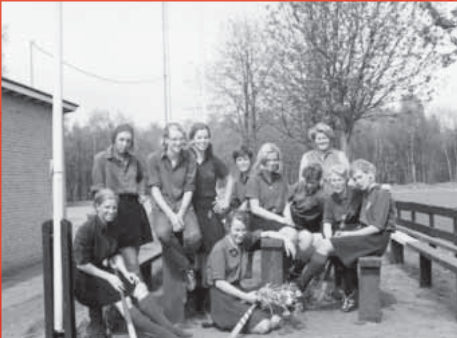
Dankzij het halfhard veld naast het clubhuis met drie lichtmasten behaalt Dames II het kampioenschap.