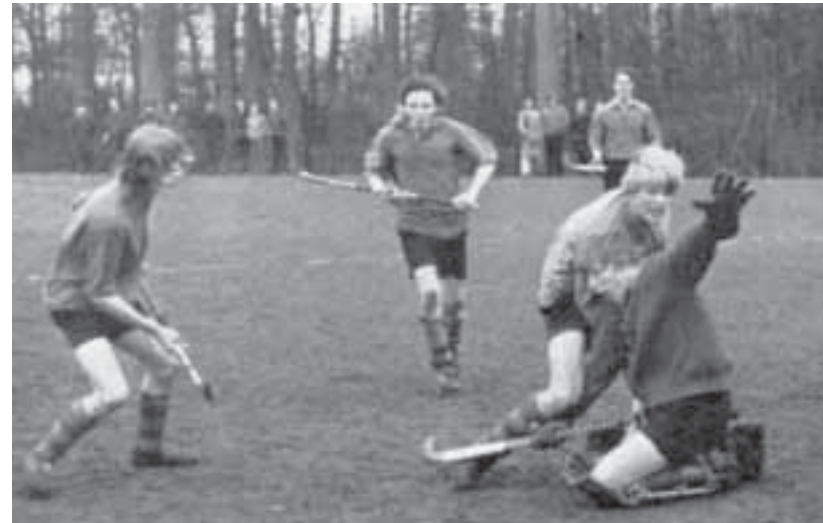
Jongens A wint in 1971 met overmacht het landskampioenschap tegen Laren.