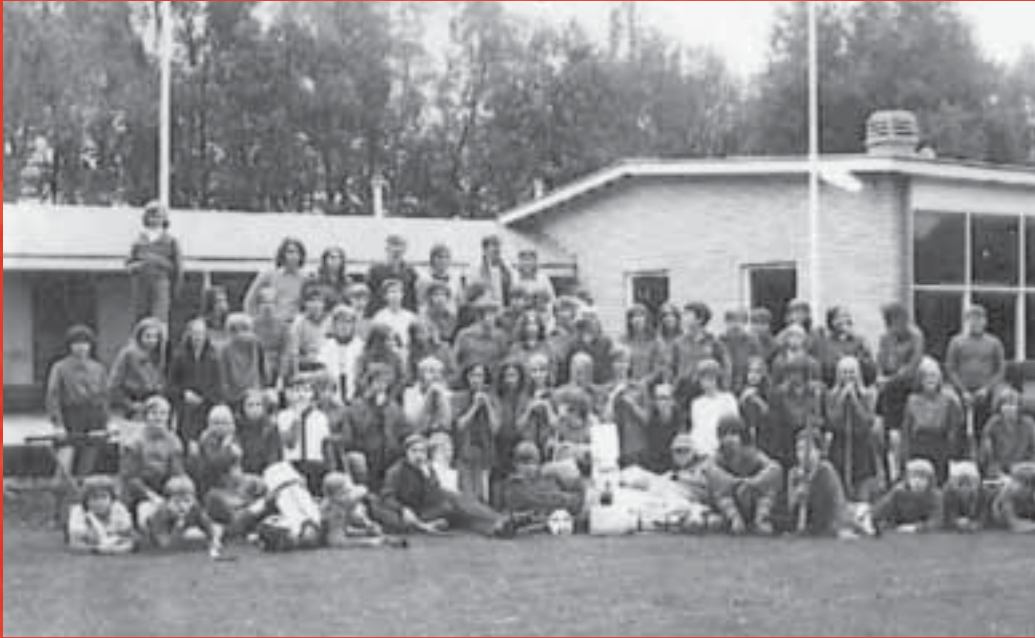
Serius hockeyen en feesten op het Jeugdhockeykamp. Een nieuwe trend op SCHC.