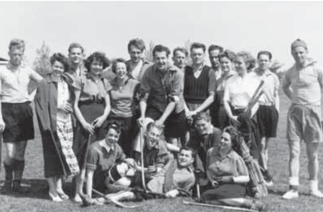
Middelburg behoort sinds mensenheugenis tot de leukste mixedtournaments.