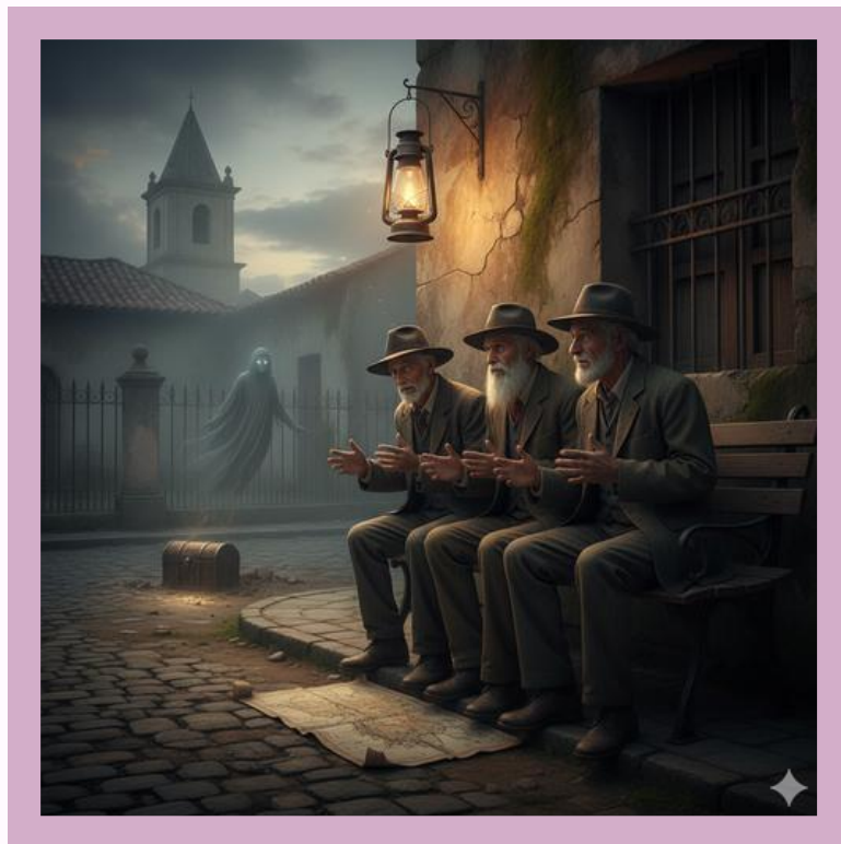
Imagen creada con IA

Significado patrimonial: Muestra la tradición oral como transmisora de creencias, mitos y saberes populares del pueblo chileno.