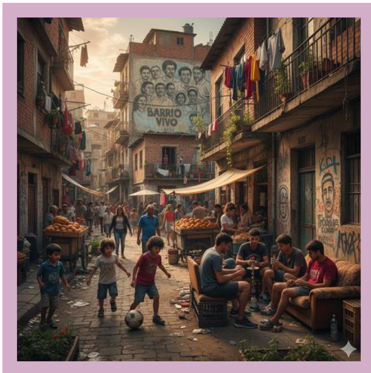
Imagen creada con IA

Significado patrimonial: Representa una memoria social viva del barrio popular, donde se mezclaban marginalidad, vecindad y costumbres cotidianas.