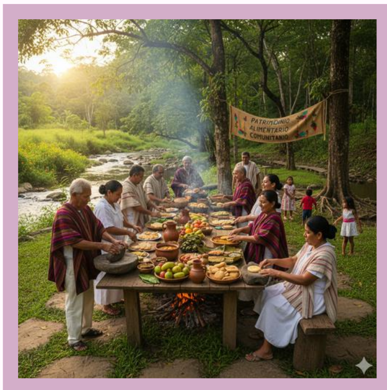
Imagen creada con IA

Significado patrimonial: Describe una práctica comunitaria y familiar, ligada a la alimentación típica y al uso de espacios naturales, como parte del patrimonio inmaterial.