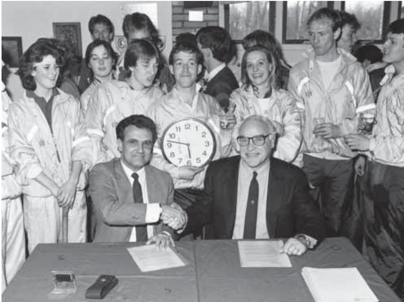
Ondertekening sponsor- contract Data Process.