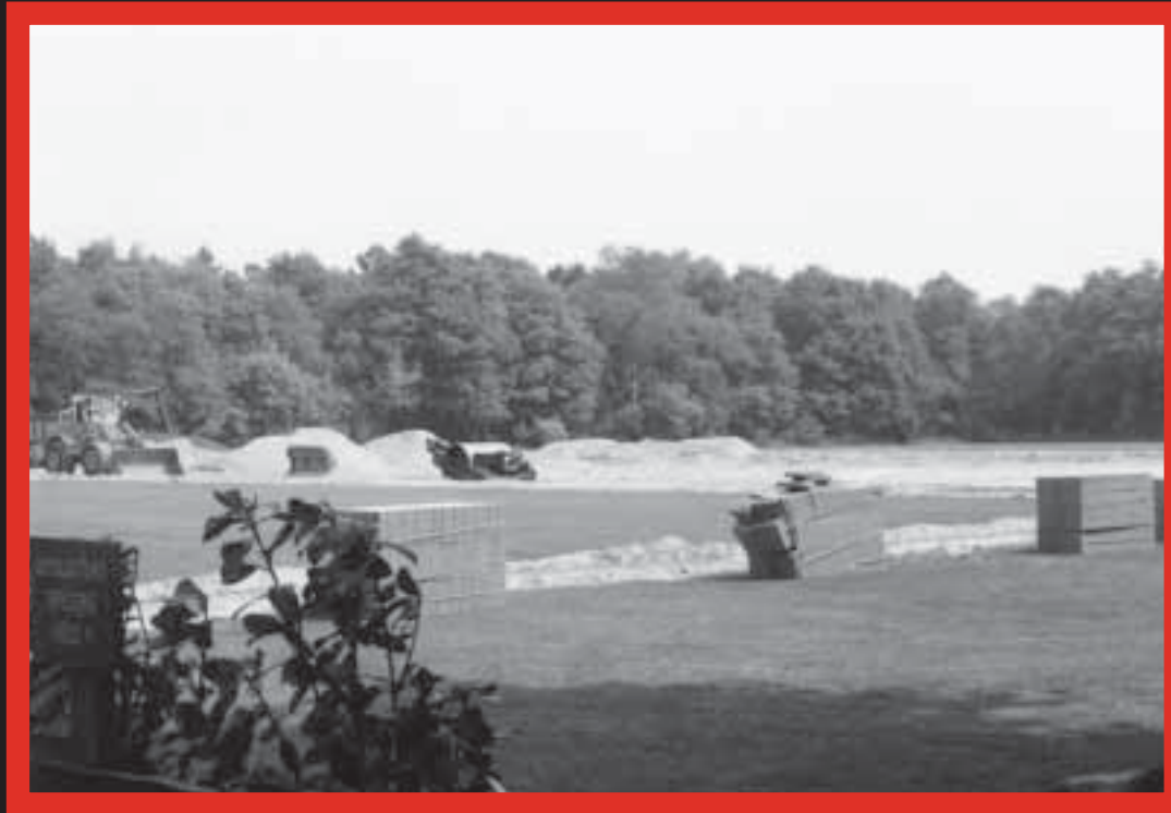
Kunstgras in wording.