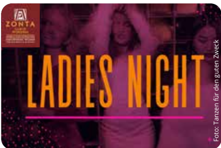
Foto: Tanzen für den guten Zweck

Das Kulturhaus Osterfeld öffnet seine Türen für die vierte Ladies Night! In gemütlicher Clubatmosphäre wird zu den Beats der 90er und 2000er Jahren getanzt und das Kulturhaus zum Wackeln gebracht. Veranstaltet vom Zonta Club Pforzheim und dem Kulturhaus Osterfeld, kommt der Erlös Frauen und Mädchen in Pforzheim zugute.