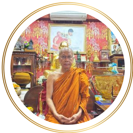
泰国洛坤府塔诺寺住持 他翁·比叙·隆萨·他哇罗大师