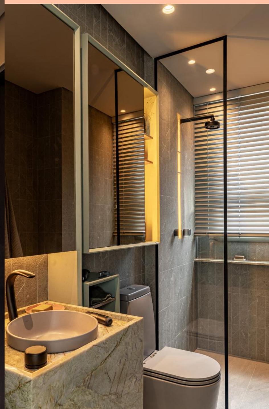
Produto: Persiana Faux