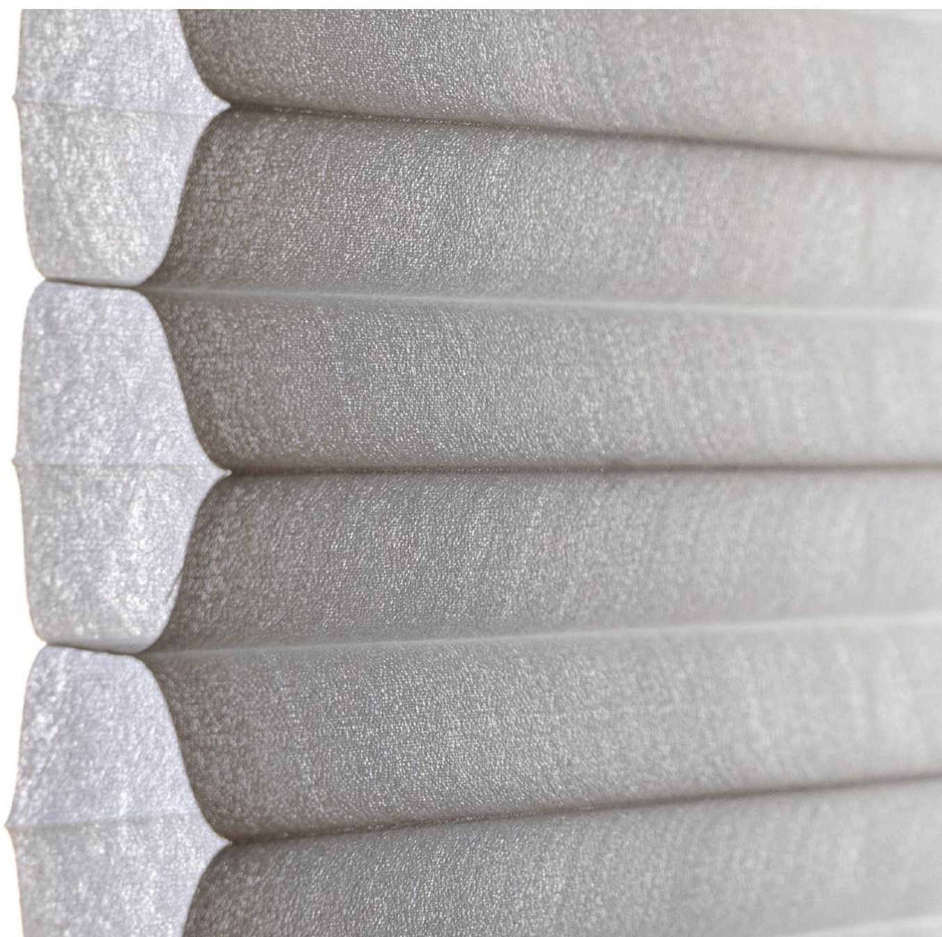
Casa Vogue Experience | Execução: Uniflex Gabriel | Foto: Fred Fernandes Produto: Cortina Cortina Senses Collection e Cortina Celular