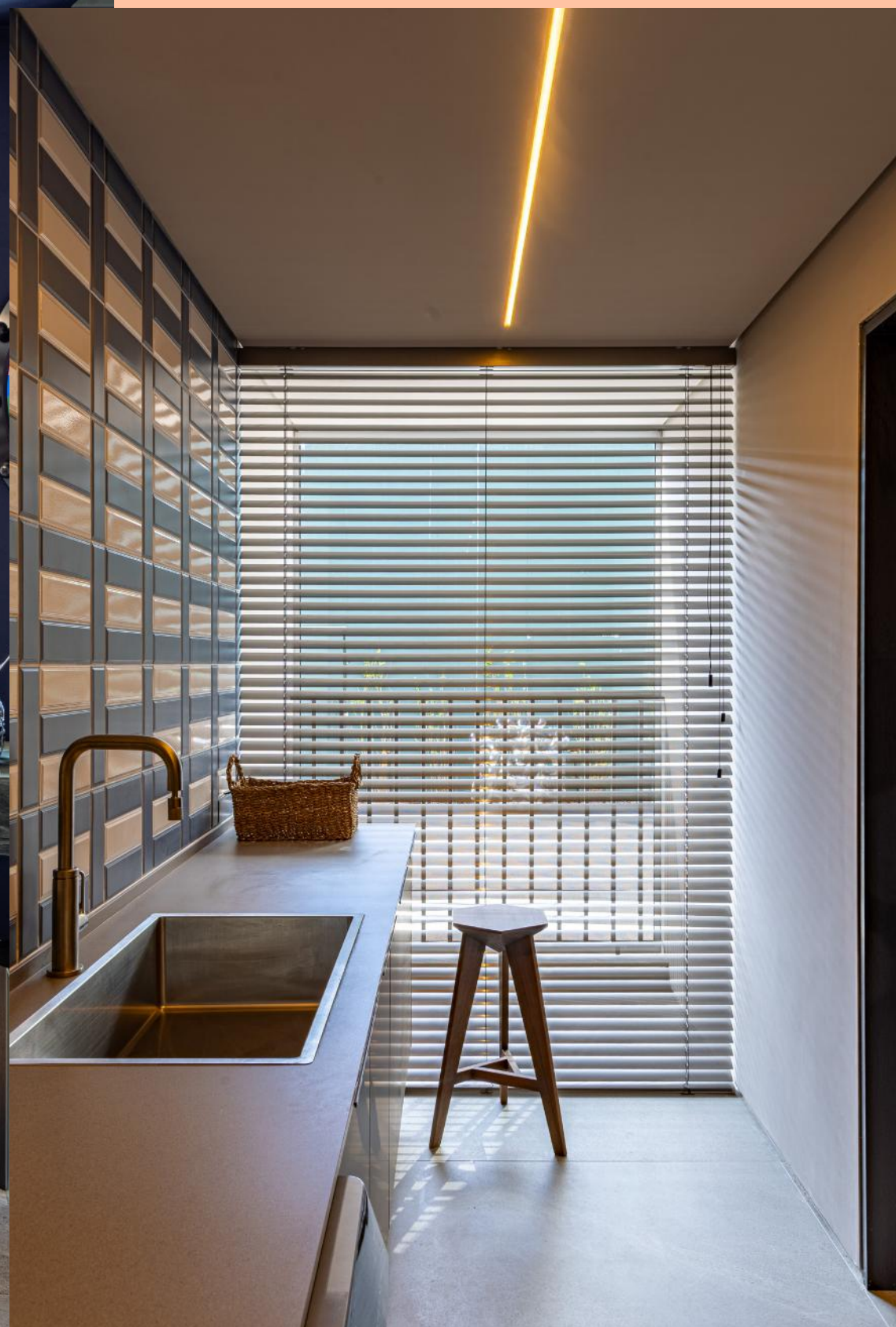
Produto: Persiana de Alumínio