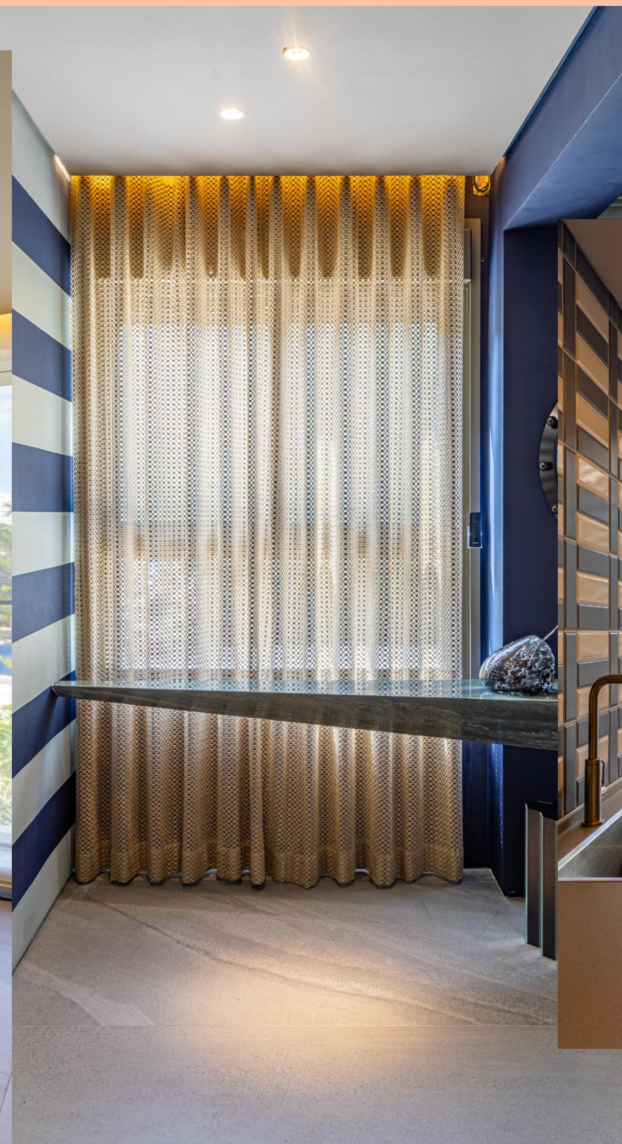
Produto: Cortina Lashings