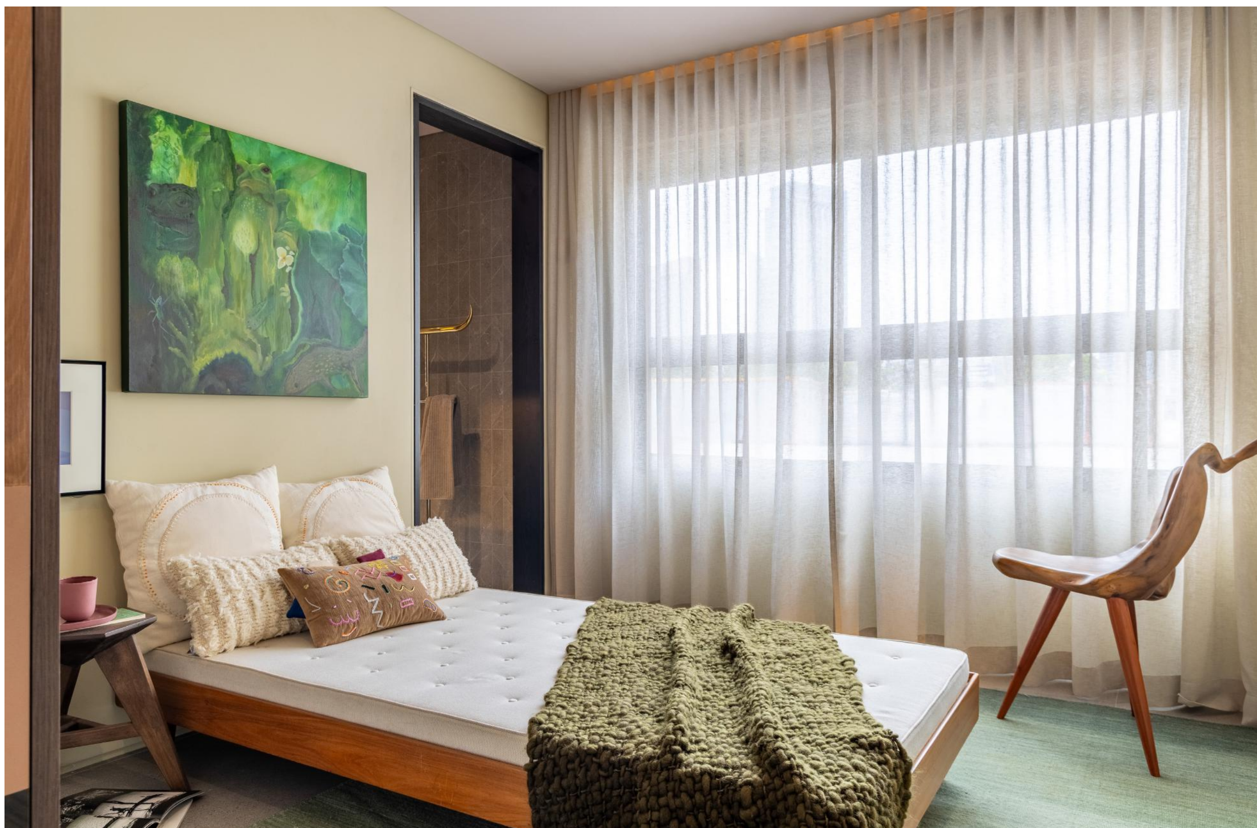
Casa Vogue Experience | Execução: Uniflex Gabriel | Foto: Fred Fernandes Produto: Cortina Cortina Senses Collection