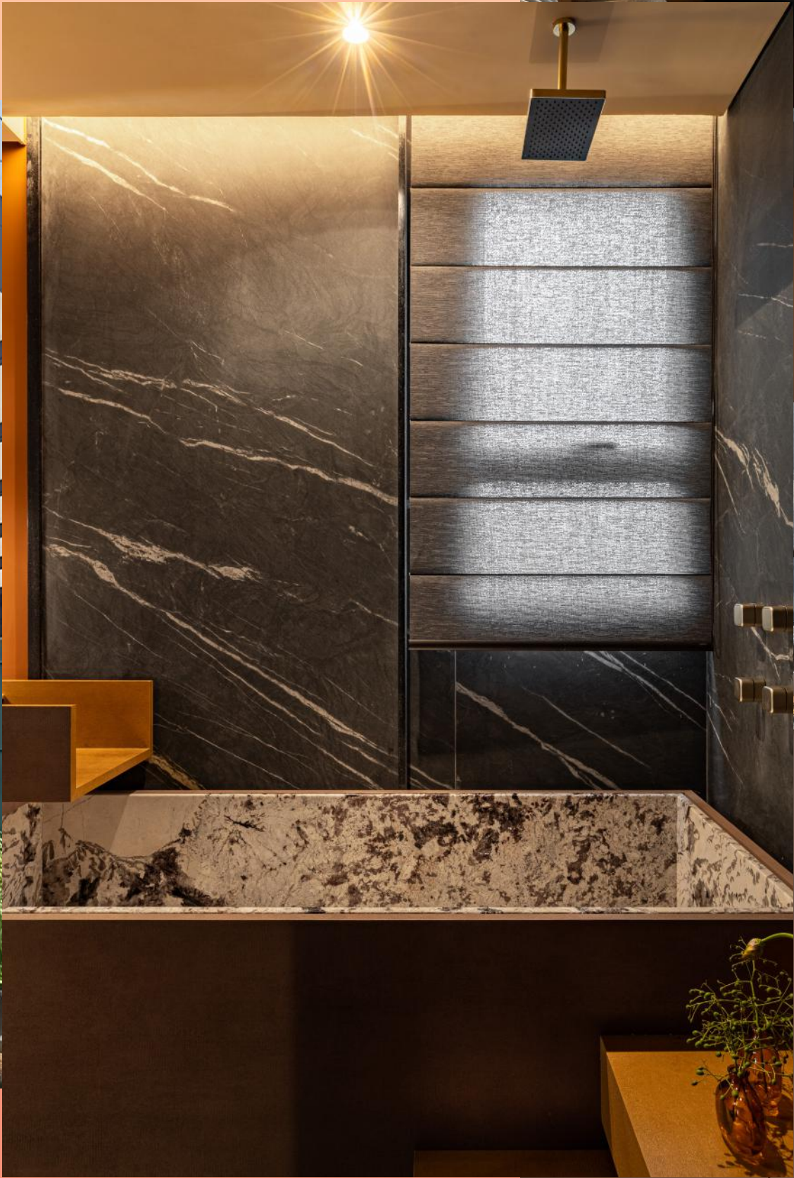
Produto: Cortina Romana