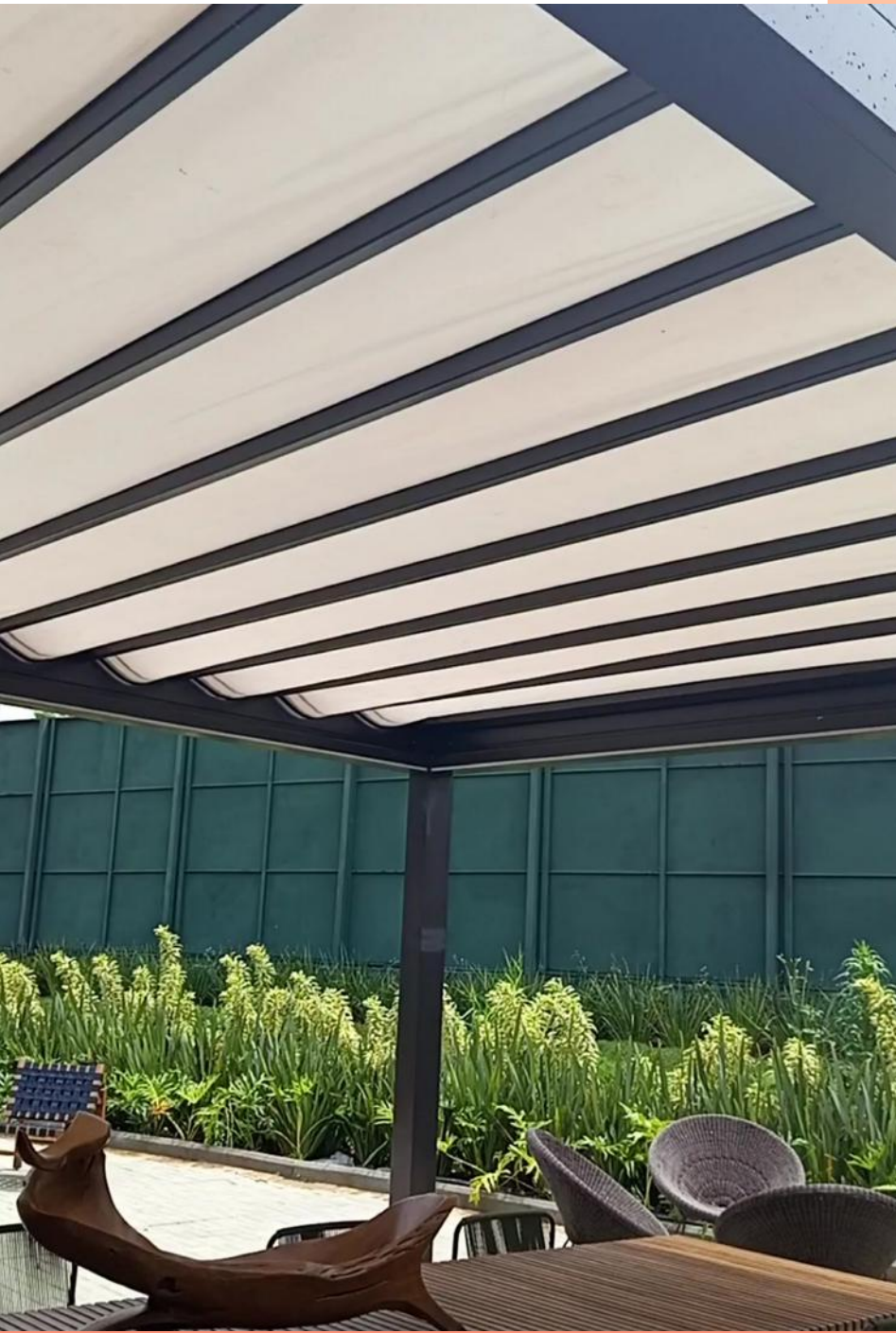
Produto: Toldo Isla