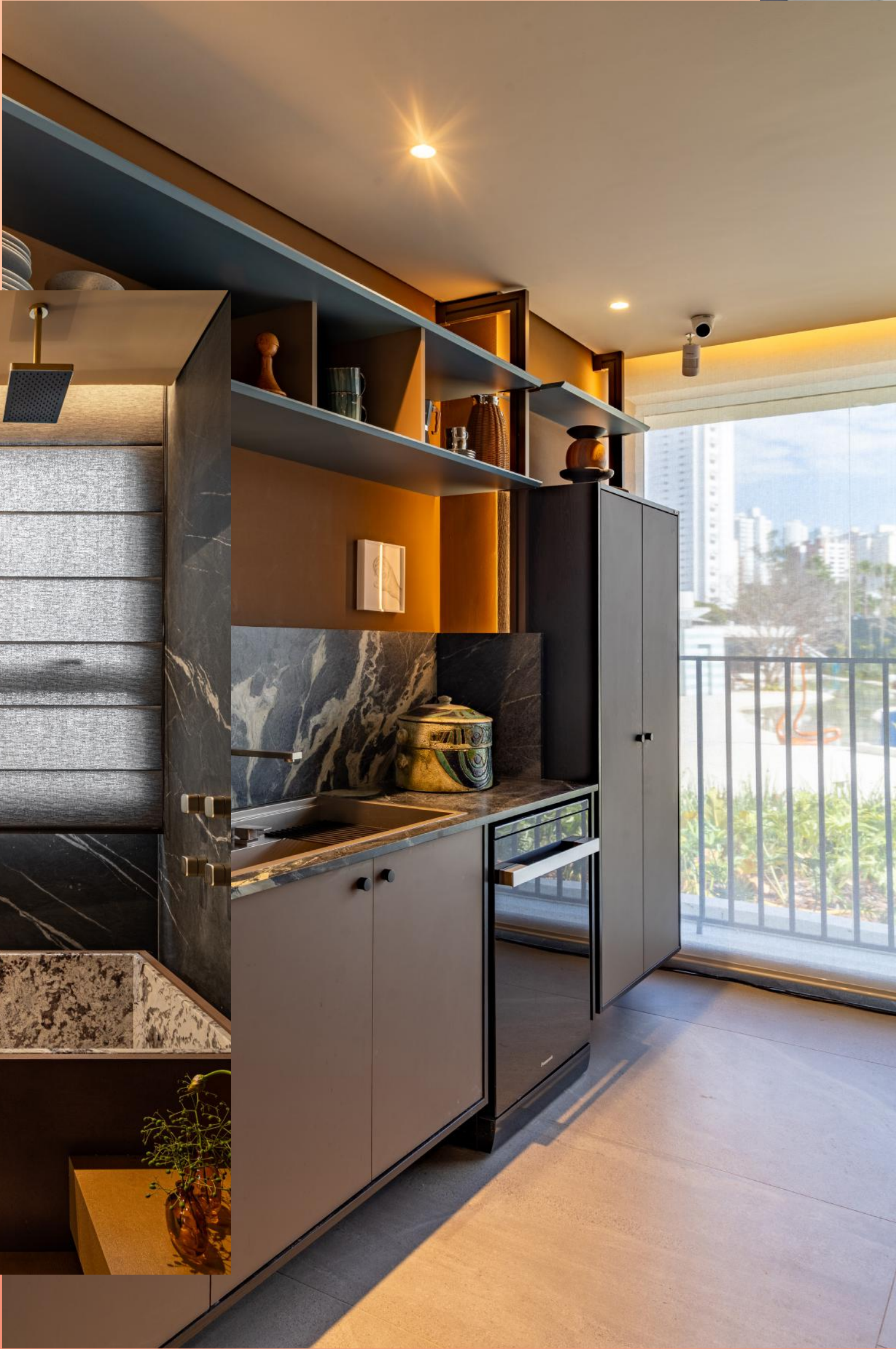
Produto: Cortina Rolô Balcony