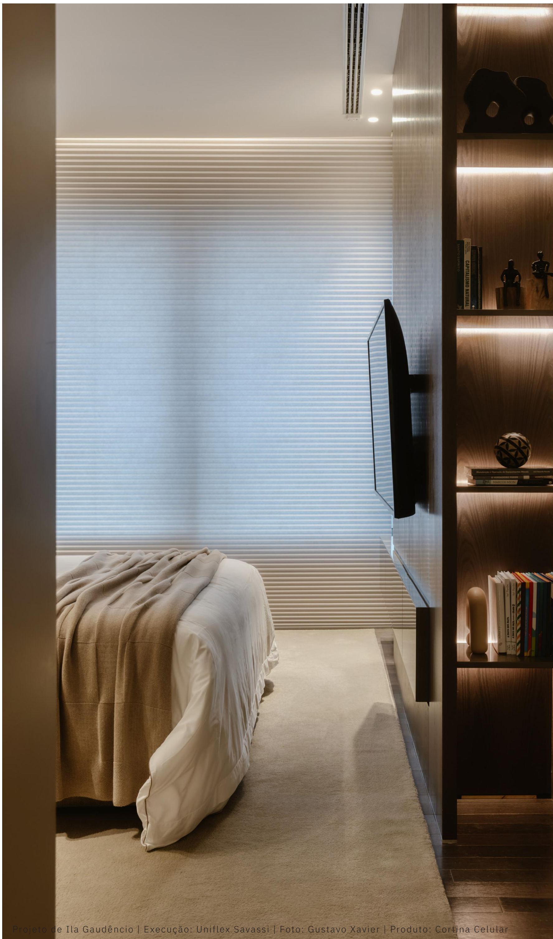
Projeto de Ila Gaudêncio | Execução: Uniflex Savassi | Produto: Cortina Celular