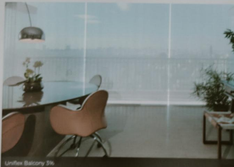
Uniflex Balcony 3%

ВНЕШНЕ-ЭКОНОМИЧЕСКОЕ СОТРУДНИЧЕСТВО И КОММЕРЦИАЛИЗАЦИЯ НАУКИ