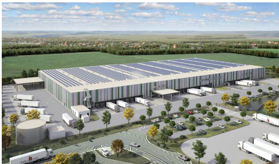
V současné době se v Hodenhagenu u Hannoveru staví víceúčelový logistický objekt včetně mezaninu (vizualizace).

Pro distribuci značky Bosch Thermotechnik Buderus převezmeme od roku 2023 správu regionálního distribučního centra. V současné době se v Hodenhagenu nedaleko Hannoveru staví multi-user sklad.