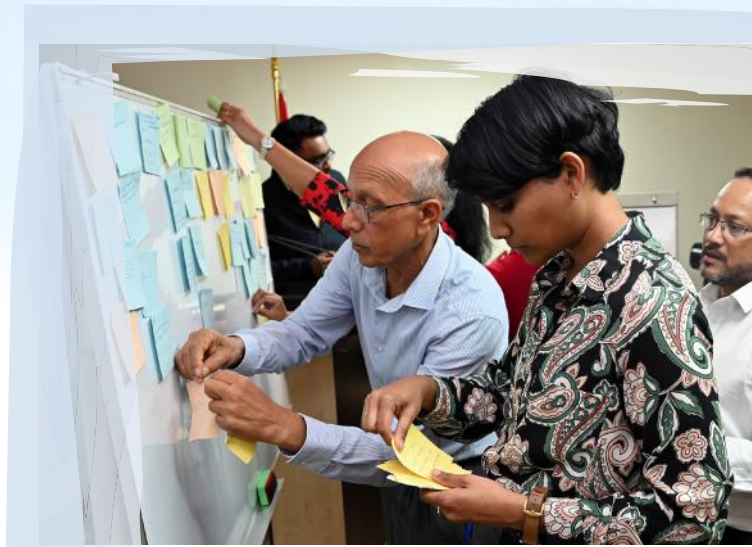
Board Directors participating in a brainstorming session with staff

The new Board of the National Empowerment Foundation believes that unless there is strong, sustained intervention with the involvement and commitment of different public institutions, NGOs, the private sector and above all, the beneficiaries themselves, NEF's vision of eliminating extreme and chronic poverty will remain