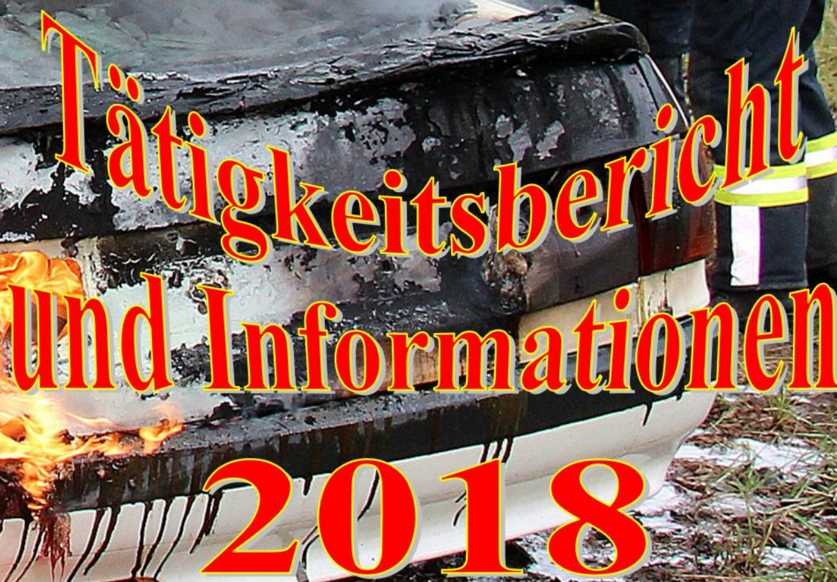
Foto: Übung Brandeinsatz, KFZ Brand in Tinsting