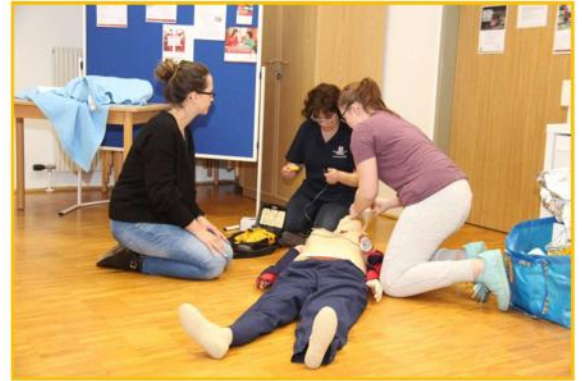
Bild oben: 16 stündiger Erste Hilfe Kurs