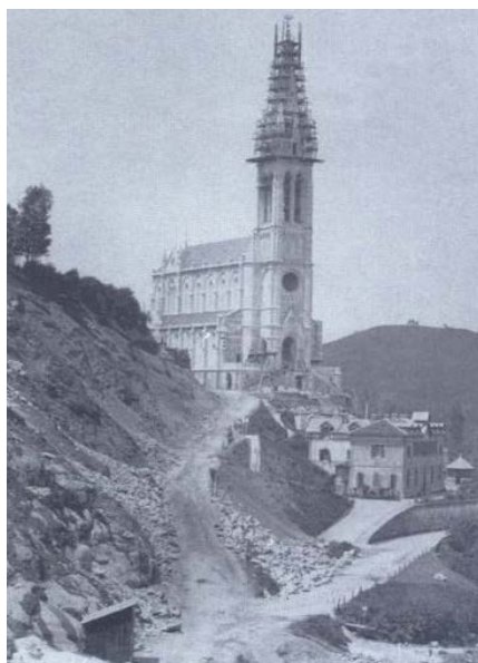
Construction de la Basilique supérieure (photo prise en 1870)