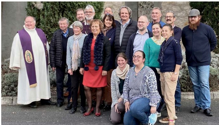
Une partie du Comité.