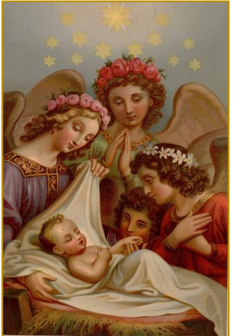
hwala Bogu na wysokości, a na ziemi pokój ludziom dobrej woli.