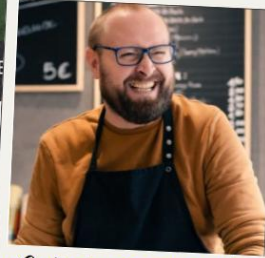
Soutien à nos commerçants et dynamisation centre-ville

Promotion de la lutte contre le harcèlement dans toutes nos écoles