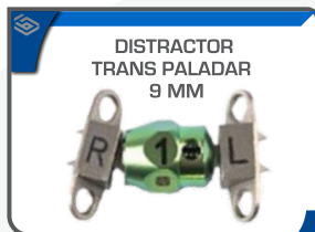
PA.01.05.0001 CERRADO 17 mm ABIERTO 26 mm