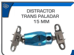
PA.01.05.0002 CERRADO 20 mm ABIERTO 35 mm