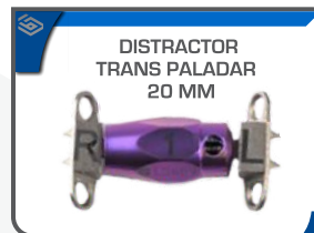
PA.01.05.0003 CERRADO 23 mm ABIERTO 43 mm