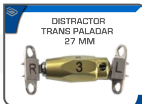
PA.01.05.0004 CERRADO 26 mm ABIERTO 53 mm