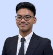
RAZIN ZUHRI BIN RAMLI EXCO PERHUBUNGAN LUAR