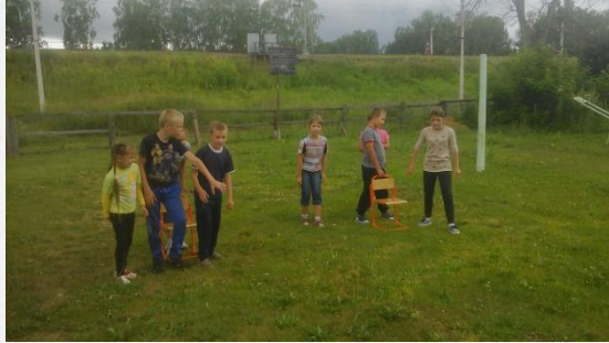
Игровая программа «Солнце, воздух, ДПС!»