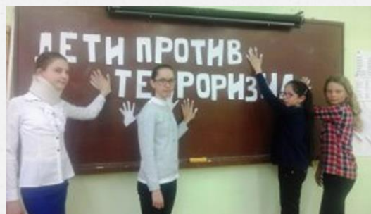
Тематический час «Как не стать жертвой преступления»