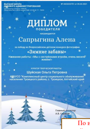
По итогам Всероссийского онлайн-конкурса «Зимние забавы» 2 участника ДПС «Право на будущее» удостоены Диплома победителя