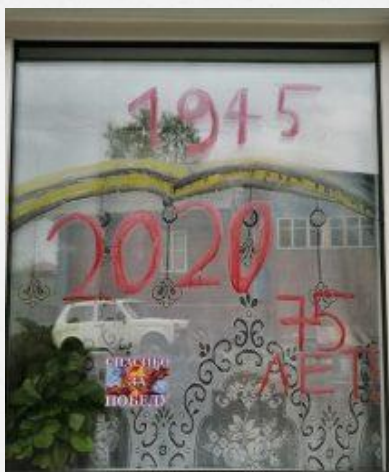
Всероссийская онлайн-акция #Окна Победы