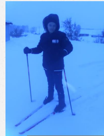
Онлайн- акция #ЗимаЗОЖ