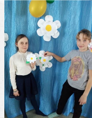
Акция «Белая ромашка» посвященная Международному дню борьбы с туберкулезом