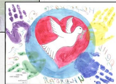
Краевой конкурс рисунков «Живые страницы истории», посвященный Дню народного единства