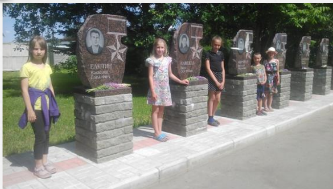
Тематическое мероприятие, посвященное Дню памяти и скорби