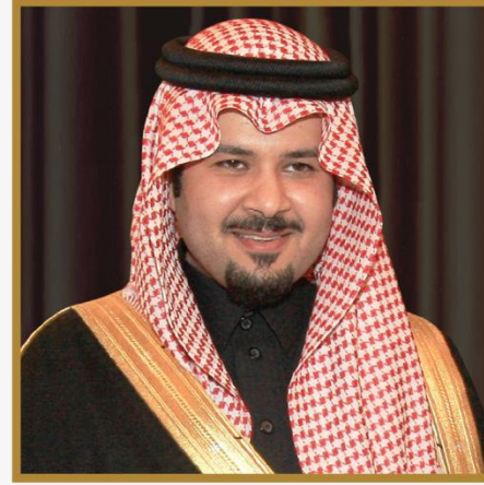
الأمير سلمان بن سلطان بن عبدالعزيز أمير منطقة المدينة المنورة