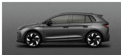
Metallizzato Grigio Graphite