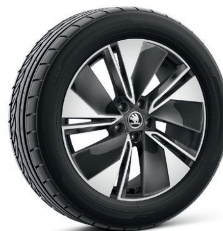
Cerchi in lega leggera 8J x 19" «Regulus», antracite lucido

I prezzi si intendono in franchi svizzeri incl. IVA dell'7.7%. Alcuni degli equipaggiamenti supplementari riportati in alto possono essere ordinati solo in abbinamento con altri equipaggiamento supplementari. Inoltre, non tutti gli equipaggiamenti supplementari elencati sono combinabili tra loro. Per informazioni particolareggiate la preghiamo di rivolgersi al suo partner Škoda.