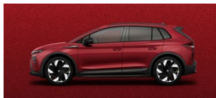
Metallizzato speciale Rosso Velvet