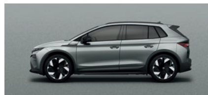
Metallizzato Argento Smokey Diamond