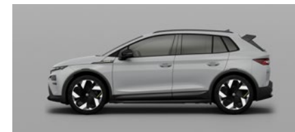
Unita Grigio Acciaio