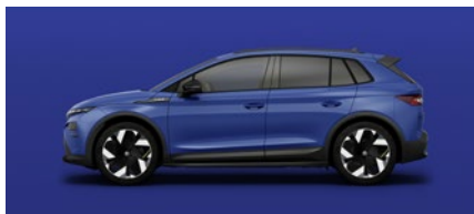
Unita Blu Energy