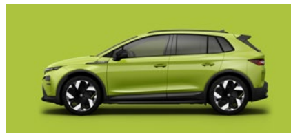
Unita Verde Mamba