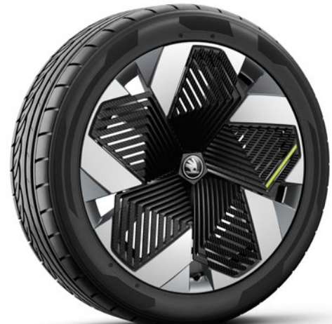
Cerchi in lega leggera 8,5J x 21" & 9J x 21" «Vision», antracite lucido, con panne. Aero nero