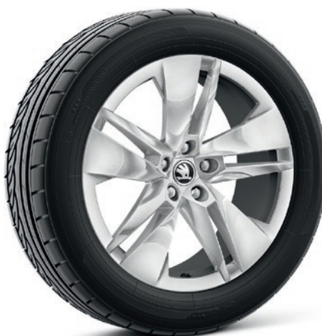
Cerchi in lega leggera 8J x 19" «Proteus», argento laccato