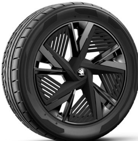
Cerchi in lega leggera 8J x 20" & 9J x 20" «Draconis», nero, con panne. Aero nero-opaco