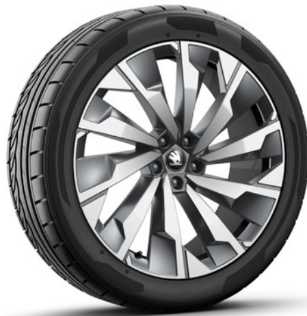
Cerchi in lega leggera 8,5J x 21" & 9J x 21" «Supernova», nero lucido