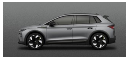
Colore matt Grigio Graphite

I prezzi si intendono in franchi svizzeri incl. IVA dell'7.7%. Alcuni degli equipaggiamenti supplementari riportati in alto possono essere ordinati solo in abbinamento con altri equipaggiamento supplementari. Inoltre, non tutti gli equipaggiamenti supplementari elencati sono combinabili tra loro. Per informazioni particolareggiate la preghiamo di rivolgersi al suo partner Škoda. I colori raffigurati possono differire dai colori effettivi della vernice in funzione della sua qualità.