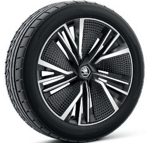
Cerchi in lega leggera 8J x 20" & 9J x 20" «Neptune», antracite, con panne. Aero nero