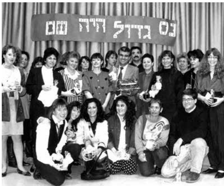
Oben: Das Lehrerkollegium 1990 mit dem zweiten Schuldirektor Dr. J. Levy, Rechts: Grundsteinlegung des neuen Schulgebäudes 1992 mit Jerzy Kanal, die feierliche Eröffnung mit den damaligen Bundespräsidenten Roman Herzog und Regierenden Bürgermeister Eberhard Diepgen im Jahr 1995

Ein Rückblick auf 40 Jahre Heinz-Galinski-Grundschule – Sommerfest zum Jubiläum am 5. Juli