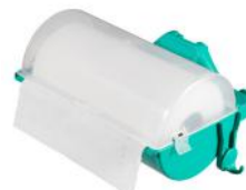
Art. nr. 270685 Gesloten dispenser voor doeken op rol