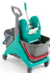
Art. nr. 270610 Trolley Turijn met dweilmop-pers