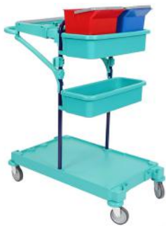
Art. nr. 260500 Materiaalwagen Rome 0

Alle CALU TTS Rome materiaalwagens zijn naar wens aan te passen met extra componenten en accessoires.