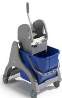
Art. nr. 270609 Verona enkele dweilemmer met pers