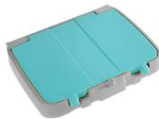
Art. nr. 270813 Dubbel deksel voor 120ltr zakhouder