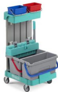
Art. nr. 260570 Materiaalwagen Milaan mini 300B7

Alle CALU TTS Milaan materiaalwagens zijn naar wens aan te passen met extra componenten en accessoires.