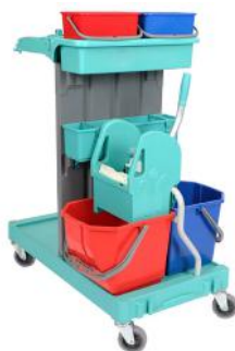
Art. nr. 260550 Materiaalwagen Milaan 490B