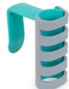
Art. nr. 270705 Steelhouder universeel