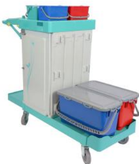
Art. nr. 260505 Materiaalwagen Milaan 810S