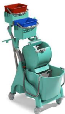
Art. nr. 260560 Materiaalwagen Verona