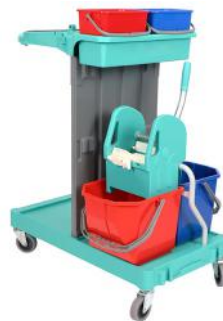
Art. nr. 260600 Materiaalwagen Milaan 120B