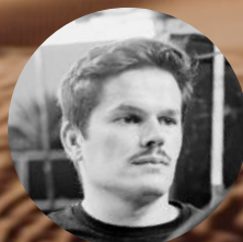
Geoffrey Organisation / Logistique