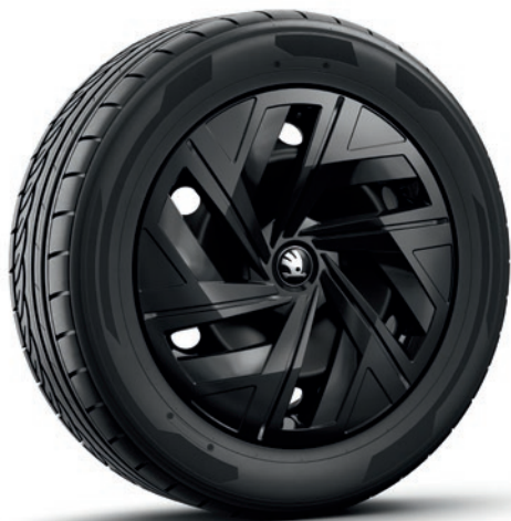
19" Jantes en acier pour 60