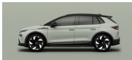
Vert Timiano uni