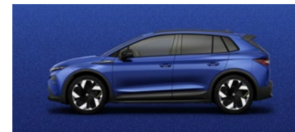
Métallisée Bleu Race