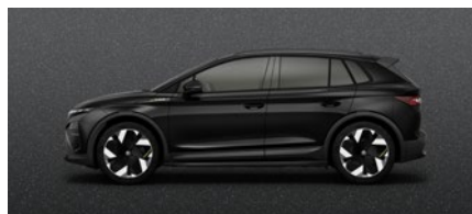
Effet perlé Noir Magic