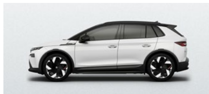
Métallisée Blanc Moon