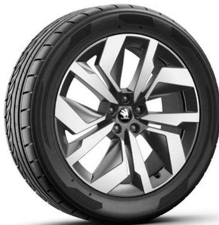
Jantes en alliage léger 8J x 20" & 9J x 20" «Vega», noir con superficie lucidata