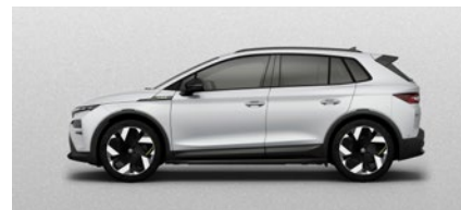
Métallisée Argent Brillant