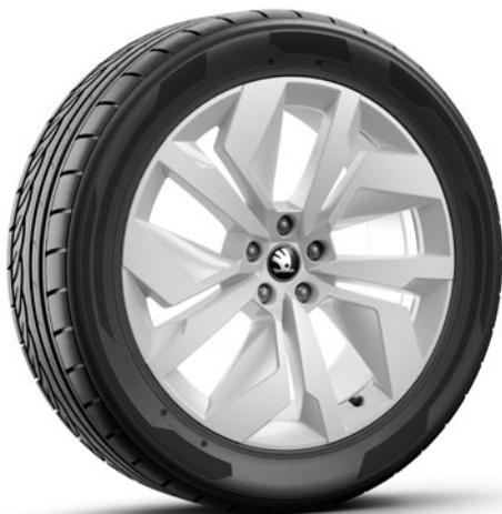
Jantes en alliage 8J x 20" & 9J x 20" «Vega», argent métallisé, peintes