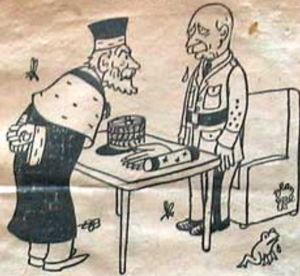
- Z'appellez ça une conscience nickel ?