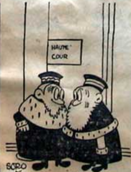
— Vous voulez savoir ce que c'est ce Laval ?... Eh bien, c'est un malpoli !

Peut-on, en effet, parler de débats alors qu'il n'y avait plus qu'une suite d'interpellations de plus en plus véhémentes entre un accusé de mauvaise foi et un président trop nerveux pour rester dans son rôle, accusé et président à qui les jurés, sortant eux aussi d'une élémentaire réserve, coupèrent alternativement la parole pour, finalement, se répandre en injures et même en menaces à l'égard de Pierre Laval, le tout au milieu d'une réunion publique, et du plus mauvais aloi.