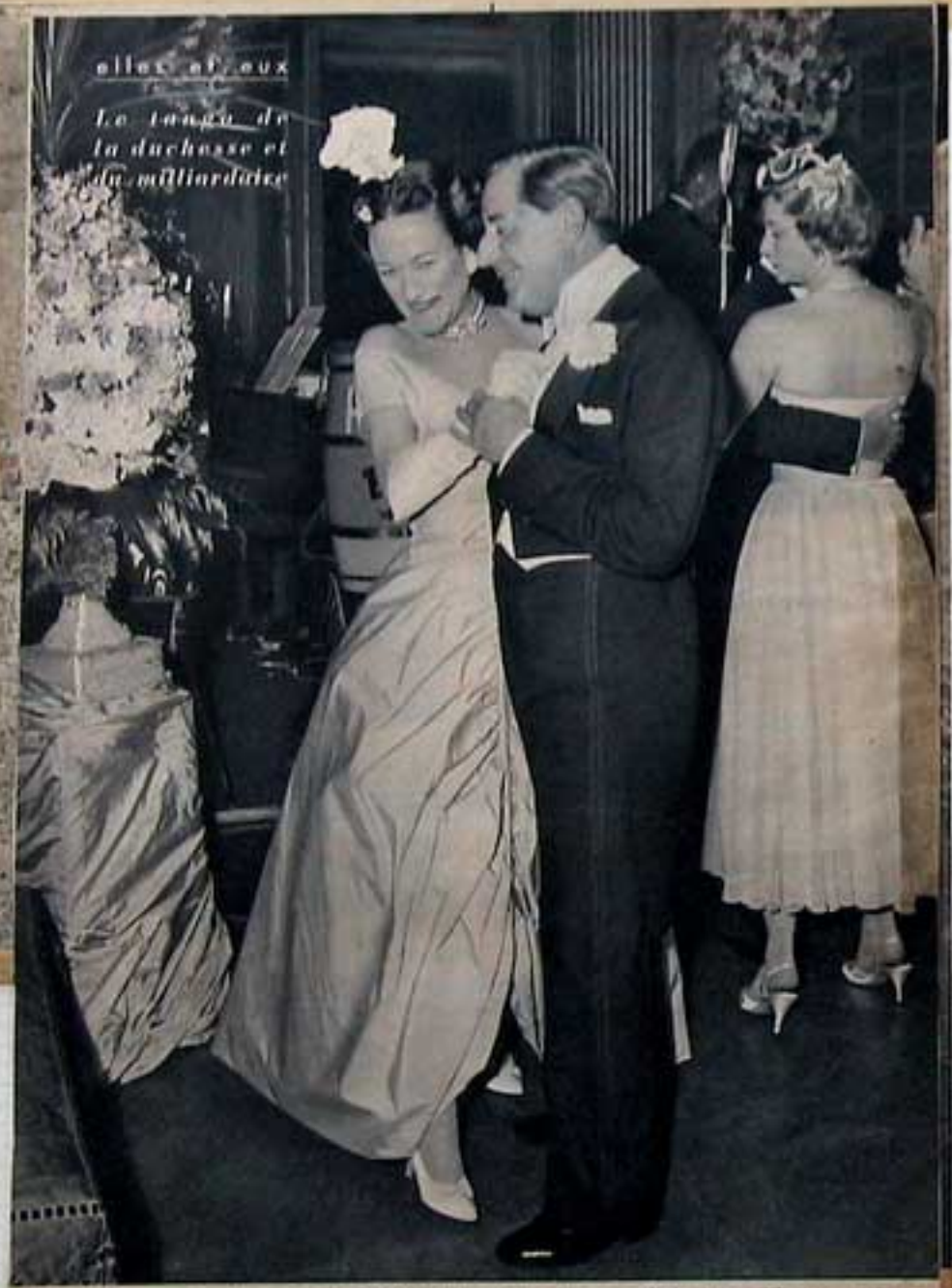
elles et eux Le tango de la duchesse et du milliardaire