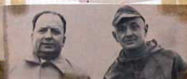
La bataille des freins est en grande partie gagnée

« La bataille des freins est en grande partie gagnée... »