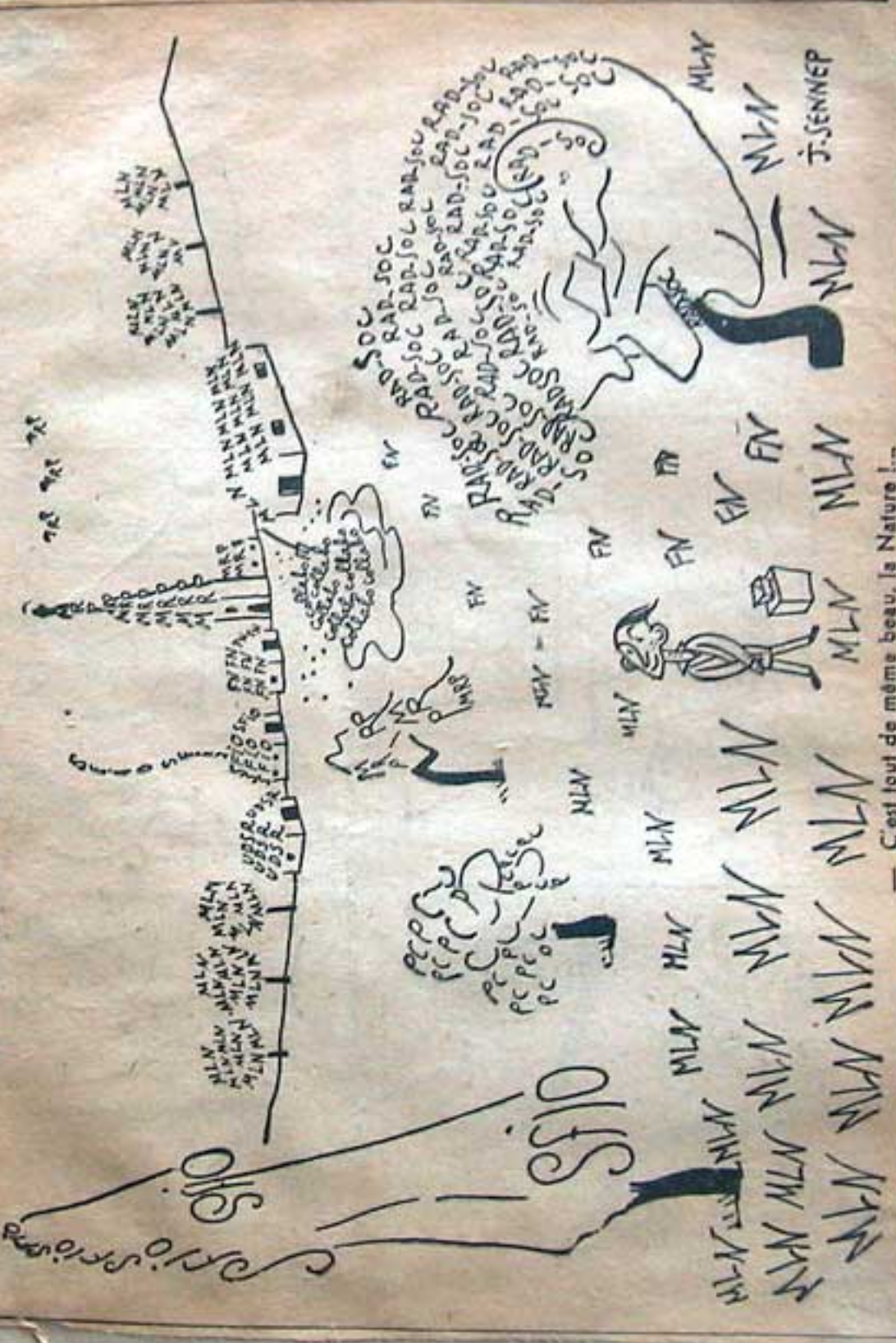
— C'est tout de même beau, la Nature !...