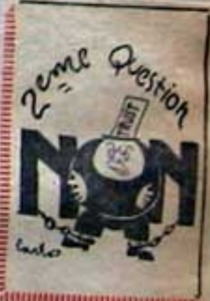
manchette du journal communiste "La Défense" (Spitzer)