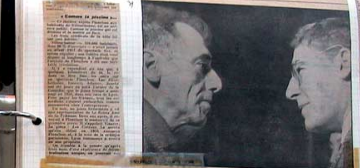
Portrait of a man, likely a political figure, looking to the right.

Le Cercle de Craie Caucasien est une association qui a pour but de promouvoir la culture caucasienne en France. Elle organise des ateliers, des conférences, des expositions, etc. Cette association a été créée par un groupe d'amateurs de la culture caucasienne. Elle a pour objectif de faire connaître et aimer cette culture riche et diverse. Elle organise des ateliers de danse, de musique, de cuisine, etc. Elle organise également des conférences et des expositions sur la culture caucasienne. Il est important de soutenir cette association et de participer à ses activités. La culture caucasienne est un patrimoine précieux et il est de notre responsabilité de le protéger et de le transmettre.