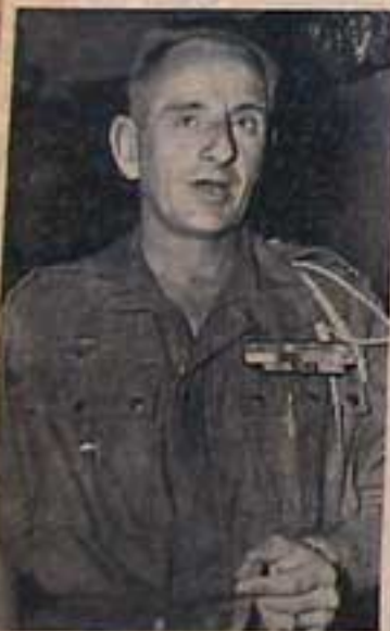
Le général BUGEARD.

afin de former les officiers aux méthodes de la "guerre subversive"