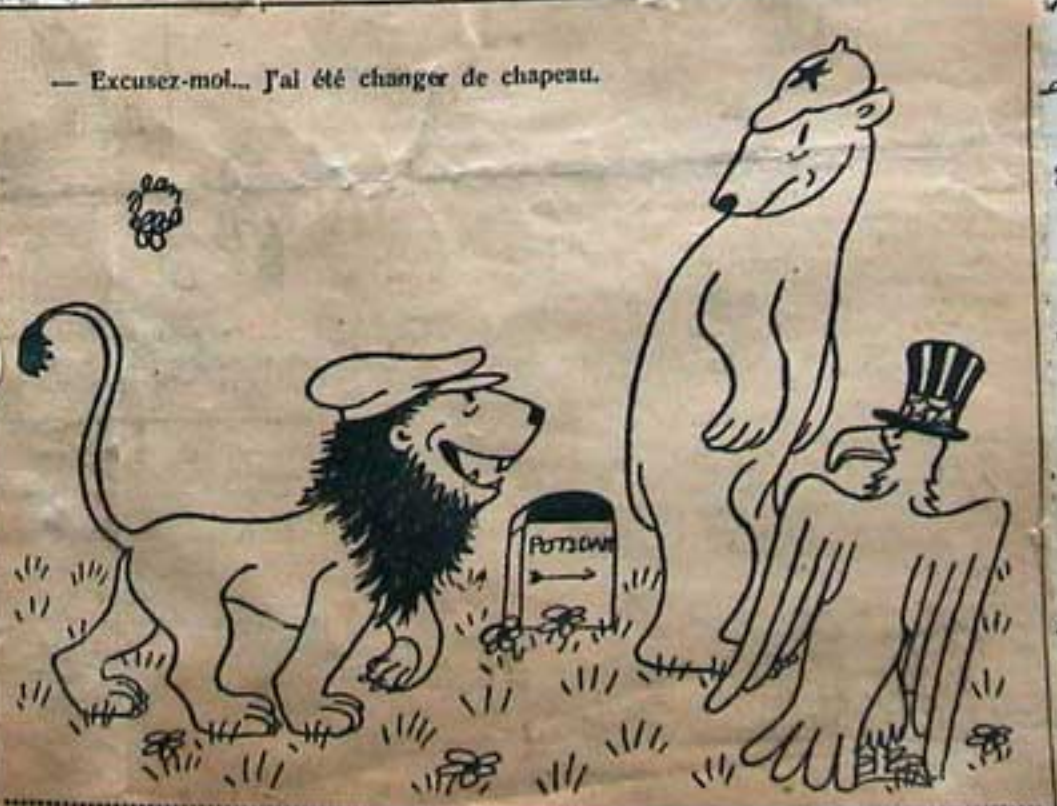
Excusez-moi... j'ai été changer de chapeau.

les Japonais viennent de capituler. Le parti travailliste a séjourné au pouvoir en Angleterre.