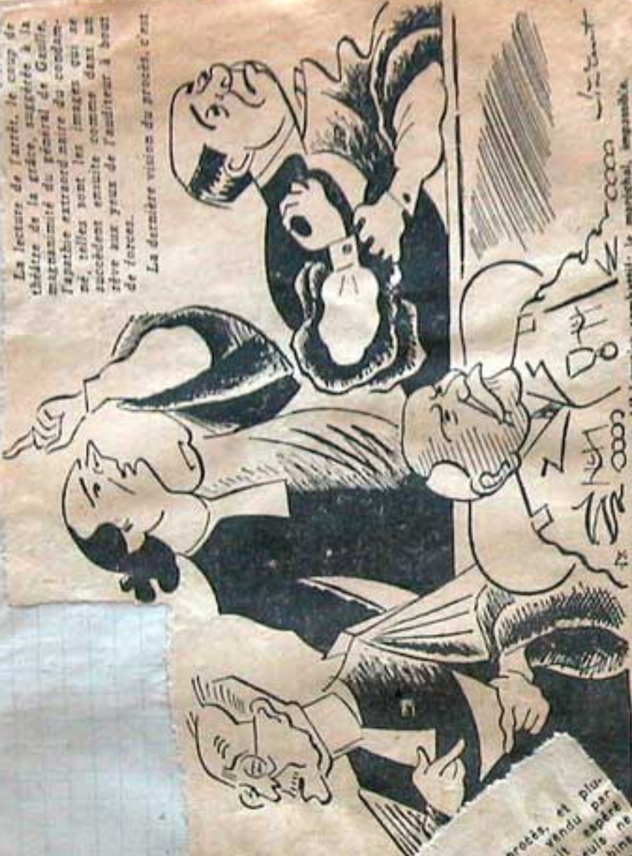
La lecture de l'arrêt, le copy de théâtre de la grâce, suggérée à la magistrature du général de Gaulle. L'aparté extraordinaire du condamné, telles sont les images qui se succèdent ensuite comme dans un rêve aux yeux de l'auditeur à bout de forces. La dernière vision du procès, c'est

Raté Par Ag fambox ce procès, et plus tôt raté. Le pays, vendu par autre chose: les jurés seuls ne font pas d'écrou. Mais les robes n'ont pas de décadence d'une institution ne s'est attirée avec une évidence avouante. Jamais procès politique, car il s'agit, au sens plein du mot, de politique: celui d'une instruction absente, d'une accusation contradictoire et inférieure à sa tâche, de débats allant à vau-l'eau, au gré des témoins et au hasard des comparutions.