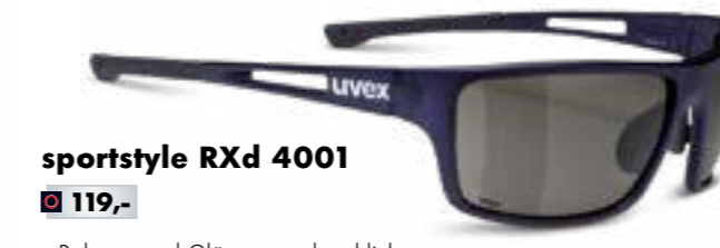
sportstyle RXd 4001 € 119,-