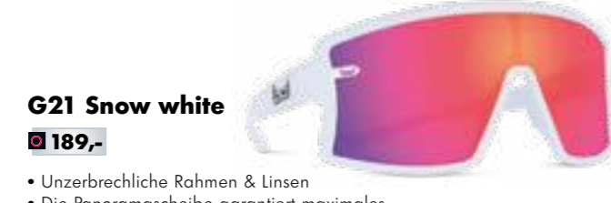
G21 Snow white € 189,-