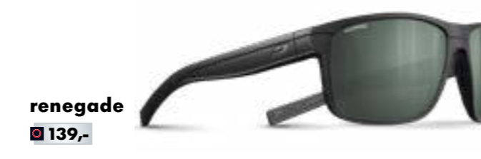
renegade € 139,-