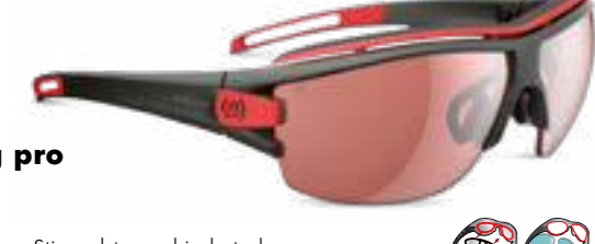
trace ng pro € 235,-