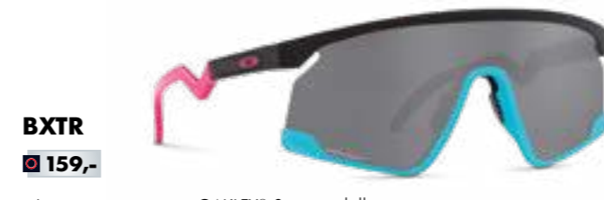
BXTR € 159,-

Kreativität, langjährige Forschung und Entwicklung auf hohem technischen Niveau, visionäres Querdenken, Pioniergeist sowie ein intensiver Austausch mit den besten Athleten der Welt machen OAKLEY® zum absoluten Vorreiter.