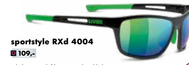
sportstyle RXd 4004 € 109,-