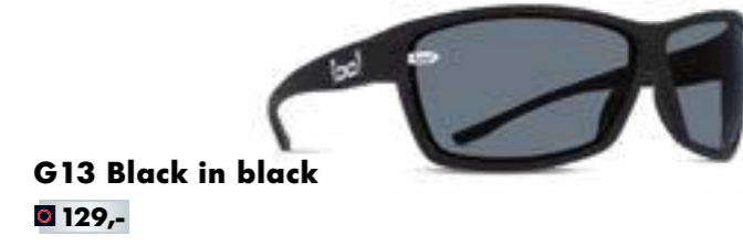
G13 Black in black € 129,-