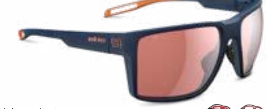
seaside € 179,-