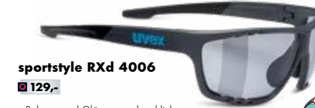
sportstyle RXd 4006 € 129,-