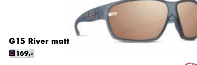
G15 River matt € 169,-