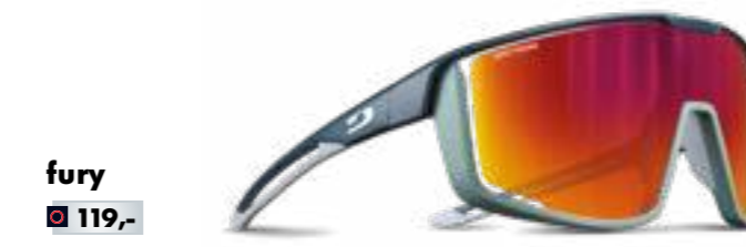
fury € 119,-