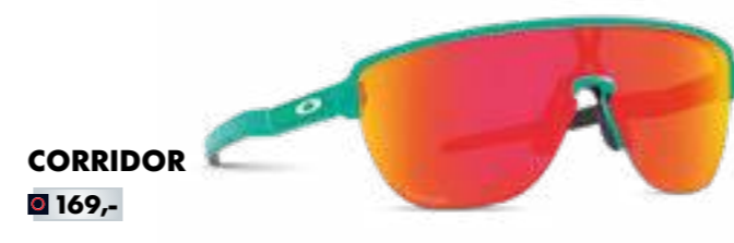
CORRIDOR € 169,-