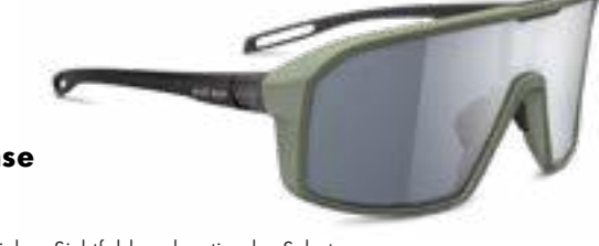
roadsense € 209,-