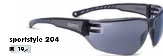
sportstyle 204 € 19,-

UNITED OPTICS AUSTRIA DIE FACHOPTIKER-KETTE