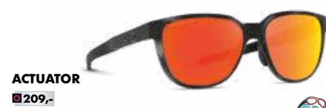
ACTUATOR € 209,-