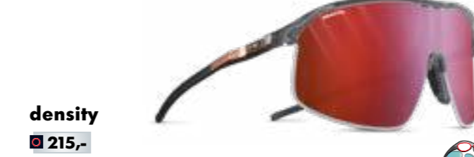
density € 215,-