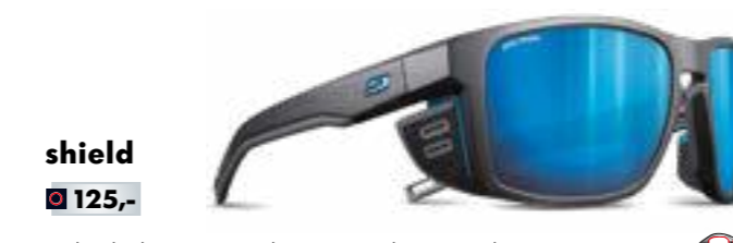
shield € 125,-