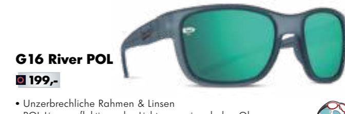
G16 River POL € 199,-