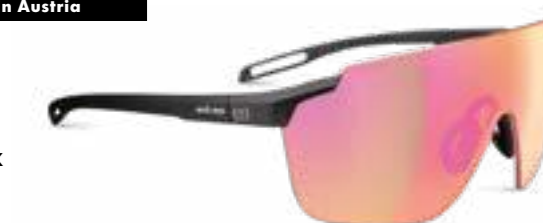
vistair-x € 254,-