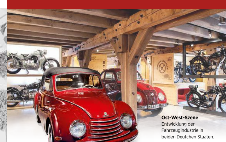
Ost-West-Szene Entwicklung der Fahrzeugindustrie in beiden Deutschen Staaten.

Einzigartige historische Motorräder und Automobile warten auf ihre Entdeckung. Reisen Sie in einem Hanomag Kommissbrot zurück in die „Goldenen Zwanziger“ oder setzen Sie sich in eine typische