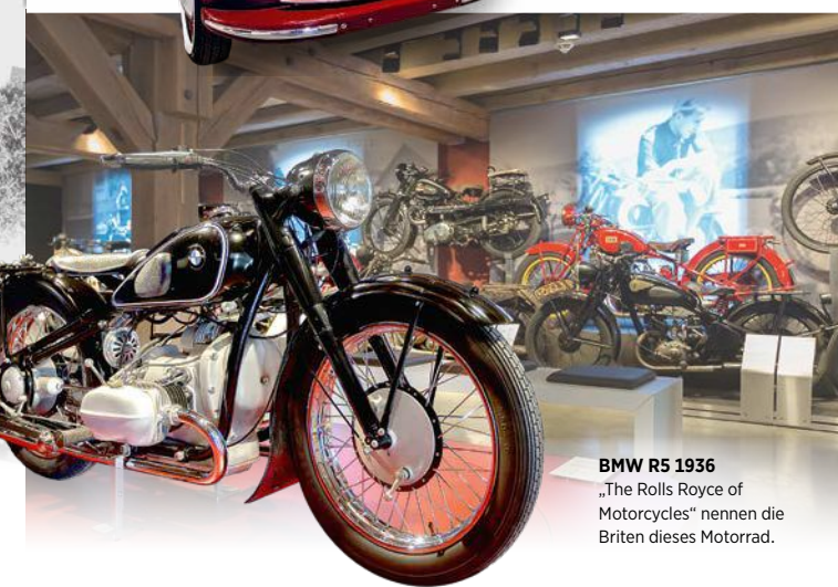
BMW R5 1936 „The Rolls Royce of Motorcycles“ nennen die Briten dieses Motorrad.