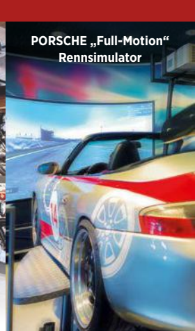
PORSCHE „Full-Motion“ Rennsimulator