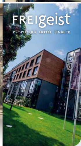
FREIGEIST PS.SPEICHER HOTEL EINBECK