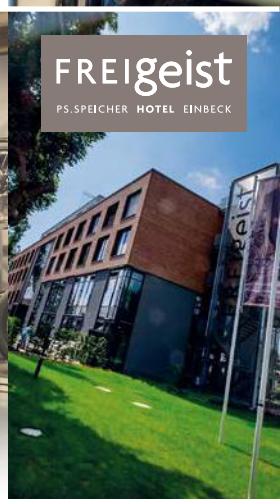
FREIGEIST PS.SPEICHER HOTEL EINBECK