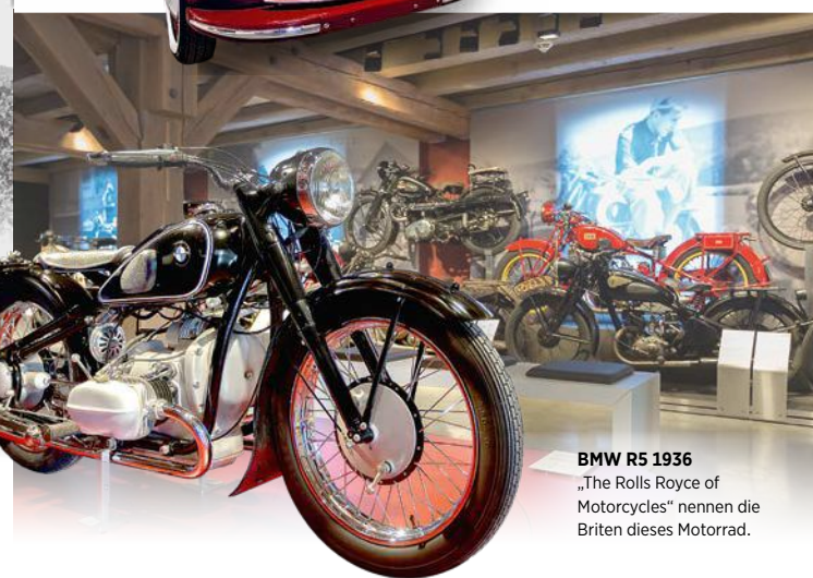
BMW R5 1936 „The Rolls Royce of Motorcycles“ nennen die Briten dieses Motorrad.