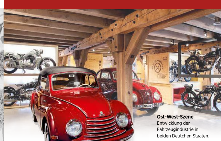
Ost-West-Szene Entwicklung der Fahrzeugindustrie in beiden Deutschen Staaten.

Einzigartige historische Motorräder und Automobile warten auf ihre Entdeckung. Reisen Sie in einem Hanomag Kommissbrot zurück in die „Goldenen Zwanziger“ oder setzen Sie sich in eine typische