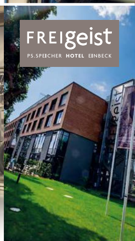
FREIGEIST PS.SPEICHER HOTEL EINBECK

Sommeröffnungszeiten* (APR–OKT) Di–So 10.00 bis 18.00 Uhr Mo geschlossen An Feiertagen geöffnet (auch montags) *Sammlung Lkw + Bus Di–Fr: 10.00 - 17.00 Uhr Sa + So: 10.00 - 18.00 Uhr Winteröffnungszeiten* (NOV–MRZ) Di–Fr 11.00 bis 17.00 Uhr Sa–So 10.00 bis 18.00 Uhr Mo geschlossen An Feiertagen geöffnet *Sammlung Lkw + Bus Di–Fr: 10.00 - 17.00 Uhr Sa + So: 10.00 - 18.00 Uhr Kontakt PS.SPEICHER Tiedexer Tor 3 37574 Einbeck Telefon +49 5561 8888 Telefax +49 5561 92320-283 entdeckung@ps-speicher.de