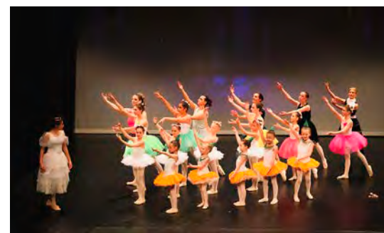
Ce rendez-vous rendez-vous mêlera ballet, comédie musicale et création théâtrale.