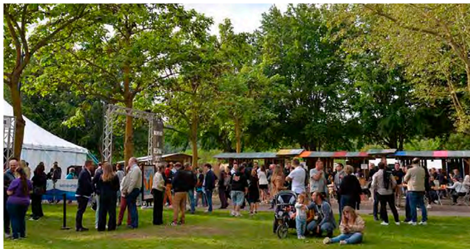
Le village du festival est niché entre les rivières Marne et le Petit Morin.

Cette 10 e édition débutera le vendredi 13 juin