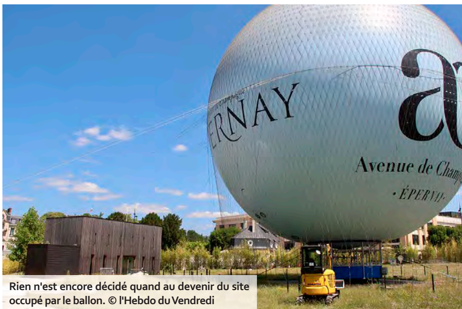
Rien n'est encore décidé quand au devenir du site occupé par le ballon.