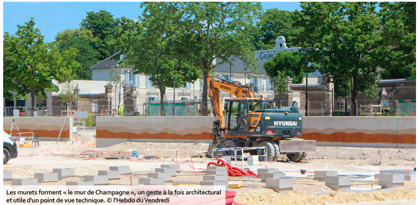
Les murets forment « le mur de Champagne », un geste à la fois architectural et utile d'un point de vue technique.

Le système de brumisation sera par ailleurs installé, tandis que les remblais de terre du côté du parking seront prochainement achevés. À noter que les nouveaux jeux pour enfants devraient être aménagés près de la sous-préfecture au second semestre. Si le chantier du Jard avance à vue d'œil, il demeure le reflet d'un projet urbain complexe et évolutif, où les réponses aux interroga-