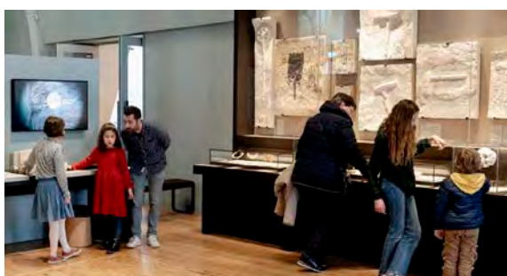
A l'occasion des Journées européennes de l'archéologie, le musée sparnacien est accessible à tous gratuitement.

✓ Journées européennes de l'archéologie, du vendredi 13 au dimanche 15 juin, de 11 h à 18 h, au musée du vin de Champagne et d'archéologie régionale d'Épernay. Entrée libre.