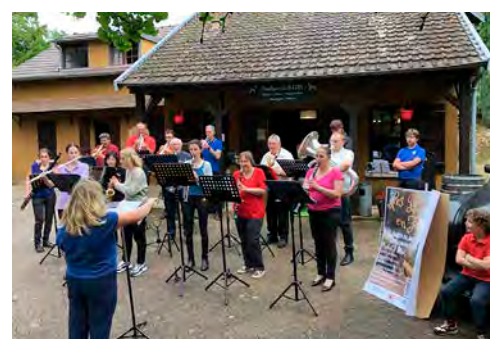
L'événement offrira sept heures de musique en continu.

L a Société musicale de Tours-sur-Marne lance son tout premier festival « Tours en Harmonies » le dimanche 15 juin, de 11 h 30 à 18 h 30, sur l'esplanade du stade du village. Dix orchestres d'harmonie de la région – dont ceux de Mardeuil, Magenta, Avize, Épernay, Sézanne, Fromentières, Ludes, Sainte-Ménéhould et bien sûr Tours-sur-Marne – se succéderont pour offrir sept heures de musique ininterrompue. Gratuit pour tous, l'événement promet de mettre en lumière la richesse et la diversité des instruments à vent et percussions, tout en favorisant les échanges entre musiciens et la découverte, pour le public, d'un répertoire festif et varié. La journée s'achèvera en apothéose avec deux morceaux surprises réunissant près de 200 musiciens. Restauration, food trucks et buvette compléteront le programme.