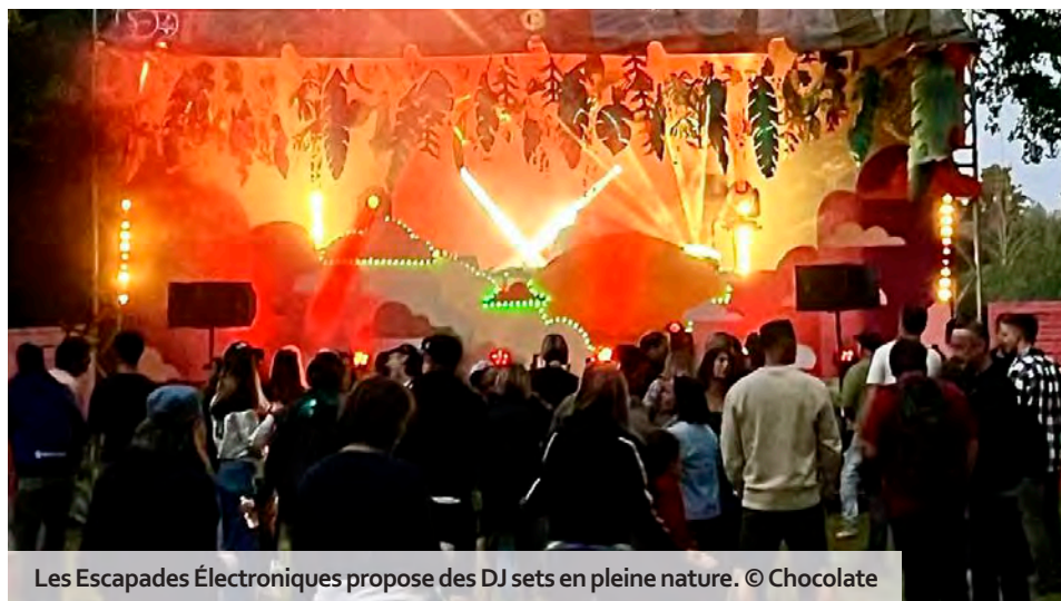
Les Escapades Électroniques propose des DJ sets en pleine nature. © Chocolate

Le festival Escapades Électroniques revient les 13 et 14 juin à Damery, au cœur du vignoble champenois, pour une troisième édition qui promet de faire vibrer la région au rythme de la musique électronique. Organisé par l'association Chocolate, l'événement s'installe à nouveau dans le parc de loisirs Countryside à Damery : un écrin de verdure caché au bout d'un chemin, entre arbres et pelouse, pour une expérience unique mêlant musique et nature. Chocolate s'appuie sur une longue tradition de fêtes et de soirées démarrée il y a 20 ans. Un voyage musical qui a fait étape dans des lieux emblématiques de la région, tels que des châteaux et des abbayes, mais aussi à la tour Montparnasse à Paris et au Palais du Tau à Reims. « On a toujours aimé faire danser les gens, c'est dans notre ADN, raconte Amaury Duquesne, en charge de la communication de l'association. Après une période de transition, on a trouvé ce site ma-