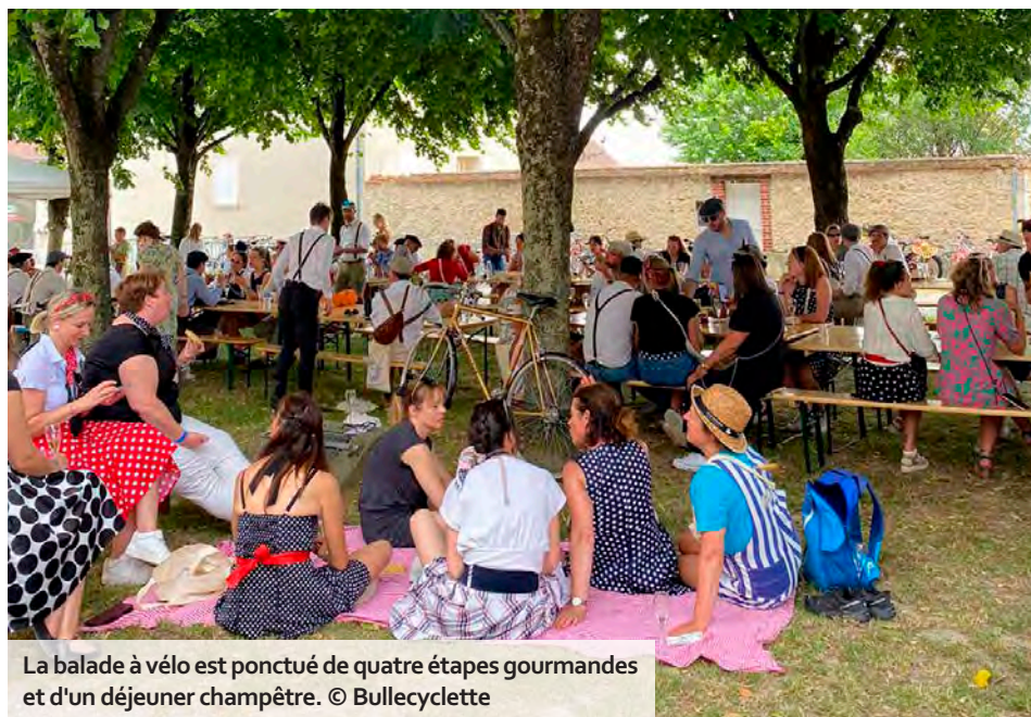
La balade à vélo est ponctuée de quatre étapes gourmandes et d'un déjeuner champêtre.