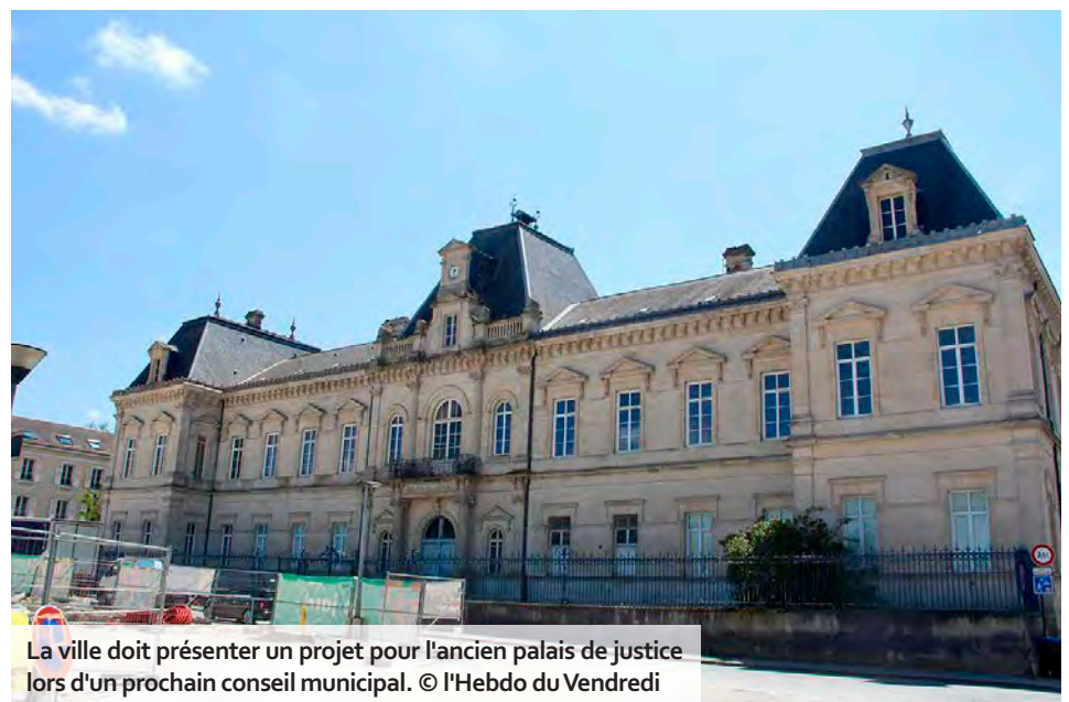
La ville doit présenter un projet pour l'ancien palais de justice lors d'un prochain conseil municipal.