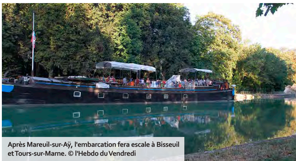
Après Mareuil-sur-Aÿ, l'embarcation fera escale à Bisseuil et Tours-sur-Marne.

D u mercredi 11 au dimanche 29 juin, la péniche Night & Day sillonne le canal de la Marne, transformant ses escales en rendez-vous culturels ouverts à tous. Cette initiative itinérante propose une programmation riche et variée en partenariat avec la MJC d'Aÿ, pour animer les berges et rapprocher les habitants de la culture. Cette année, l'embarcation visite trois communes : Mareuil-sur-Aÿ jusqu'au 15 juin, puis Bisseuil du 18 au 22 juin, et enfin Tours-sur-Marne du 25 au 29 juin. À chaque fois, elle accueille le public autour de son bar convivial les mercredis, jeudis et vendredis à partir de 17 h, et les samedis et dimanches dès 14 h.