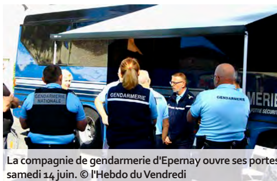
La compagnie de gendarmerie d'Épernay ouvre ses portes samedi 14 juin.

L a compagnie de gendarmerie départementale d'Épernay, située 2, avenue de la Martinique, ouvre ses portes au public le samedi 14 juin, de 9 h 30 à 17 h 30. Cette journée permettra aux visiteurs, petits et grands, de rencontrer les gendarmes locaux et de découvrir la diversité de leurs missions et métiers. Plusieurs stands seront à découvrir : brigade nautique, environnementale, transports aériens, véhicule rapide d'intervention, brigade cyber, maison de protection des familles, service du traitement de l'information, peloton de surveillance et d'intervention, brigade de recherches, brigade de proximité, groupe d'investigations cynophile, escadron de sécurité routière. Le Centre d'information et de recrutement de Reims sera également présent pour informer sur les carrières et les modalités de recrutement.