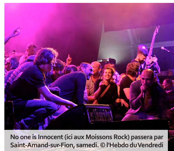
No one is Innocent (ici aux Moissons Rock) passera par Saint-Amand-sur-Fion, samedi.

✓ 7 e festival « La tête dans le Fion », vendredi 13 (ouverture à 19 h) et samedi 14 juin (18 h), Saint-Amand-sur-Fion - Gratuit - Infos : latetedanslefion.fr