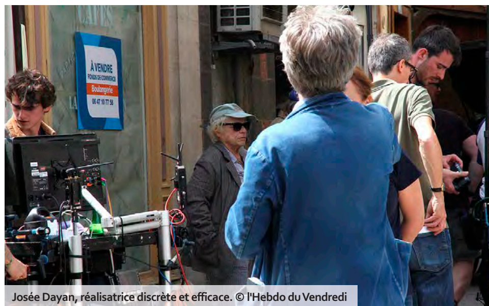
Josée Dayan, réalisatrice discrète et efficace.