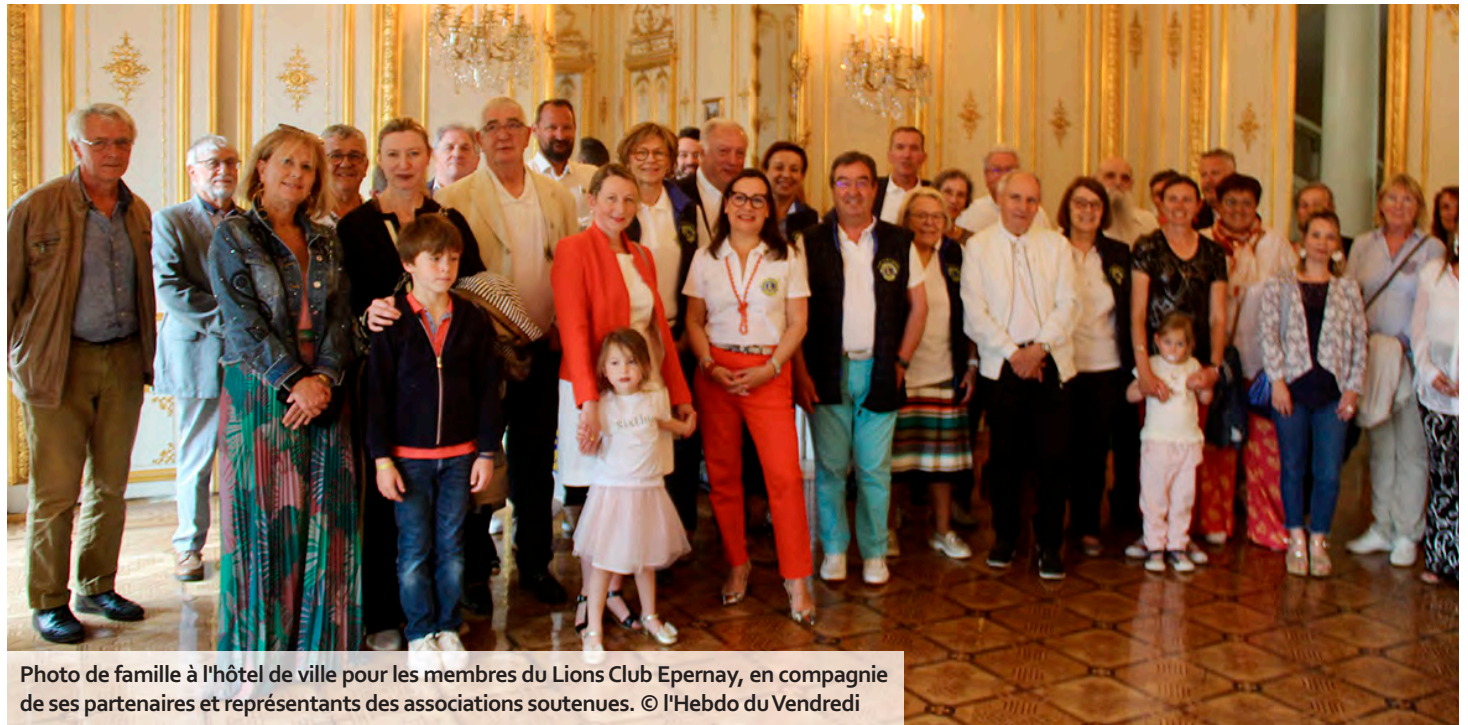
Photo de famille à l'hôtel de ville pour les membres du Lions Club Epernay, en compagnie de ses partenaires et représentants des associations soutenues.