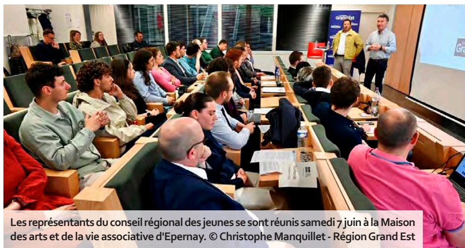
Les représentants du conseil régional des jeunes se sont réunis samedi 7 juin à la Maison des arts et de la vie associative d'Epernay.

Le travail du conseil régional des jeunes s'articule autour de six axes majeurs : santé, culture, éducation, transport, formation professionnelle et environnement. Ainsi, en ouverture de séance, ses membres ont dévoilé cinq propositions en faveur de l'environnement, issues de réflexions menées