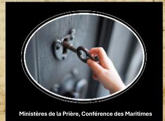
Ministères de la Prière, Conférence des Maritimes