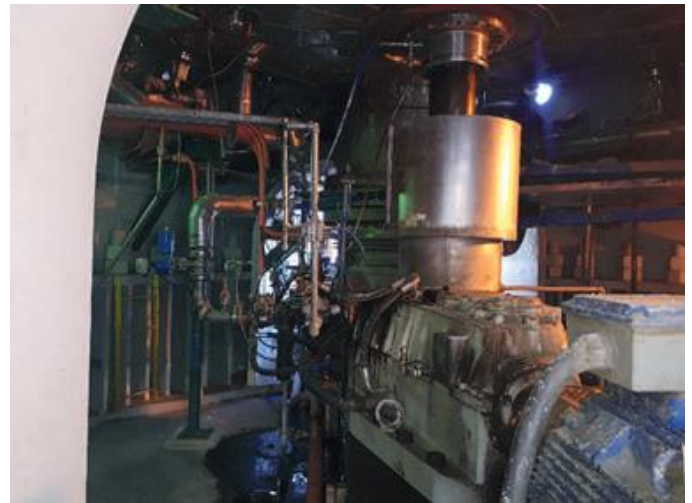
MEZCLADORES, RASTRILLOS DE FONDO Y CORREAS TRANSPORTADORAS