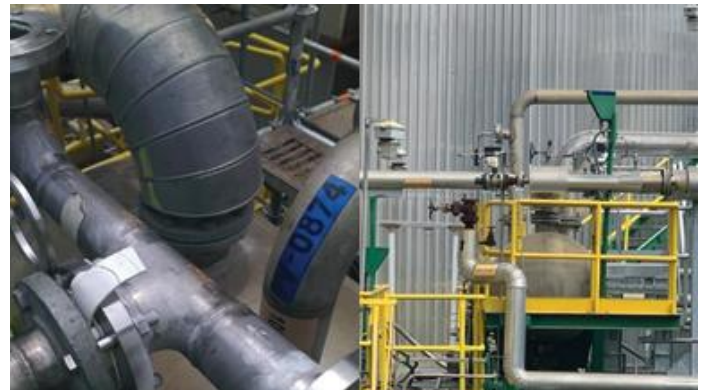
NUEVO CIRCUITO DESCARGA METANOL AREA EVAPORADORES CMPC PULP PLANTA LAJA