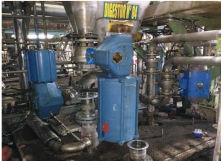
MODIFICACION PIPING LINEA FINAL VAPOR BAJA PRESION AREA DIGESTORES ARAUCO PLANTA VALDIVIA