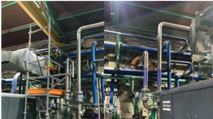
MONTAJE DE NUEVO COMPRESOR N7 AREA ENERGIA CMPC PULP PLANTA LAJA