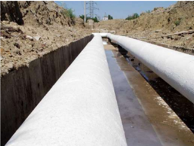
PREVENCION CORROSION DE TUBERIAS