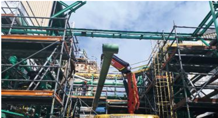
AUMENTO DE CAUDAL CHILLER AREA PLANTA QUIMICA CMPC PULP PLANTA LAJA