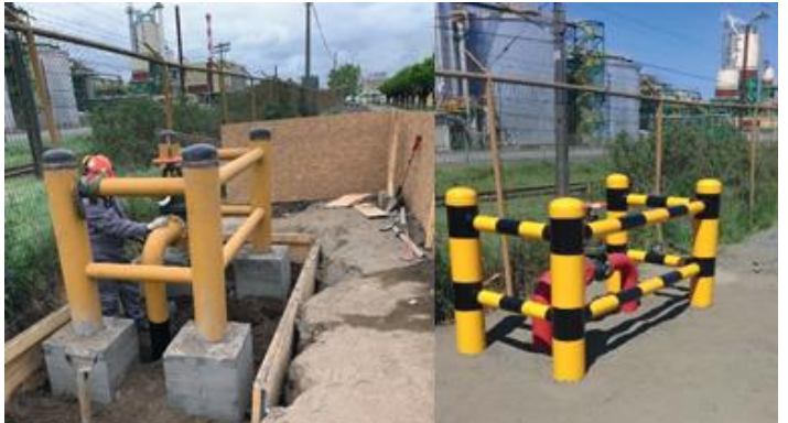
CAMBIO VALVULA N4 RCI AREA EFLUENTE CMPC PULP PLANTA LAJA