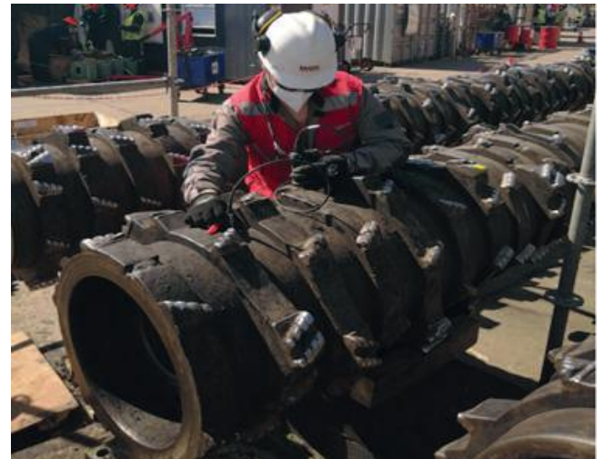
MEDICION DE ESPESORES