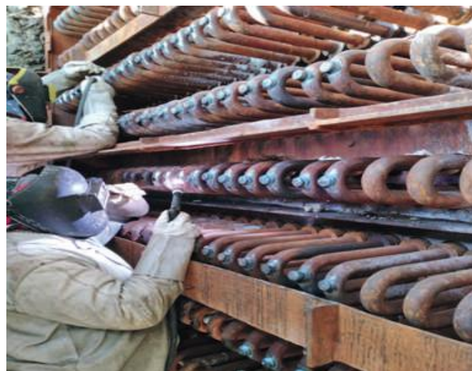
SOLDADURA CAÑERIAS Y TK DE BAJA Y ALTA PRESIÓN