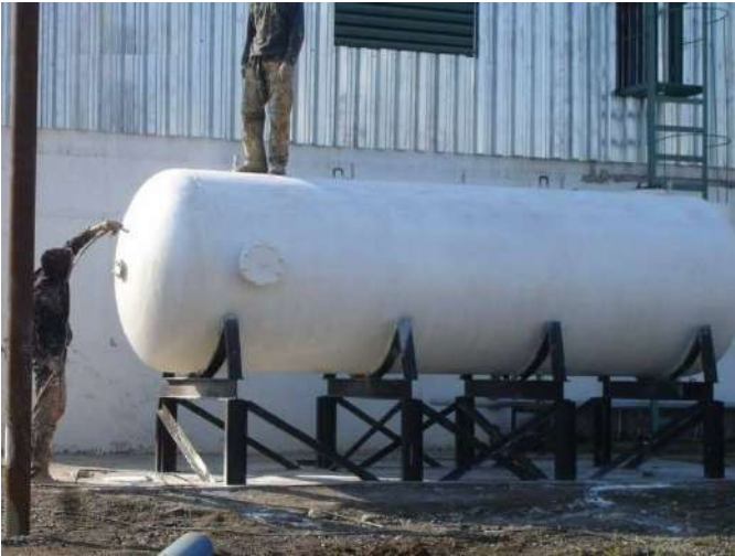
AISLACION DE ESTANQUE