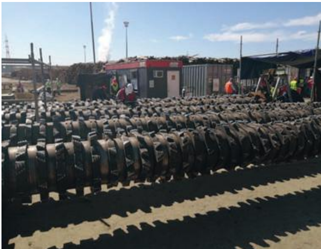
MANTENCION DE ROTORES