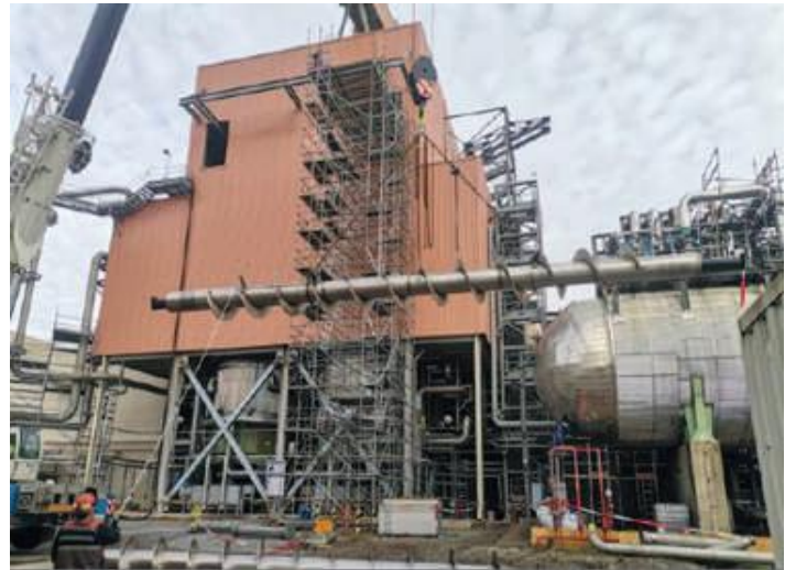
CAMBIO DE TORNILLO AREA FIBRA ARAUCO PLANTA VALDIVIA