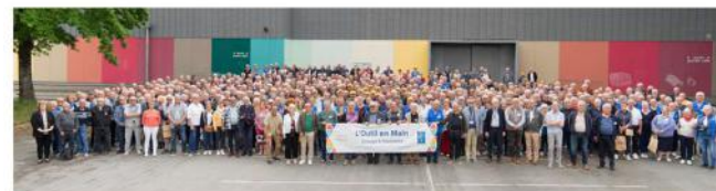
Salle des fêtes du Bourg LA ROCHE-SUR-YON le 30 avril 2026