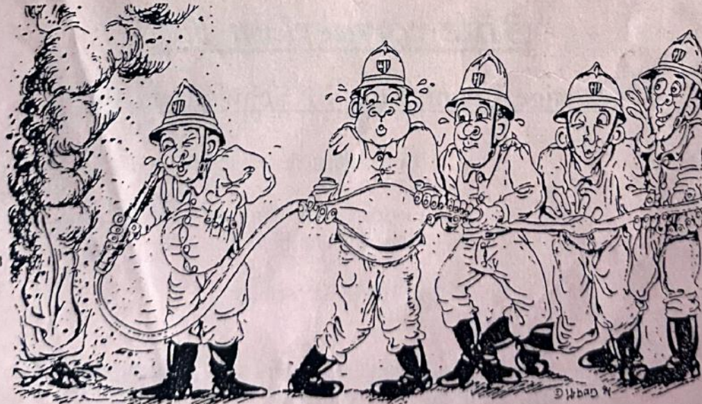
Wenn's auch manchmal etwas speißt und zwickt -- unsere Feuerwehrmänner finden immer einen Weg.