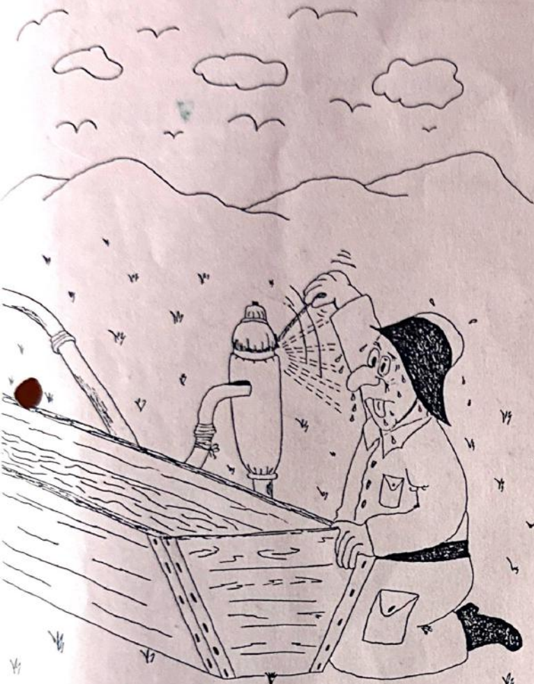
Wasser Marsch - Pump etwas schneller