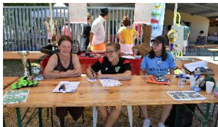
AS VLS FOOT