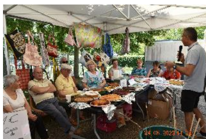
Les Fleurs des Champs