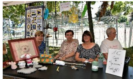
Les Petites Aiguilles