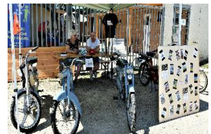
Les Pétoires Picardes