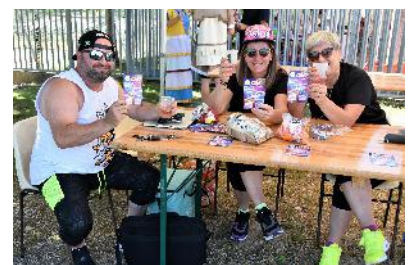
VLS Fit & Dance