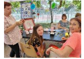
Peut-être une nouvelle adhérente ?

Le 2 avril 2023, nous avons organisé nos Puces des Couturières, dans la salle du Centre Bourg. Les visiteurs étaient au RDV et les stands bien fournis.