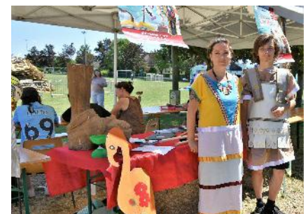
Artsouilles & Cie