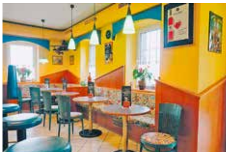
In gemütlicher Atmosphäre kann man hier nach der Tour einen guten Tropfen genießen

Wie bereits gesagt liegt der Thomashof optimal im Süden Kärntens und schnell ist man in den Nachbarländern Slowenien (10 km) und Italien (30 km) mit ihren traumhaften Bergrou- ten und südlichem Flair. Der Hausherr ist selbst leidenschaftlicher Motorradfahrer und schwärmt: „Meine Lieblingsroute ist die Nr. 4 aus der Tourenkarte von Motorradland Kärnten durch den Triglav Nationalpark. Die Strecke ist einfach ein Wahnsinn und man lernt dabei drei Kulturen und die verschiedenen kulinarischen Köstlichkeiten innerhalb weniger Kilometer kennen. Frühstück in Italien, Mittagessen in Slowenien und Abendessen in Österreich. Wo hat man das sonst?“