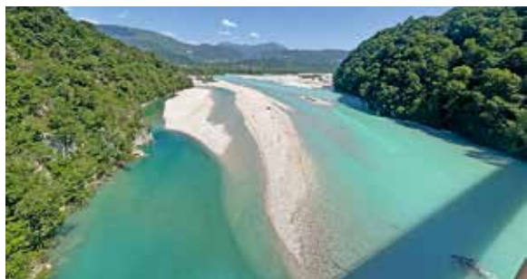
Der Tagliamento im Friaul gilt als einer der letzten Wildflüsse der Alpen.