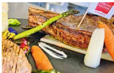
Kontrolle schafft Vertrauen: Die „Genussland Kärnten“-Köstlichkeiten sind mit dem AMA-Gütesiegel zertifiziert

„Schrauber-Ecke“, ein Waschplatz sowie in Trockenraum. In unmittelbarer Nähe gibt es eine Motorradwerkstatt und die GPS-Daten für das Navi sowie Tipps zur Wetterlage finden Biker gleich direkt im Hause Hassler. Der Genuss kommt im Familienbetrieb nicht zu kurz. Das Restaurant verwöhnt mit feinen Spezialitäten und traditionellen Gerichten, wobei auf die verantwortungsbewusste Auswahl der Lebensmittel und deren schonende, nährstoffhaltende Zubereitung besonderer Wert gelegt wird. So verwundert es nicht, dass das Haus Mitglied der Slow Food-Gemeinschaft Berg im Drautal ist und seit vier Jahren im Slow-Food-Guide ausgezeichnet wird.