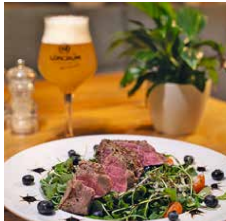
Loncium Bier ist mehrfach national und international ausgezeichnet