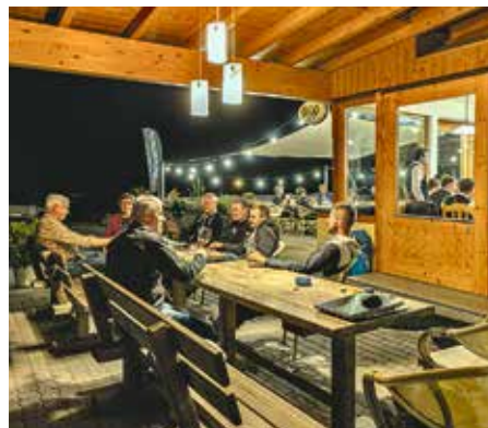
Genießen Sie echte Gastfreundschaft und herrliche Kärntner Schmankerln auf der gemütlichen Terrasse

Neben überdachten Parkmöglichkeiten gibt's für Reparaturen genügend Werkzeug und auch für Motoröle, Visiertücher oder Reinigungsmittel ist gesorgt. Ein Trockenschrank für die Bekleidung, ein Helm- und Stiefeltrockner sowie ein 7-Tage-Reifenservice stehen ebenfalls zur Verfügung.