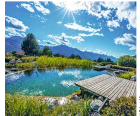
Der wunderschöne Naturteich lädt zum Baden mit Panoramablick ein

ner Tagestour einfach erreichbar. Gästeschwärmen auch von der Tour durch das slowenische Soča-Tal.