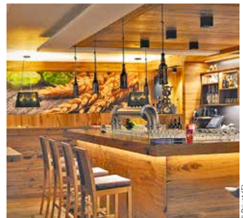
Das Loncium Brew Pub wurde seit dem Umbau der Bar zum beliebten Treffpunkt