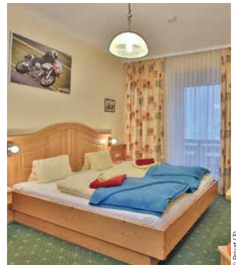
Das familiengeführte kleine Hotel bietet zehn gemütliche Zimmer