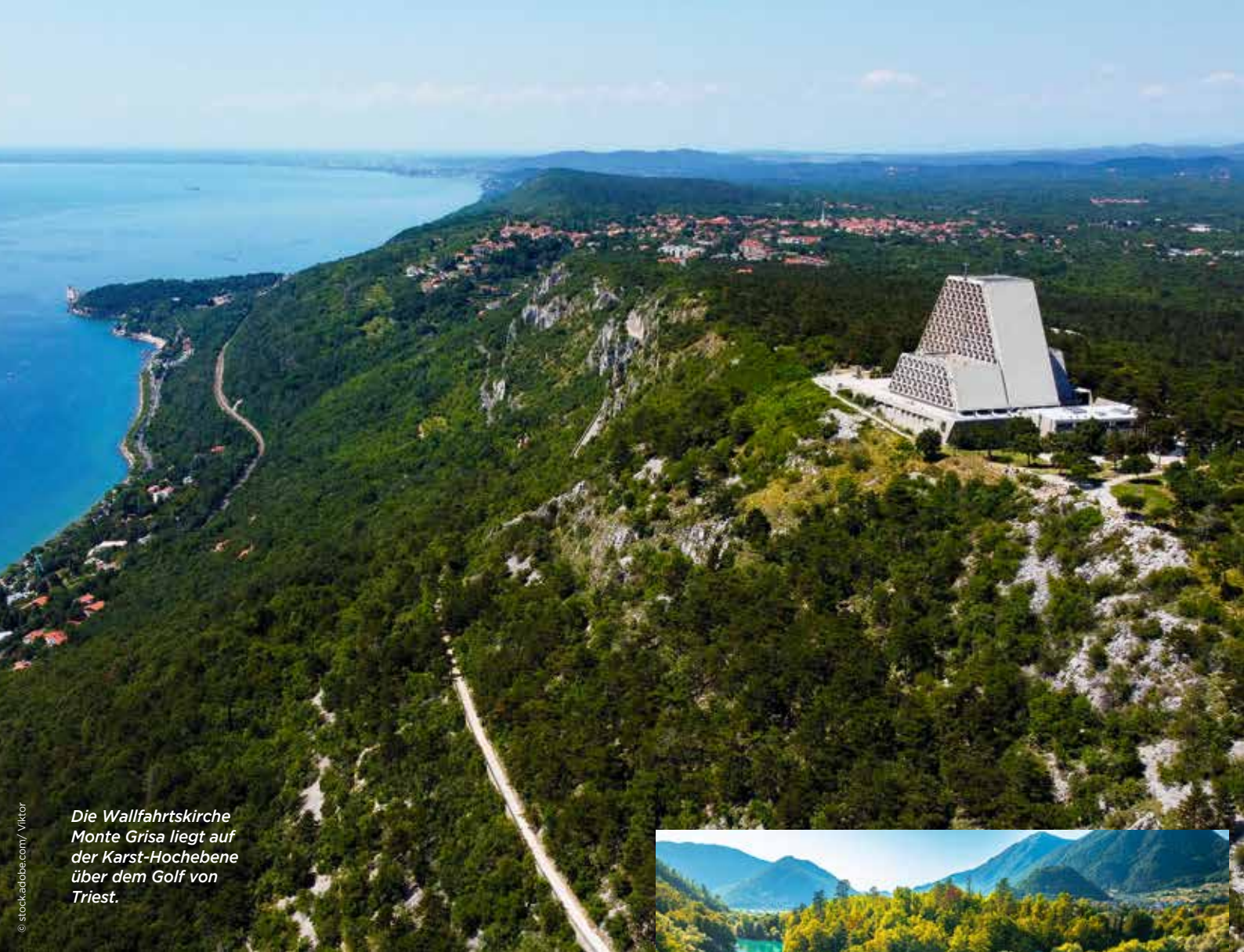
Die Wallfahrtskirche Monte Grisa liegt auf der Karst-Hochebene über dem Golf von Triest.

Gipfel der Julischen Alpen, ab. Wir haben heute leider keine Zeit für die kurvenreiche, kühn angelegte Piste, sondern überqueren die Grenze, die früher einmal heiß umkämpft war. An die blutigen Schlachten während der Napoleonischen Kriege und des Ersten Weltkrieges erinnern imposante Denkmäler und Festungsanlagen auf dem Weg, der uns nach Bovec im Sočatal führt.