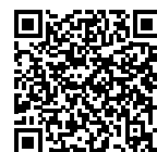
QR-Code scannen und mehr erfahren!

diert oder man zahlt 49 Euro pro Tour. Bis um 17 Uhr am Vortag jeder Tour muss man sich bei „Harry's Bike Tours“ unter harry@harrys-biketours.at oder +43(0)660/9603400 anmelden. Die Touren finden garantiert ab einer Person statt, es wird in kleineren Gruppen mit maximal zehn Personen gefahren. Sollten sich einmal mehr Interessierte anmelden, stehen weitere erfahrene Touren-Guides zur Verfügung.