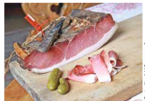
Die Gäste schätzen die gemütliche Atmosphäre und die hervorragende Kulinarik des Hauses