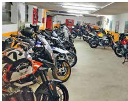
Das Bike übernachtet in der abgeschlossenen Garage