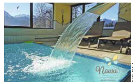
Wohlfühl-Oase: Im Pool lässt es sich nach einem anstrengenden Tag entspannen