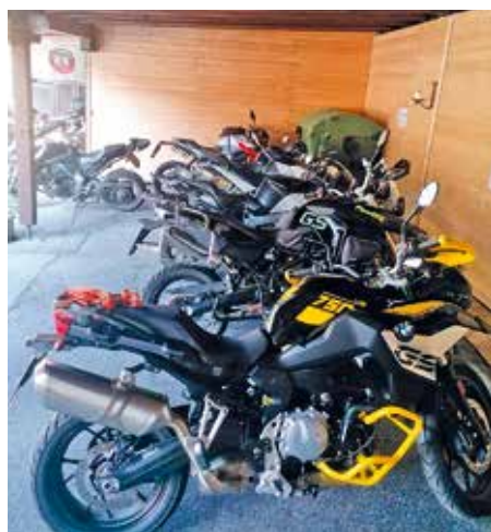
Eigene Carports sorgen für die ideale Unterbringung der Bikes

Nicht nur die Lage und die persönliche Betreuung werden bei diesem familienbetriebenen Hotel geschätzt: Die Gäste dürfen auch regionale und hausgemachte Kulinarik wie Hauswürste, Speck und Marmelade genießen. Für Gruppen mit Halbpension kocht die Chefin Köstlichkeiten wie Kirchenwirts Krusten-Bratl.