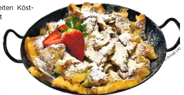
Genießen Sie die bodenständige Küche, wie den beliebten Kaiserschmarrn

Die Lage des Strasswirts ist einfach ideal: Im Alpen-Adria-Raum gelegen, kann man von hier abwechslungsreiche Ausflüge durch Kärnten, Italien und Slowenien unternehmen, dabei die herrliche Landschaft, das atemberaubende Panorama und die einzigartige Kulinarik genießen. Das Wirtepaar Sandra und Christof meint: „Wir kennen die schönsten Routen abseits des ‚Mainstreams‘, die echten Geheimtipps zum Einkehren, die schönsten Plätze zum Verweilen und die besten Foto-Stops. Sie werden überrascht sein!“