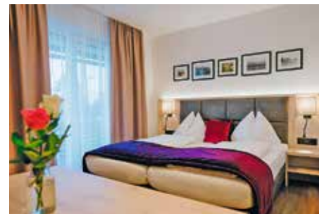
Sechs der 20 Zimmer wurden neu renoviert und bieten noch mehr Komfort