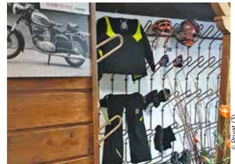
Falls einen mal der Regen erwischt - im Trockenraum wird alles schnell wieder trocken

sphärenpark, und wer einmal sein Bike stehen lassen möchte, kann vielleicht eine Wanderung über seine sanften Kuppen machen und in einer der uralten Hütten einkehren. Aber auch andere Sportmöglichkeiten, wie Bogenschießen, Mountainbiken oder Klettern im Hochseilpark, werden hier geboten.