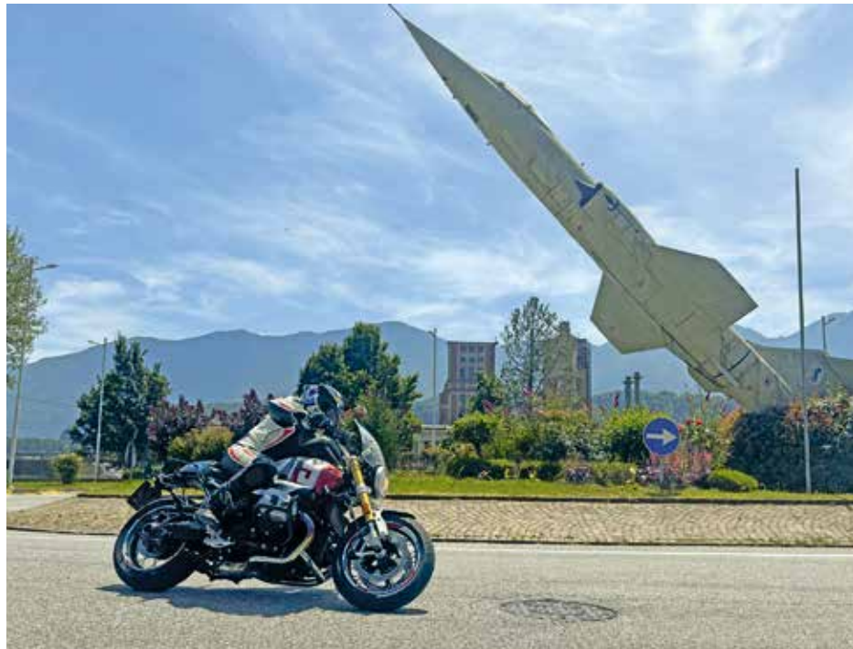
Jede Woche stehen drei tolle geführte Tagestouren am Programm.