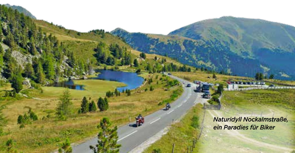
Naturidyll Nockalmstraße, ein Paradies für Biker

Motorradurlauber finden hier Annehmlichkeiten wie einen Trockenraum und eine Garage. Sie schätzen besonders die zentrale Lage des Hotels Berghof als idealen Startpunkt für erlebnisreiche Touren durch Kärnten und Salzburg, aber auch nach Italien und Slowenien. Besondere Empfehlungen des Hauses: eine Tour über die 35 Kilometer lange Nockalmstraße mit 52 verführerischen Kehren oder eine Fahrt zur imposanten Stau-mauer Kölnbreinsperre auf der atemberaubenden Malta Hochalmstraße.