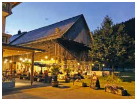
Genießen Sie Ihren Urlaub auf den heimeligen Terrassen des Gasthofes

Der große Hunger wird im Gasthof in Ledenitzen gestillt, wo man mit regionalen Speisen verwöhnt wird. Gäste schätzen das wunderbare Frühstücksbuffet, aber auch die selbstgebrannten Schnäpse zählen zu den Spezialitäten des Hauses. Außerdem kann man aus der kleinen, feinen Weinkarte wählen oder das beliebte Hausbier probieren. Genießen kann man all die Köstlichkeiten in ländlicher At-