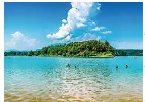
Verbringen Sie nach der Tour entspannende Stunden am hauseigenen Badestrand am Faaker See, nur vier Kilometer entfernt

Motorradurlauber schätzen die zentrale Lage: Von hier aus ist man schnell überall in Kärnten und kann in alle Himmelsrichtungen „ausreiten“, ohne eine Strecke doppelt zu fahren. Besonders beliebt sind die Dreiländer-Touren durch Kärnten, Slowenien und Italien, die vor allem durch ihre beeindruckenden Passstraßen unvergesslich bleiben werden. Starten kann man seine Tour bequem von der großen Halle aus, hat beim Packen also immer ein Dach über dem Kopf. Hier befindet sich sogar ein eigener Gäste-Informationsstand mit Anregungen für Touren und Ausflugsziele. Aber natürlich geben auch die Gastgeber gerne noch manchen Tipp weiter.