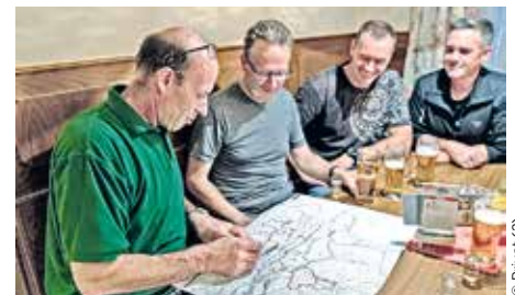
Der Hausherr berät Sie gerne zu den vielen wunderschönen Biker-Touren in der Umgebung

Speck und der Gaaltaler Almkäse. Zudem bietet das Haus seinen Gästen eine Sauna-Landschaft inklusive Finnischer Sauna, Infrarot- und Dampfsauna.