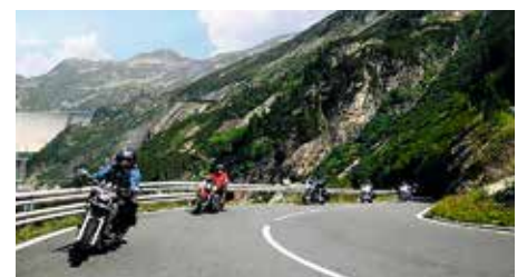
Schon die An- und Abreise auf der Malta Hochalmstraße ist ein Kurvenspaß