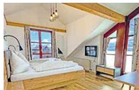
Die hellen und gemütlichen Zimmer laden zum Verweilen ein