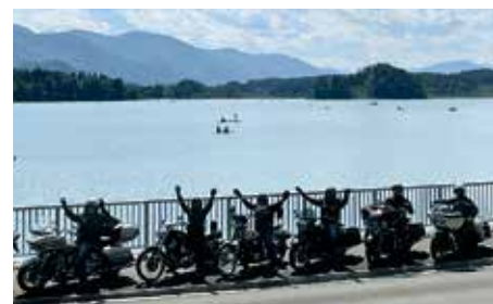
Der Faaker See ist der perfekte Ausgangspunkt für Motorradtouren in drei Ländern.

Die Region rund um den Faaker See ist ein Paradies für Biker. Traumhafte Touren in Kärnten, nach Slowenien und Italien starten direkt vor der Tür. Wurzenpass, Vršičpass, slowenische Bergstraßen oder italienische Panoramarouten – alles ist bequem erreichbar. Als Biker genießt man im Hotel Kanz sichere Abstellplätze und eine herzliche Aufnahme in familiärer Atmosphäre.