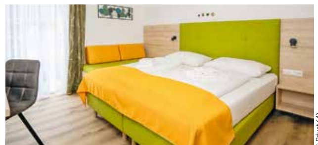
Das Drei-Sterne-Hotel bieten höchsten Komfort und persönlichen Service