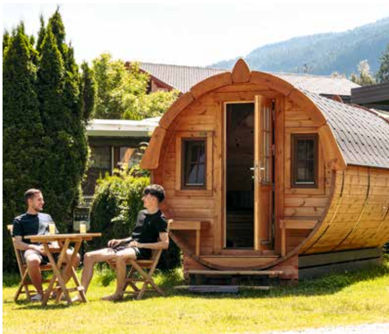
Minimalistisch, urig, einfach und reizend: die Campingfässer am Ufer des Afritzer Sees

Nach einer erlebnisreichen Tour können Sie sich im eigenen Seebad erholen und anschließend im gutbürgerlichen Restaurant Gaumenfreuden aus der nachhaltigen Speisekarte genießen, im Sommer gerne auf der großen Terrasse. Die freundlichen Gastgeber sind stolz darauf, als Motorradhotel in Kärnten ausgezeichnet worden zu sein und laden Sie herzlich dazu ein, Ihre nächste Motorradreise im Fischerhof Glinzner zu verbringen.