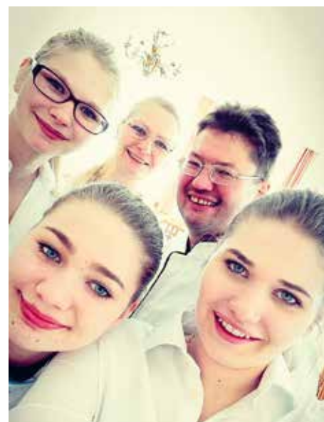
Die ganze Familie sorgt für ein Ambiente zum Wohlfühlen