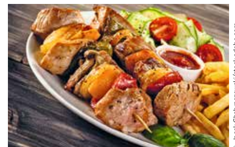
Eine Spezialität des Hauses ist der „Presslauer Bergspieß“ – gerade richtig nach einem Motorradausflug