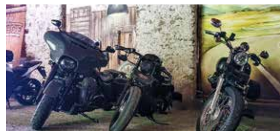
Sie schlafen in gemütlichen Zimmern, Ihr Bike in der absperrbaren Garage