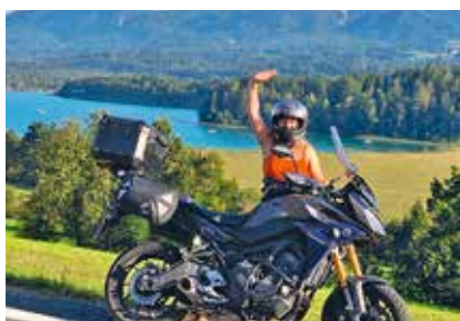
Motorradurlaubern stehen 18 individuelle Apartments zur Verfügung.

Biker-Annehmlichkeiten wie ein überdachter Abstellplatz, Waschmöglichkeit, Werkzeug und vieles mehr sind im nawu selbstverständlich. Wer nun denkt, es geht nicht besser, der irrt! Es gibt auch noch die Holiday Plus Card. Falls an einem Tag die Tour kürzer ausfällt, oder der Ofen eine Pause braucht, kann man mit dieser inkludierten Freizeitkarte unzählige Ausflugsziele besuchen, wie Gondeln, Sessellifte und das Strandbad.