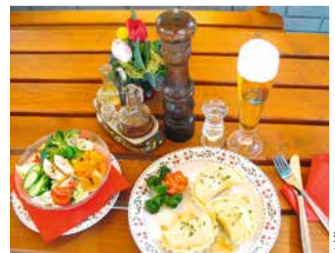
Handgemachte Kärntner Kasnudeln und weitere Schmankerln