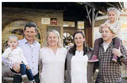
Familienbetrieb in 3. Generation – hier werden die Gäste täglich beraten, damit jeder Tag zu einem Erlebnis wird