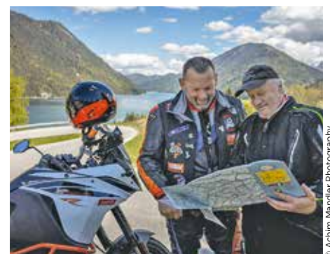
Unser Haus ist der ideale Ausgangspunkt für viele spannende Motorradtouren