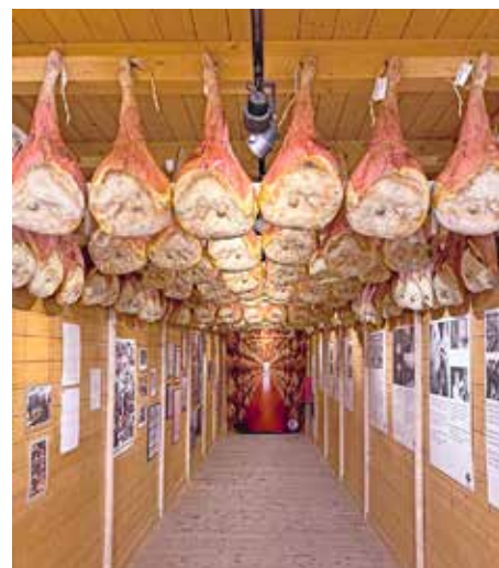
Es geht auch nach San Daniele, wo der berühmte Prosciutto hergestellt wird.

Alle Gäste, die in einem Mitgliedsbetrieb von Motorradland Kärnten nächtigen, kommen in den Genuss von drei kostenlosen Touren pro Woche. Aber auch alle anderen Kärnten-Urlauber und Einheimische können gerne mitfahren: Die Touren sind entweder in den Gästekarten der jeweiligen Regionen inklud-