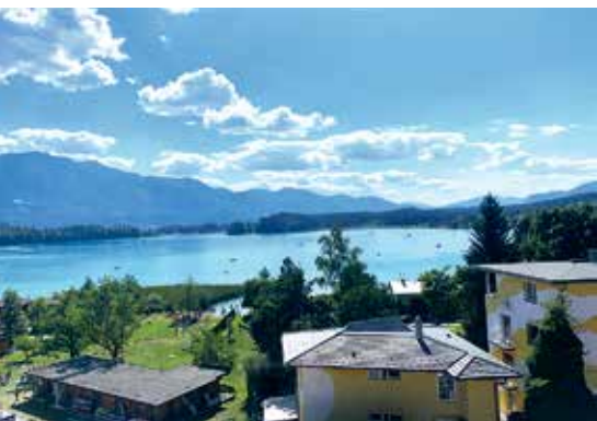
Reichhaltiges Frühstücksbuffet und regionale Köstlichkeiten im À-la-carte-Restaurant mit Sonnenterrasse.

Wer Wert auf Wohlfühlen legt, wird sich im Hotel Kanz sofort zuhause fühlen. Die gemütlichen Zimmer, die persönliche Betreuung und der traumhafte Blick auf See und Berge sorgen für Erholung vom ersten Moment an. Besonders beliebt ist die großzügige Sonnenterrasse, auf der man morgens ein reichhaltiges Frühstück und abends regionale Küche genießen kann.