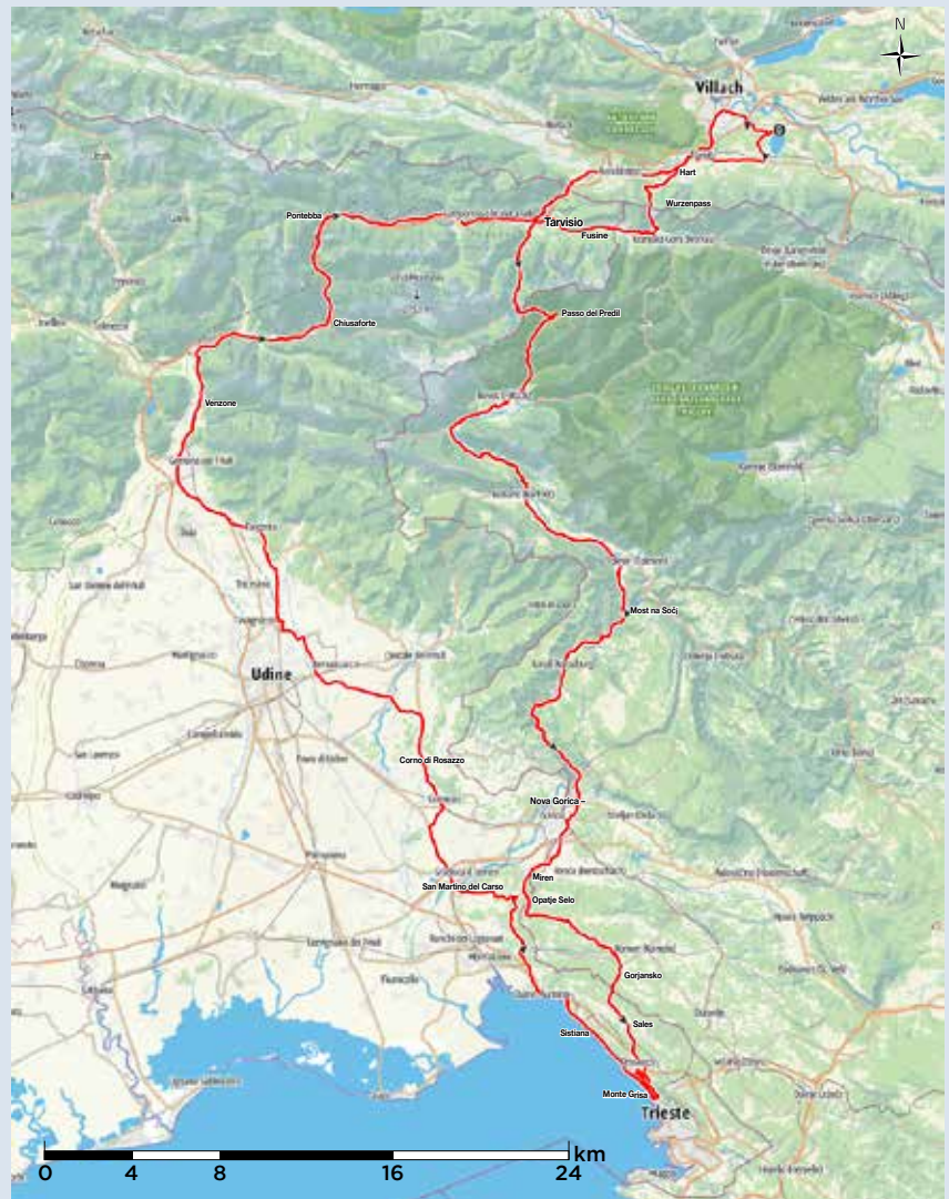
Grafik und Karte © outdooractive

Erlebenswert: Kärnten Therme in Warmbad Villach – Bunkermuseum am Wurzenpass – Laghi di Fusine/Weißenfelder Seen – Festung, Batterie und Fort Predel am Predilpass – Festung Kluzè und Fort Hermann in Ravnì Laz bei Bovec – Freilichtmuseum am Kolovrat – Heimatmuseum Tolminski Museum in Tolmin – Käsemuseum, Museum des Ersten Weltkriegs in Kobarid – Steinbrücke in Kanal ob Soči – Wallfahrtskirche am Monte Grisa – Schloss Miramare in Triest – Abtei Corno di Rosazzo – Dom und romanische Kapelle mit Mumien in Venzone – Slizza-Schlucht in Tarvisio – Zollmuseum in Coccau