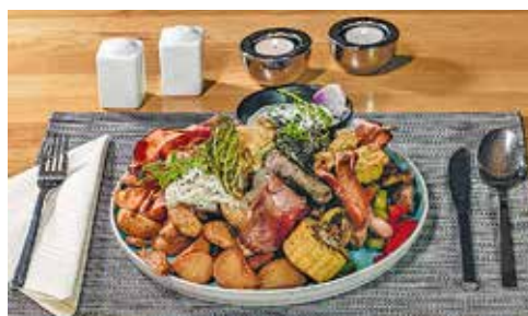
Gespeist wird vorzüglich à la carte, bevor es zu Cocktails auf die Panoramaterrasse geht