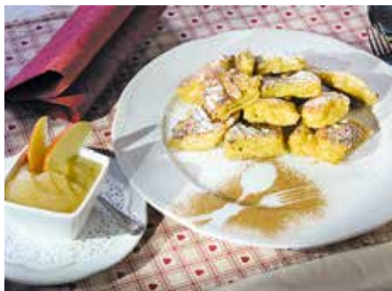
Lassen Sie sich nach einer schönen Tour den süßen Kaiserschmarren schmecken

sphärenpark, und wer einmal sein Bike stehen lassen möchte, kann vielleicht eine Wanderung über seine sanften Kuppen machen und in einer der uralten Hütten einkehren. Aber auch andere Sportmöglichkeiten, wie Bogenschießen, Mountainbiken oder Klettern im Hochseilpark, werden hier geboten.