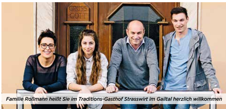
Familie Roßmann heißt Sie im Traditions-Gasthof Strasswirt im Gailtal herzlich willkommen