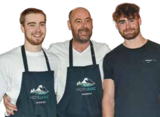
Das familiär geführte Hotel mit herzlichem Ambiente für Biker.

An einem der schönsten Plätze direkt am Faaker See liegt das familiär geführte Hotel Kanz. Hier genießen Motorradfahrer ein entspanntes, herzliches Ambiente – kombiniert mit perfekter Lage für Touren in drei Länder. Der hauseigene Badestrand macht den Aufenthalt einzigartig.