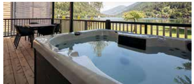
In den Mobile Homes genießen Sie die gemütliche Atmosphäre eines Campingplatzes und den Luxus eines Hotels