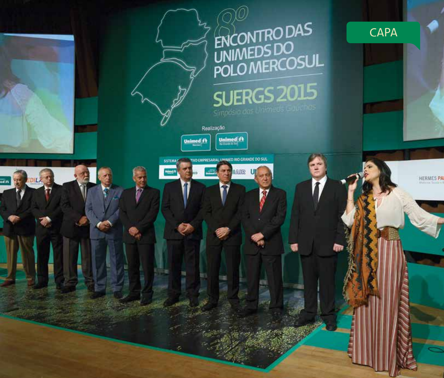
Cerimônia de abertura do 8º Polo Mercosul e Suergs 2015