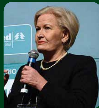
Ana Amélia Lemos Senadora

As fraudes das órteses, próteses e materiais especiais (OPMEs) são crimes. Apesar do grande volume de demandas judiciais e de recursos envolvidos, os órgãos gestores, SUS e Ministério da Saúde, não conseguiram perceber os desvios que vinham sendo cometidos ao longo do tempo por alguns médicos, advogados e fornecedores. Só depois que a mídia denunciou a chamada “Máfia das Próteses” é que os ministros da Saúde e da Justiça vieram a público, anunciando medidas para evitar fraudes, que já haviam drenado enorme volume de recursos públicos de um setor carente de investimentos. Pedidos, por via judicial, de materiais disponíveis apenas de um fornecedor, com orçamentos superfaturados e indicação de pacientes que não tinham necessidade de cirurgia são exemplos do descontrole que havia no setor. Houve falta de fiscalização, controle e, sobretudo, transparência, lesando os pacientes, os planos de saúde, os profissionais honestos, as instituições hospitalares, a indústria que produz equipamentos e prejudicando muito o SUS, sempre o mais demandado. A credibilidade do sistema foi, também, afetada. Transparência também faz bem à saúde!