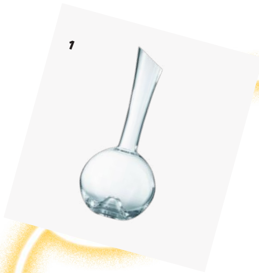
TABLE DES FÊTES