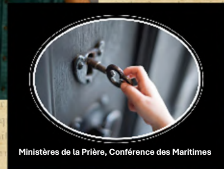
Ministères de la Prière, Conférence des Maritimes