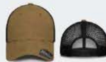
AMARILLO TRIGO/NEGRO ONE SIZE/FITTED