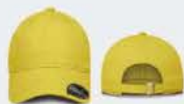
AMARILLO CLARO SKU: 19842-0695 UNITALLA