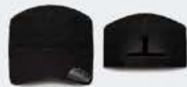
NEGRO SKU: 00000100000 UNITALLA