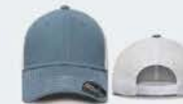
AZUL ACERO/BLANCO SKU: 10492-01033 UNITALLA