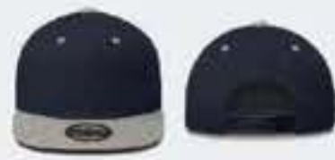
AZUL MARINO/GRIS CLARO SAL: 82794-02116 UNITALLA