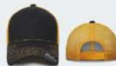
NEGRO/A.MANGO SKU: 10492-01012 UNITALLA