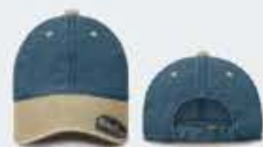
842 4004-8004 UNITALLA