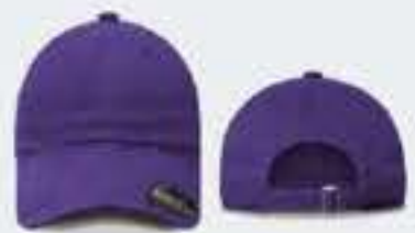
MORADO SKU: 19842-0701 UNITALLA