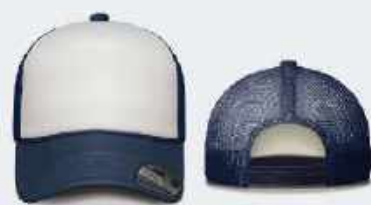
BLANCO/AZUL MARINO SKU: E280H-00222 UNITALLA