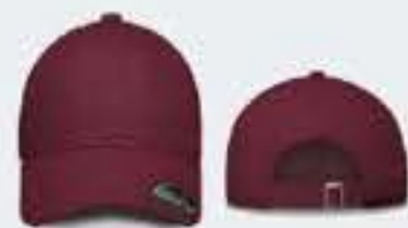
VINO SKU: 19842-0692 UNITALLA