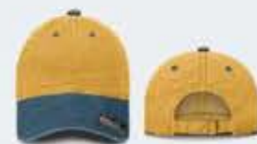
842 4004-8004 UNITALLA