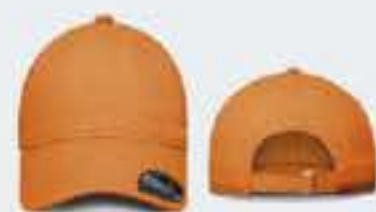
NARANJA CLARO SKU: 19842-0698 UNITALLA