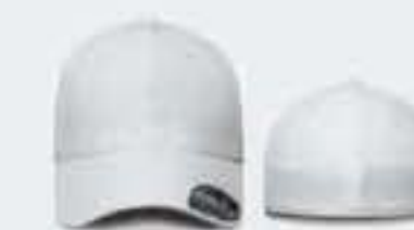
BLANCO 50% 55000-40000 UNITALLA