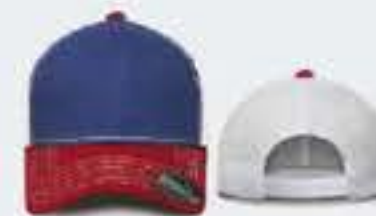
AZUL REY/ROJO/BLANCO SKU: 10492-01028 UNITALLA