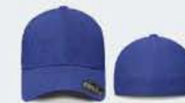
AZUL REY 50% 55000-40000 UNITALLA