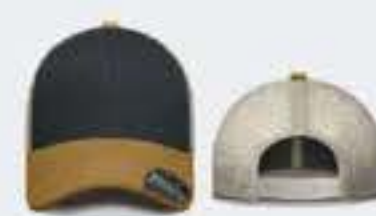
A.ÍNDIGO/A.TRIGO/ARENA SKU: 10492-01020 UNITALLA