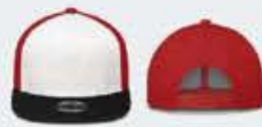
BLANCO/NEGRO/ROJO SKU: 42194-00003 UNITALLA