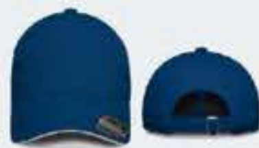
AZUL REY/SW BLANCO