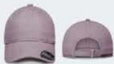
LILA SKU: 19842-0699 UNITALLA