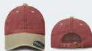
ROJO/KAKY 842 4004-8004 UNITALLA