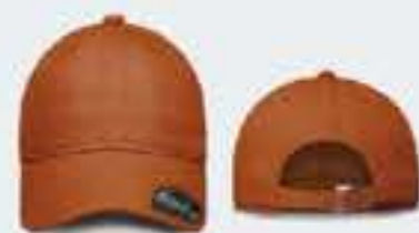
NARANJA LADRILLO SKU: 19842-0700 UNITALLA