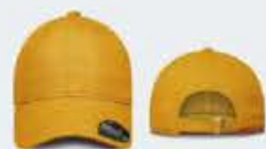
AMARILLO MANGO SKU: 19842-0697 UNITALLA