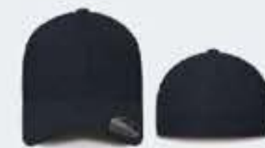
AZUL MARINO 50% 55000-40000 UNITALLA