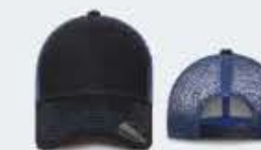
NEGRO/AZUL REY SKU: 10492-01017 UNITALLA