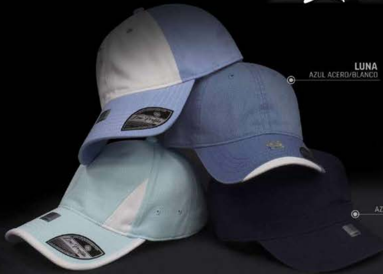
LUNA AZUL ACERO/BLANCO