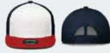
BLANCO/ROJO/A.MARINO SKU: 42194-00010 UNITALLA