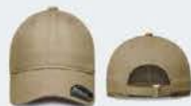
KAKY SKU: 19842-0694 UNITALLA