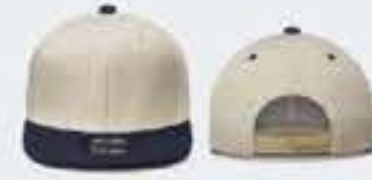
ARENA JASPE/MARINO SAL: 82794-02107 UNITALLA