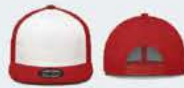
BLANCO/ROJO/ROJO SKU: 42194-00004 UNITALLA