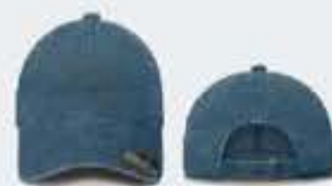
AZUL MARINO 842 4004-8004 UNITALLA