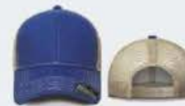
AZUL REY/KAKY SKU: 10492-01030 UNITALLA