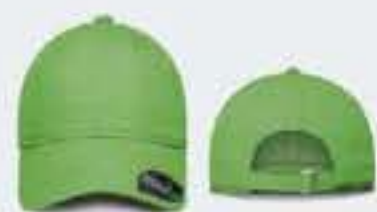
VERDE LIMÓN SKU: 19842-0694 UNITALLA