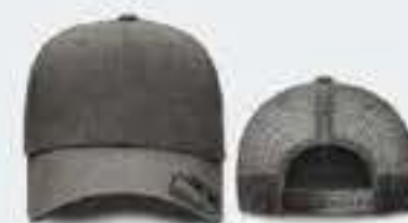
GRIS OBSC. JASPE/GRIS OBSC S/M - 55CM - 64CM UNITALLA