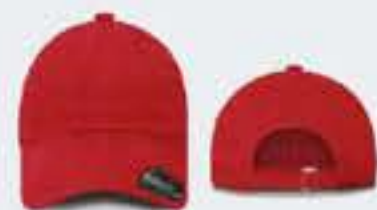
ROJO SKU: 19842-0690 UNITALLA