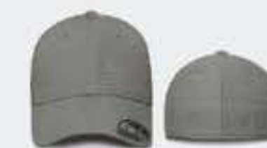
GRIS CLARO 50% 55000-40000 UNITALLA