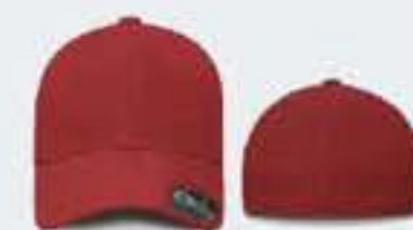
ROJO 50% 55000-40000 UNITALLA