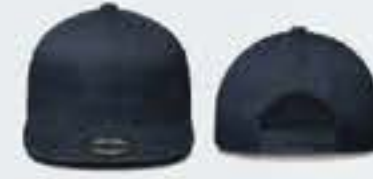
AZUL MARINO SKU: 42194-00023 UNITALLA