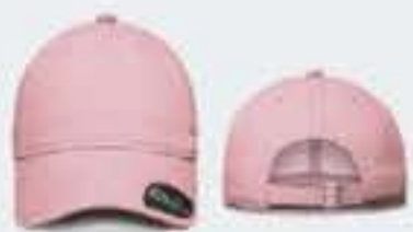
ROSA PASTEL SKU: 19842-0698 UNITALLA