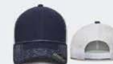
AZUL MARINO/BLANCO SKU: 10492-01025 UNITALLA