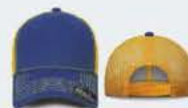
AZUL REY/A.MANGO SKU: 10492-01029 UNITALLA