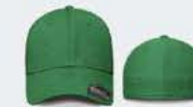
VERDE BANDERA 50% 55000-40000 UNITALLA