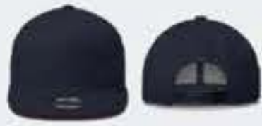
AZUL MARINO SAL: 82794-02115 UNITALLA