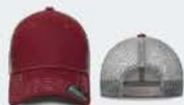
VINO/GRIS 040. 24901-24902 / UNITALLA