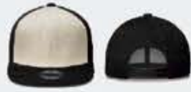
ARENA JASPE/NEGRO/NEGRO SAL: 82794-02109 UNITALLA