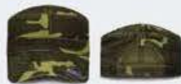
CAMUFLAJE VERDE MILITAR SKU: 00000100000 UNITALLA