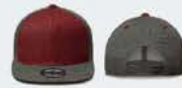
VINO/GRIS O.JASPE/GRIS O.JASPE SAL: 82794-02112 UNITALLA