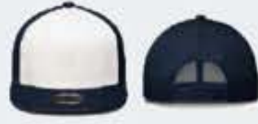
BLANCO/A.MARINO/A.MARINO SKU: 42194-00009 UNITALLA