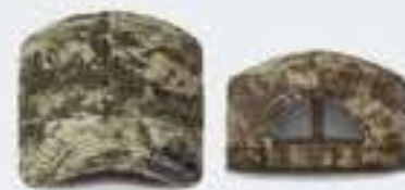
CAMUFLAJE KAKY DIGITAL SKU: 00000100000 UNITALLA