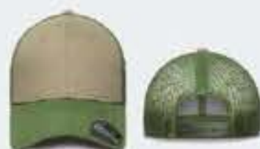
KAKY/V.IRLANDÉS/V.IRLANDÉS 040. 24901-24902 / UNITALLA