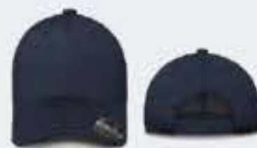
AZUL MARINO JASPE SKU: 20442-00000 UNITALLA