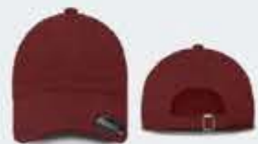
ROJO CEREZA SKU: 19842-0691 UNITALLA