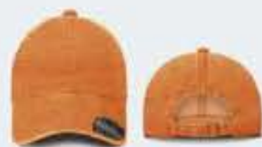
NARANJA CLARO 842 4004-8004 UNITALLA