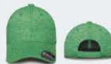
VERDE BANDERA JASPE SKU: 20442-00000 UNITALLA