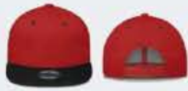
ROJO/NEGRO SKU: 42194-00016 UNITALLA