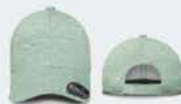
VERDE MENTA JASPE SKU: 20442-00000 UNITALLA