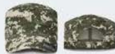
CAMUFLAJE VERDE DIGITAL SKU: 00000100000 UNITALLA