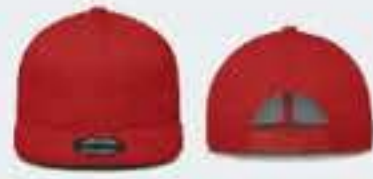
ROJO SKU: 42194-00017 UNITALLA