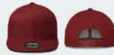
VINO SAL: 82794-02105 UNITALLA