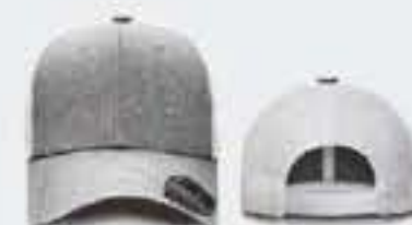
GRIS CL JASPE/BLANCO S/M - 55CM - 64CM UNITALLA