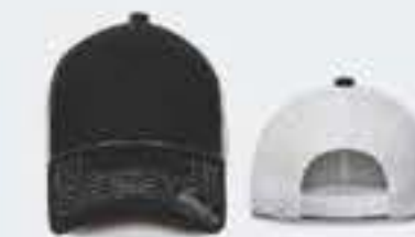
NEGRO/BLANCO SKU: 10492-01015 UNITALLA