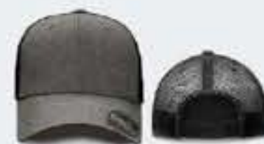
GRIS OBSC. JASPE/NEGRO S/M - 55CM - 64CM UNITALLA