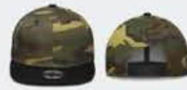
CAMUFLAJE/NEGRO SKU: 42194-00021 UNITALLA