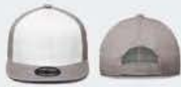
BLANCO/GRIS CL/GRIS CL SKU: 42194-00000 UNITALLA