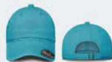
AZUL TURQUESA 842 4004-8004 UNITALLA