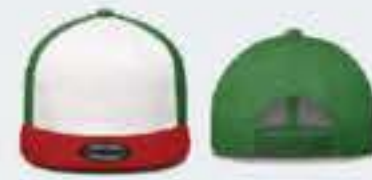
BLANCO/ROJO/V.BANDERA SKU: 42194-00005 UNITALLA