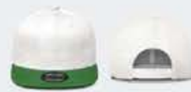
BLANCO/VERDE BANDERA SKU: 42194-00007 UNITALLA