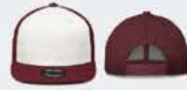
BLANCO/VINO/VINO SKU: 42194-00014 UNITALLA