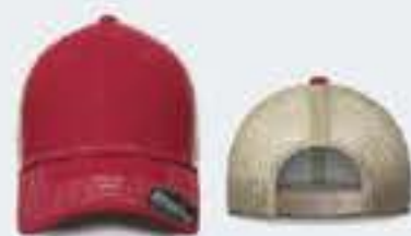
ROJO/KAKY 040. 24901-24902 / UNITALLA