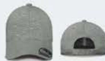
GRIS TORMENTA SKU: 20442-00000 UNITALLA