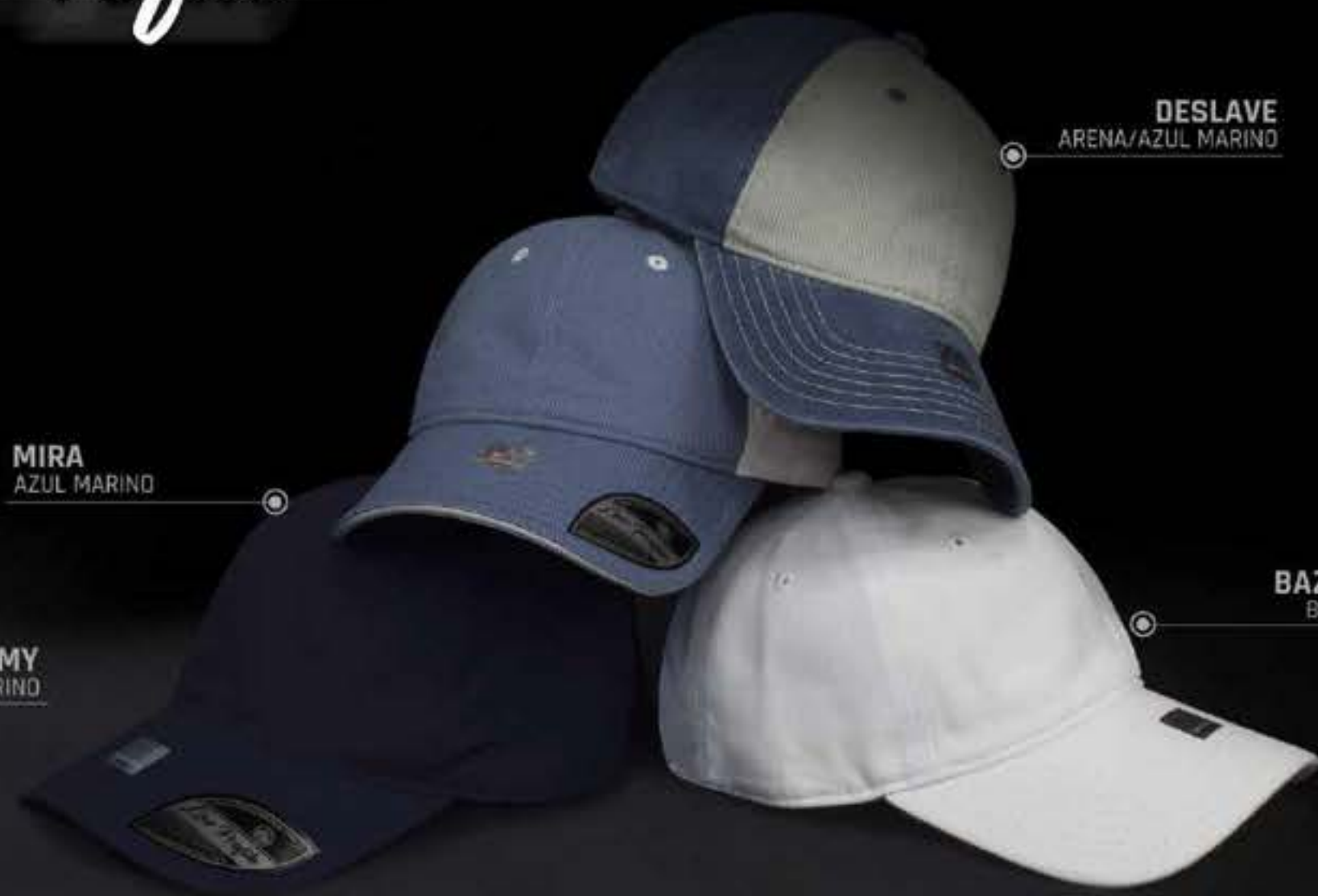
DESLAVE ARENA/AZUL MARINO