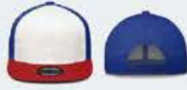
BLANCO/ROJO/A.REY SKU: 42194-00011 UNITALLA