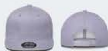
LAVANDA SKU: 8274-00000 UNITALLA