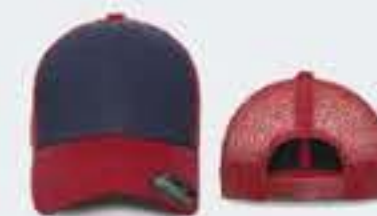
A.MARINO/ROJO/ROJO SKU: 10492-01021 UNITALLA