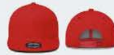
ROJO SAL: 82794-02113 UNITALLA