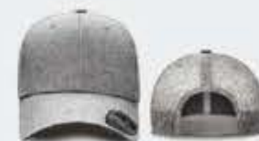
GRIS CL JASPE/GRIS CL S/M - 55CM - 64CM UNITALLA