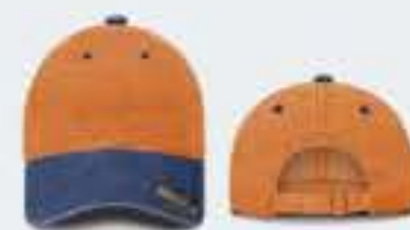
NARANJA CLARO/MARINO 842 4004-8004 UNITALLA