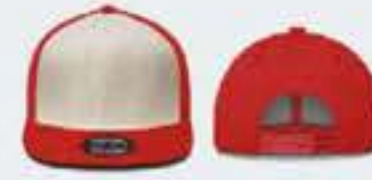
ARENA JASPE/ROJO/ROJO SAL: 82794-02106 UNITALLA