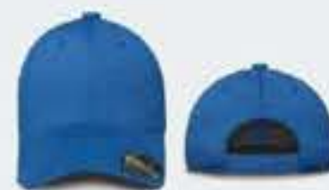
AZUL REY JASPE SKU: 20442-00000 UNITALLA