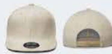
ARENA JASPE SAL: 82794-02101 UNITALLA