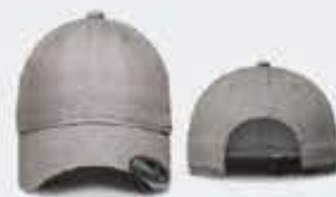
GRIS CLARO/NEGRO SOL. 40/42-44/46 UNITALLA