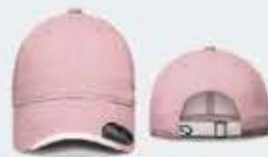
ROSA PASTEL/BLANCO SOL. 40/42-44/46 UNITALLA