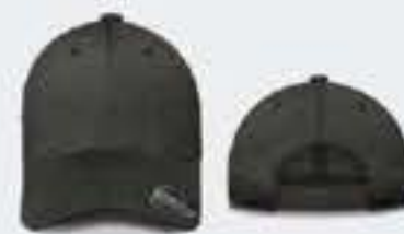
NEGRO JASPE SKU: 20442-00000 UNITALLA