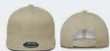
ARENA SKU: 8274-00000 UNITALLA