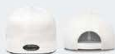
BLANCO SKU: 8274-00000 UNITALLA