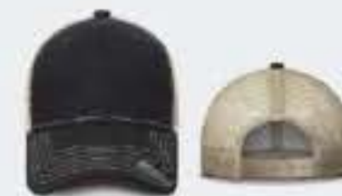
NEGRO/KAKY SKU: 10492-01013 UNITALLA