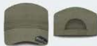
VERDE OLIVO SKU: 00000100000 UNITALLA