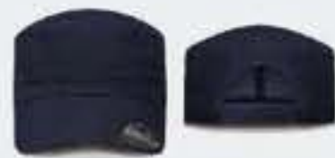
AZUL MARINO SKU: 00000100000 UNITALLA