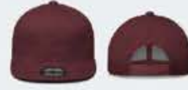
VINO SKU: 42194-00015 UNITALLA