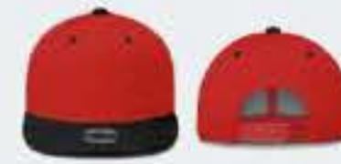
ROJO/NEGRO SAL: 82794-02114 UNITALLA