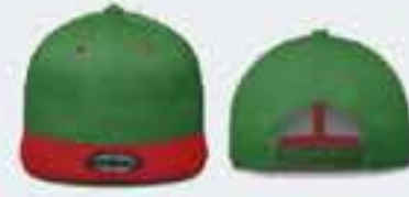
VERDE BANDERA/ROJO SKU: 42194-00018 UNITALLA