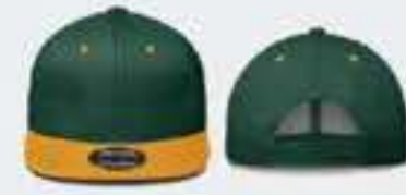
SKU: 42194-00022 UNITALLA