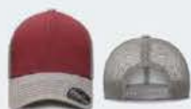
VINO/GRIS/GRIS 040. 24901-24902 / UNITALLA