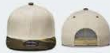
ARENA JASPE/CAMUFLAJE SAL: 82794-02104 UNITALLA