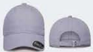
LAVANDA SKU: 19842-0700 UNITALLA