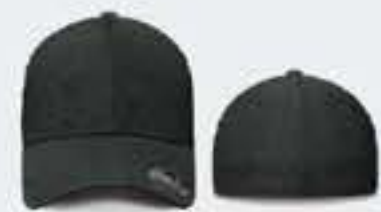
NEGRO 50% 55000-40000 UNITALLA