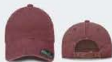
VINO 842 4004-8004 UNITALLA