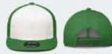
BLANCO/V.BANDERA/V.BANDERA SKU: 42194-00006 UNITALLA