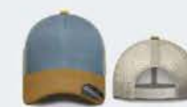
A.ACERO/A.TRIGO/ARENA SKU: 10492-01031 UNITALLA