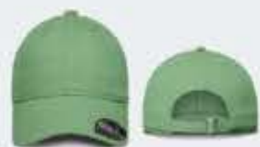
VERDE MENTA SKU: 19842-0693 UNITALLA