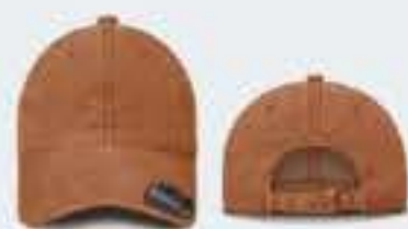
NARANJA LADRILLO 842 4004-8004 UNITALLA