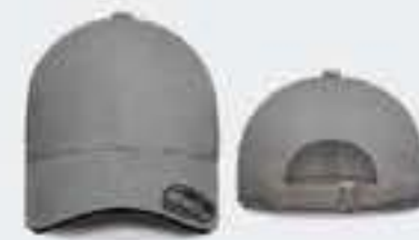
GRIS CLARO/SW NEGRO