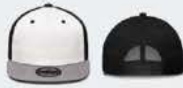
BLANCO/GRIS CL/NEGRO SKU: 42194-00001 UNITALLA