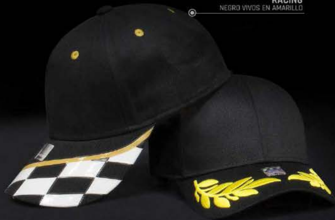
RACING NEGRO VIVOS EN AMARILLO