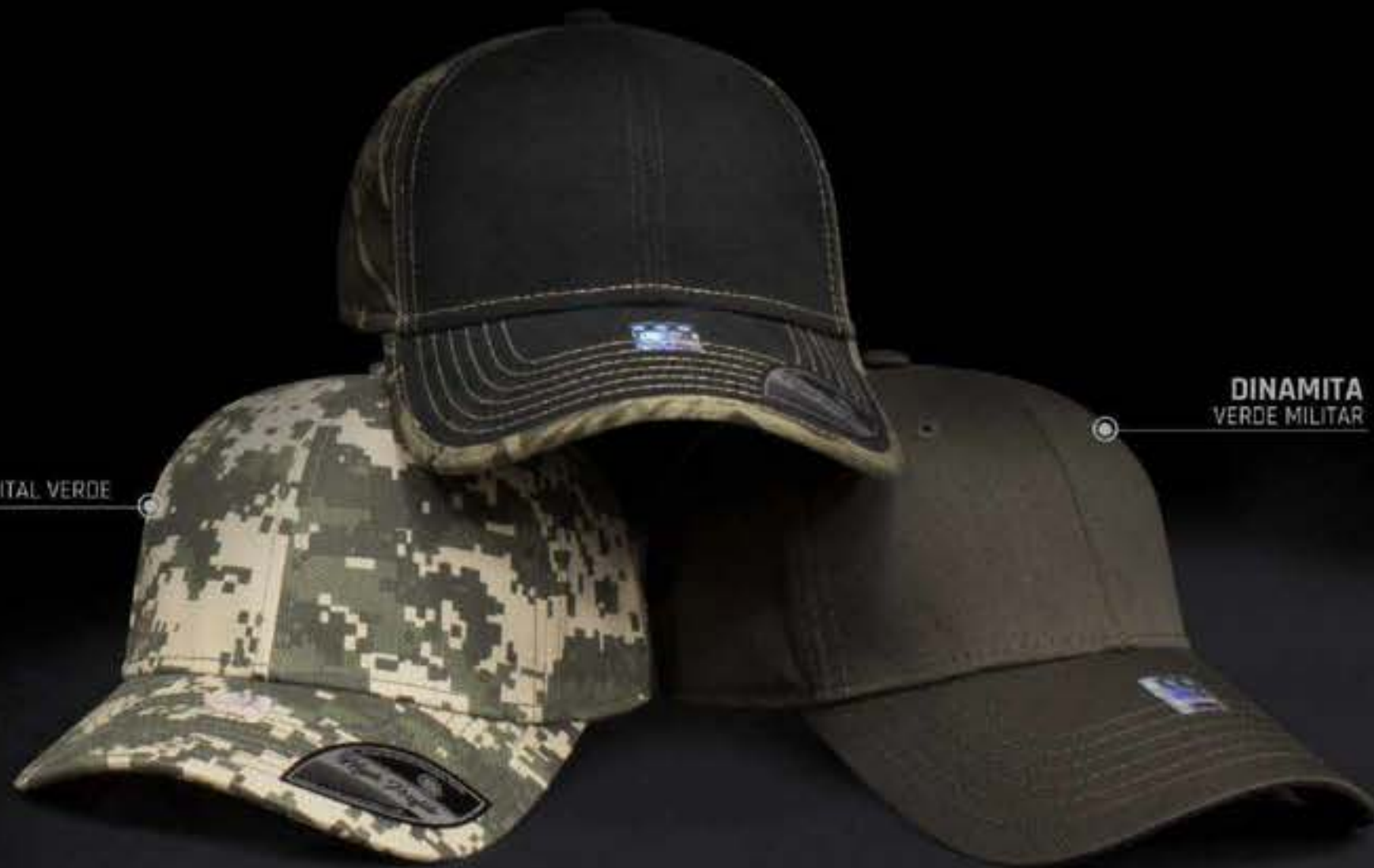
DINAMITA VERDE MILITAR