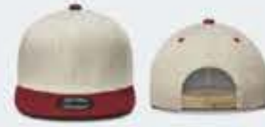
ARENA JASPE/VINO SAL: 82794-02105 UNITALLA