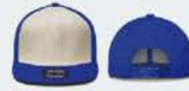
ARENA JASPE/A.REY/A.REY SAL: 82794-02105 UNITALLA