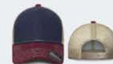
A.MARINO/VINO/KAKY SKU: 10492-01023 UNITALLA