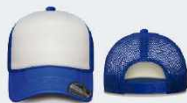
BLANCO/AZUL REY SKU: E280H-00221 UNITALLA