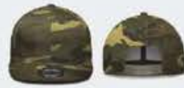
CAMUFLAJE VERDE MILITAR SKU: 42194-00020 UNITALLA