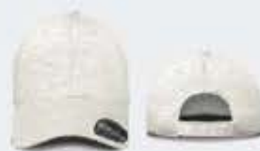
BLANCO NUBE SKU: 20442-00000 UNITALLA