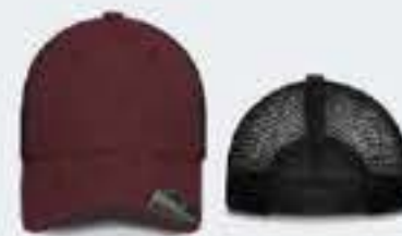
ROJO CEREZA/NEGRO ONE SIZE/FITTED