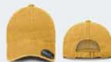
AMARILLO MOSTAZA 842 4004-8004 UNITALLA