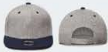
GRIS CL JASPE/A.MARINO SAL: 82794-02102 UNITALLA