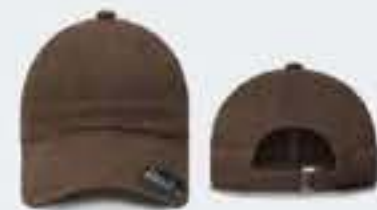
CAFÉ SKU: 19842-0693 UNITALLA