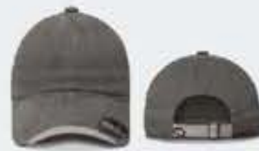
GRIS OBS/GRIS CLARO SOL. 40/42-44/46 UNITALLA