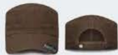
CAFÉ SKU: 00000100000 UNITALLA