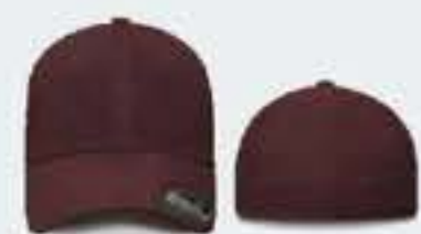
VINO 50% 55000-40000 UNITALLA