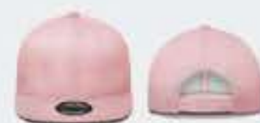
ROSA PASTEL SKU: 8274-00000 UNITALLA