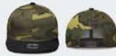
CAMUFLAJE/NEGRO SAL: 82794-02110 UNITALLA