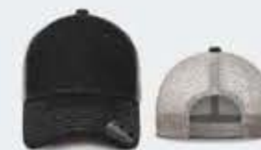
NEGRO/GRIS CLARO SKU: 10492-01014 UNITALLA