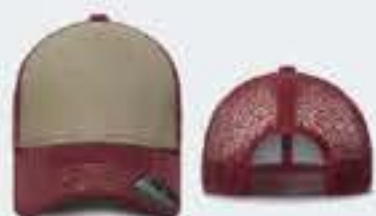
KAKY/VINO/VINO 040. 24901-24902 / UNITALLA