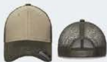
KAKY/VERDE MILITAR 040. 24901-24902 / UNITALLA