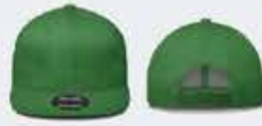
VERDE BANDERA SKU: 42194-00019 UNITALLA