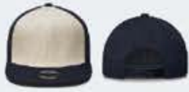
ARENA JASPE/A.MARINO/A.MARINO SAL: 82794-02108 UNITALLA