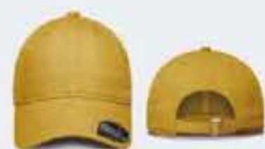
AMARILLO MOSTAZA SKU: 19842-0696 UNITALLA