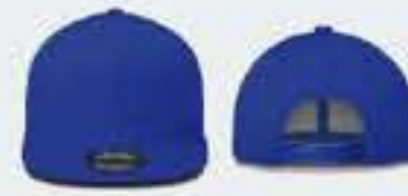
AZUL REY SAL: 82794-02117 UNITALLA