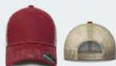
VINO/KAKY 040. 24901-24902 / UNITALLA