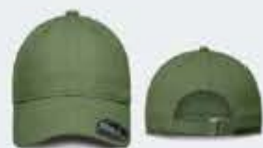
VERDE MUSGO SKU: 19842-0692 UNITALLA