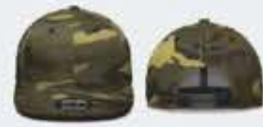
CAMUFLAJE VERDE MILITAR SAL: 82794-02111 UNITALLA