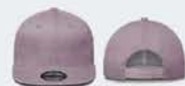
LILA SKU: 8274-00000 UNITALLA