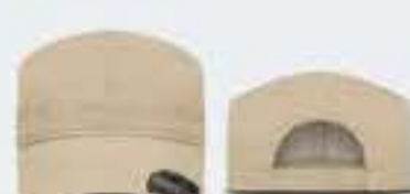
ARENA SKU: 00000100000 UNITALLA