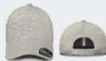
GRIS CLARO JASPE SKU: 20442-00000 UNITALLA