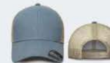
AZUL ACERO/KAKY SKU: 10492-01032 UNITALLA