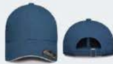
AZUL ACERO/SW BLANCO