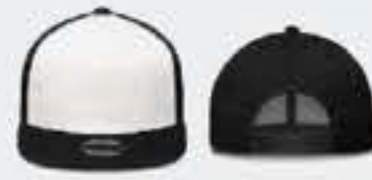
BLANCO/NEGRO/NEGRO SKU: 42194-00002 UNITALLA