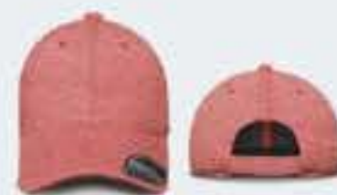
ROJO JASPE SKU: 20442-00000 UNITALLA