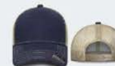
AZUL MARINO/KAKY SKU: 10492-01024 UNITALLA