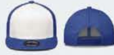
BLANCO/A.REY/A.REY SKU: 42194-00012 UNITALLA