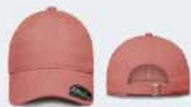
ROSA CORAL SKU: 19842-0697 UNITALLA