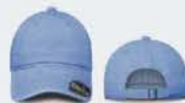
AZUL CIELO 842 4004-8004 UNITALLA