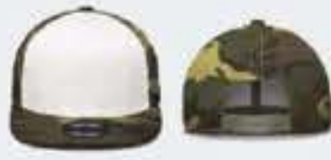
BLANCO/CAMU/CAMU SKU: 42194-00008 UNITALLA