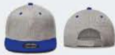
GRIS CL JASPE/AZUL REY SAL: 82794-02103 UNITALLA