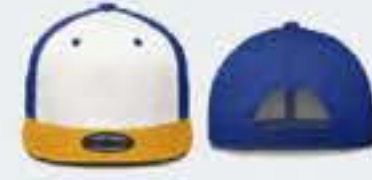
BLANCO/A.MANGO/A.REY SKU: 42194-00013 UNITALLA