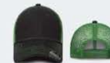
NEGRO/VERDE BANDERA SKU: 10492-01016 UNITALLA