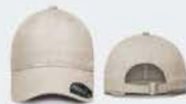
ARENA SKU: 19842-0695 UNITALLA