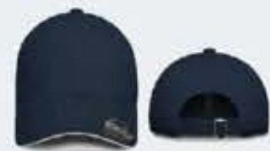
AZUL MARINO/SW BLANCO