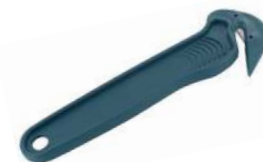
Art.nr. P2069 CaluDetect veiligheidsmes UNI

Voor het openen van diverse verpakkingen. Gemaakt van metaaldetecteerbare blauwe kunststof onderdelen. Voorzien van terugverend rvs mes (niet inwisselbaar).