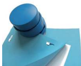
Art.nr. P0092B CaluDetect nietloze nietmachine

De CaluDetect detecteerbare nietmachine voegt maximaal 4 vellen papier samen zonder metalen nietjes.