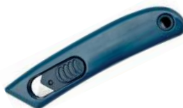
Art.nr. 01162 CaluDetect Smartcut veiligheidsmes

Detecteerbaar veiligheidsmes voor het snel en eenvoudig snijden van (plastic) zakken en meerdere lagen papier.