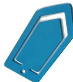
Art.nr. P0370B CaluDetect paperclip Detecteerbare paperclip, verkrijgbaar in verschillende afmetingen en kleuren. Voorkomt het gebruik van nietjes of traditionele paperclips.