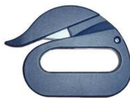
Art.nr. 01122 CaluDetect Swan veiligheidsmes

Detecteerbaar veiligheidsmes voor het snel en eenvoudig snijden van (plastic) zakken en meerdere lagen papier.