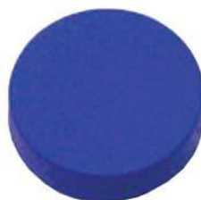
Art.nr. P0392B CaluDetect magneet voor whiteboard De CaluDetect detecteerbare magneet voor whiteboards is beschikbaar in de kleuren blauw, geel, groen en rood.