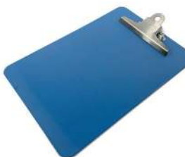
Art.nr. P0075B CaluDetect klembord A4 Zeer sterk en lichtgewicht klembord met RVS clip in A4 formaat. Compleet detecteerbaar en eenvoudig te reinigen.

De CaluDetect detecteerbare nietmachine voegt maximaal 4 vellen papier samen zonder metalen nietjes.