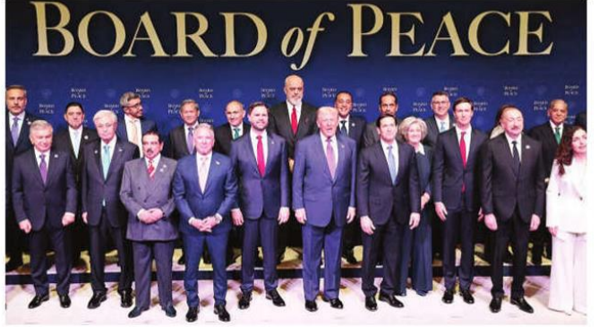
இந்தியா உருவாக்கும் அமைதி குழு

அமைதிக்கு முன்முதல் கூட்டத்தில் அறிவிப்பு