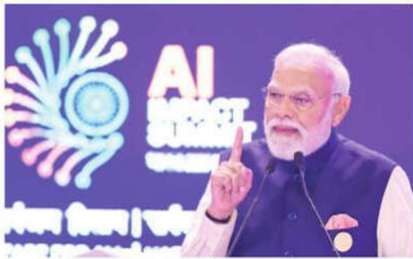
ஏ.ஐ. தாக்க உச்சிமாநாட்டில் பேசிய பிரதமர் நரேந்திர மோடி.

புது தில்லி, பிப். 19: செயற்கை நுண்ணறிவு (ஏ.ஐ.) தொழில்நுட்ப பயன்பாட்டில் மக்களை மையப்படுத்திய அணுகுமுறைக்காக, இந்தியாவின் 5 அம்ச 'மானவ்' தொலைநோக்குப் பார்வையை முன்வைத்து எடுத்துரைத்தார் பிரதமர் மோடி.