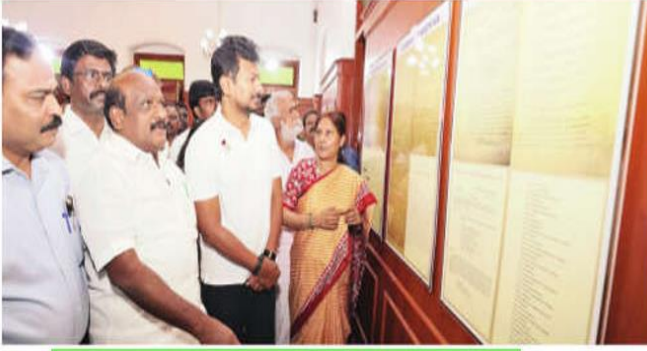
சென்னை எழும்பூரில் புனரமைக்கப்பட்ட தமிழ்நாடு ஆவணக் காப்பகம், வரலாற்று ஆராய்ச்சித் துறை கட்டடம், புதிய கண்காட்சிக் கூடத்தைத் திறந்து வைத்து, பழைய அரிய ஆவணங்களைப் பாதுகாக்க ஜப்பானிய திசு முறையில் செப்பனிடும் பணியை தொடங்கி வைத்த துணை முதல்வர் உதயநிதி ஸ்டாலின். உடன் அமைச்சர்கள் பி.கே.சேகர்பாபு,