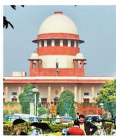
போது, நாட்டில் உள்ள பெரும்பாலான மாநிலங்கள் வருவாய்ப்பற்றாக்குறை உள்ள மாநிலங்களாக இருந்தாலும், அவை இதுபோன்ற இலவசங்களை வழங்குகின்றன என்று நீதிபதிகள் கூறினர்.