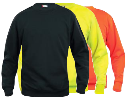
CLIQUE BASIC ROUND-NECK 6500-021030

O-aukkoinen collegepaita, jonka mitoitus sopii sekä miehille että naisille. Paksu niskanauha, joustava resori helmassa ja hihansuissa.