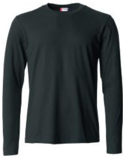
CLIQUE BASIC-T L/S 6500-029033

T-paitojen ehdoton klassikko nykyaikaisella mitoituksella. Laadukasta esikutistettua, rengaskehrättyä kampapuvillaa. Kaksinkertainen kaularesori, jossa joustavaa elastaania.