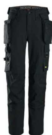
SNICKERS 6771 6500-677104040

Rakentajan housut naisille neljään suuntaan joustavilla stretch paneeleilla. Valmistettu kevyestä ja kestävästä materiaalista, jossa mekaaninen jousto, osa materiaalista kierrätettyä polyesteriä. Mukavat työhousut, joissa kaikki tarvittavat toiminnot ja ominaisuudet.