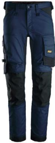
SNICKERS 6341 6500-634195040

Kapealahkeiset ja mukavat stretch-työhousut tarjoavat erinomaista käyttömukavuutta takaosan joustopaneelin avulla. CORDURA-vahvistetut KneeGuard -polvisuojataskut tarjoavat kestävyttä ja lisäsuojaa. Riipputaskuissa, nivelmittataskussa ja reisitaskuissa on myös CORDURA-vahvistus lisäämässä housujen elinikää. Pesulämpötila enintään 40°C.