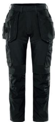
FRISTADS 2599 LWS 6500-133931-940

Naisten rakentajan housut yhdistävät keveyden, joustavuuden ja kestävyys. Neljään suuntaan joustava stretch-materiaali ja ripstop-vahvikkeet takaavat erinomaisen liikkumavapauden ja kulutuskestävyyden. Monipuoliset, vahvistetut taskut, joustavat polvitaskut korkeudensäädöllä sekä heijastavat yksityiskohdat tekevät housuista käytännölliset ja turvalliset vaatimaan työhön.