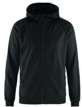
CRAFT ADV UNIFY FZ 6500-1909132-

Hupparitakki jossa antistaattinen vetoketju. Resori helmassa ja hihansuissa. Taskussa kuminauhapidike kännykälle/ musiikkilaitteelle, lisäksi kauluksessa kiinnityslenkki ja taskun sisäpuolella aukko kuulokejohtoa varten.