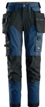
SNICKERS 6775 6500-677595040

Stretch-työhousut 4-suuntaisesta joustokankaasta mukautuvat työasentoihin ja takaavat erinomaisen istuvuuden. Stretch Cordura® -polviosat ja muotoillut lahkeet lisäävät liikkuvuutta. Vetoketjuiset CORDURA®-riipputaskut, nivelmittatasku ja työkalupidikkeet tehostavat säilytystä. EN 14404 -sertifioitu KneeGuard™-polvisuojajärjestelmä. Slim fit.