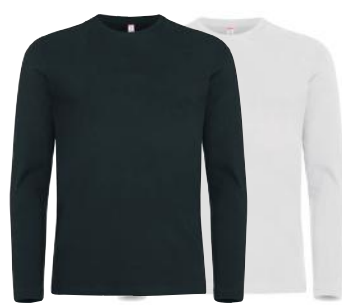
CLIQUE PREMIUM FASHION-T L/S 6500-029358

Pitkähihainen t-paita, kapeampi malli. Niskanauha ja joustava kaularesori. Miesten malli on saumaton, naisten mallissa on sivusaumat. Teipattu niskasauma, joustava kauluresori sekä käännetty olkasauma.