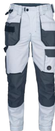
CERVA DAYBORO LADY 6500-3520061800

Rakentajan puuvillahousut on suunniteltu työskentelymukavuus ja kestävyys edellä. Kulutusta kestävä 100 % puuvilla sopii erityisesti maalareille, sillä se imee hyvin maalia. Monipuoliset taskuratkaisut, CORDURA®-vahvistukset, muotoillut polvet ja polvisuojataskut tekevät housuista käytännölliset ja pitkäikäiset vaatimaan työhön.