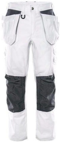
FRISTADS 258 BM 6500-100120-900

Riipputaskulliset puuvillahousut esimerkiksi maalaustöihin. CORDURA®-vahvistetut polvisuojataskut. Monipuolisten varustetaskujen lisäksi kiinnikkeet puukolle ja henkilökorttitaskulle.