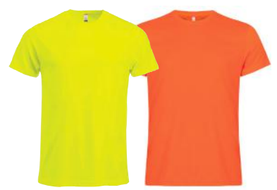
CLIQUE NEW CLASSIC-T 6500-029360

Miesten Proact tekninen T-paita musta. Kevyt Quick-dry materiaali. Raglan hihat ja kaksoistikkaus-viimeistely. Materiaali 100% polyesteri, paino 140g/m 2 .