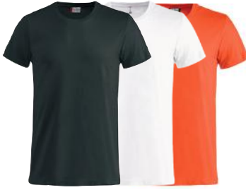
CLIQUE BASIC-T 6500-029030

Unisex T-paita, muotoonleikattu kapeampi malli. Teipattu niskasauma, joustava kauluresori sekä käännetty olkasauma.