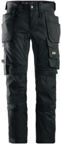
SNICKERS 6241 6500-62410404

Kapealahkeiset ja mukavat stretch-työhousut tarjoavat erinomaista käyttömukavuutta takaosan joustopaneelin avulla. CORDURA-vahvistetut KneeGuard -polvisuojataskut tarjoavat kestävyttä ja lisäsuojaa. Riipputaskuissa, nivelmittataskussa ja reisitaskuissa on myös CORDURA-vahvistus lisäämässä housujen elinikää. Pesulämpötila enintään 40°C.