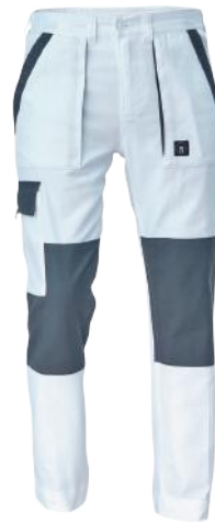
CERVA MAX NEO 6500-03520073800

Erittäin joustava työhousu esimerkiksi maalaustöihin. Monipuoliset ja tilavat varustetaskut sekä polvisuojataskut. Pidennettävät lahkeet.