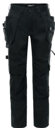
FRISTADS 2901 GWM 6500-301223-940

Naisten rakentajan housut yhdistävät keveyden, joustavuuden ja kestävyys. Neljään suuntaan joustava stretch-materiaali ja ripstop-vahvikkeet takaavat erinomaisen liikkumavapauden ja kulutuskestävyyden. Monipuoliset, vahvistetut taskut, joustavat polvitaskut korkeudensäädöllä sekä heijastavat yksityiskohdat tekevät housuista käytännölliset ja turvalliset vaatimaan työhön.