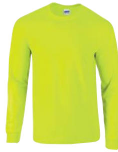
GILDAN 2400 6500-G2400

Moderni pitkähihainen laadukas paita, joka on valmistettu rengaskehrätystä puuvillasta. Kaksinkertainen kaularesori, sivusaumat ja vahvistettu niskasauma. Paita on esikutistettu ja entsyymikäsitelty.