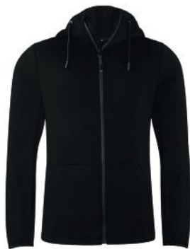
CUTTER&BUCK PEMBERTON 6500-358418

O-aukkoinen collegepaita, jonka mitoitus sopii sekä miehille että naisille. Paksu niskanauha, joustava resori helmassa ja hihansuissa.