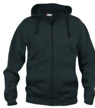
CLIQUE BASIC HOODY FZ 6500-021034

Mukava huppari, joka on valmistettu pehmeästä ja joustavasta kierrätetystä polyesteristä. Kaksi vetoketjullista sivutaskua. Ergonominen, joustava istuvuus.