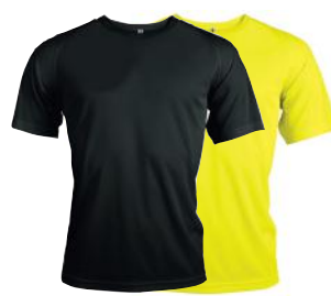
PROACT PA438 6500-PA438

Laadukas single jersey T-paita modernilla leikkauksella, kaksinkertainen kaularesori ja niskanauha.