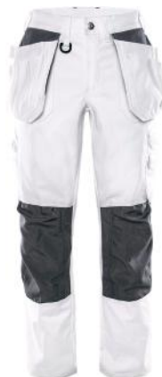
FRISTADS 259 BM 6500-100121-900

Naisten tuulenpitävät, kehoa mukailevat housut tarjoavat optimaalisen mukavuuden ja liikkuvuuden. Hengittävät paneelit, irrotettavat CORDURA®-riipputaskut sekä vetoketju- ja viivaintasku. Työkalupidikkeet pitävät varusteet käden ulottuvilla. Slim fit, CORDURA®-vahvistetut joustopolvipaikat ja tila lisäpolvisuojille.