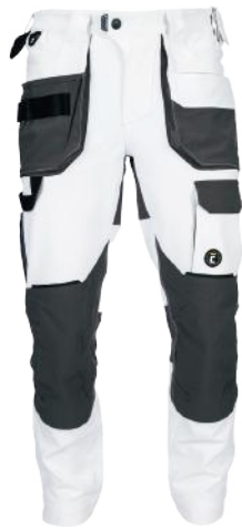
CERVA DAYBORO PFM 6500-3520140800

Riipputaskulliset puuvillahousut esimerkiksi maalaustöihin. CORDURA®-vahvistetut polvisuojataskut. Monipuolisten varustetaskujen lisäksi kiinnikkeet puukolle ja henkilökorttitaskulle.