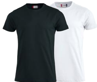
CLIQUE PREMIUM-T 6500-029340

Unisex T-paita, muotoonleikattu kapeampi malli. Teipattu niskasauma, joustava kauluresori sekä käännetty olkasauma.