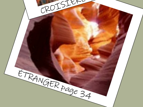
ÉTRANGER page 34