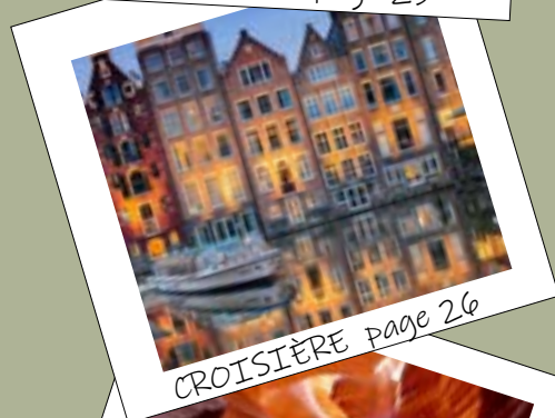
CROISIÈRE page 26