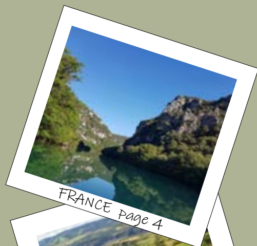
FRANCE page 4