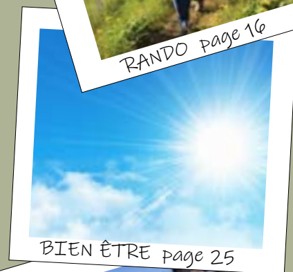
BIEN ÊTRE page 25