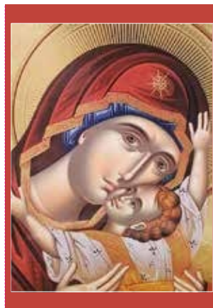
Syrië, Icoon van de Moeder Gods van de Tederheid