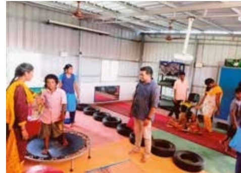
Dove en slechthorende kinderen in het Navahvani centrum

Dat krijgt concreet vorm in diverse activiteiten. Via programma's met verschillende organisaties tracht het centrum mensen bewust te maken van de waarde van doven en slechthorenden in de samenleving . Ze ondersteunen ouders van dove of slechthorende kinderen door samen te werken met scholen. Ze helpen doven en slechthorenden met het officiële papierwerk om hun rechten van de overheid te krijgen. Ze verlenen ook steun in de vorm van loopbaanbegeleiding, raadgeving, gemeenschapsvorming en publieke participatie. Ze versterken doven en slechthorenden ook in hun recht om