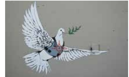
Muurschildering in Bethlehem

“Ja, in deze tijd is onze gebedssolidariteit, maar ook actieve hulpondersteuning in het Heilig Land essentieel om te overleven. De situatie ter plaatse is moeilijk en het is heel belangrijk dat we onze broeders en zusters daar niet vergeten.”